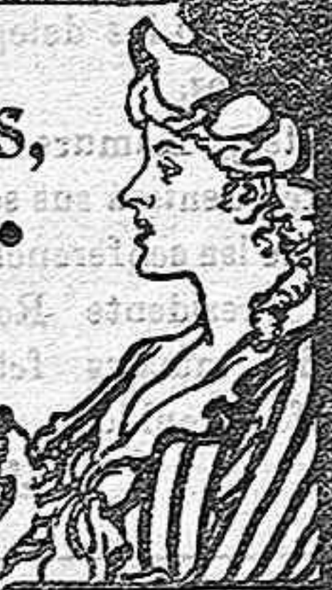
Acerque el grabado a los ojos y verá Vd. la píldora entrar en la boca.