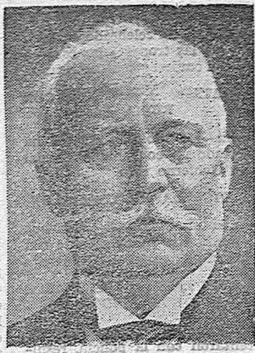
LUENDORFF célebre general alemán en la Gran Guerra, que ayer cumplió los 79 años

En la Avenida de la República, varios jovencitos de esos que llevan en la solapa el puñado de rayos de la J. A. P., y en las cejas las huellas del paso de unas pinzas, hablan de cosas tan insubstanciales como los puntos de su partido o los discursos del jefe de su minoría en el Ayuntamiento. Finaliza la conversación y se deshace la tertulia; todos cumplen la ritual prueba de cortesía, que es la despedida elevando el brazo hasta colocarlo en una posición casi horizontal; uno de ellos, tan pedante como los demás, exagera el saludo y sube la extremidad con el ímpetu de quien va a lanzar una piedra; un respetable matrimonio que pasa por aquel lugar, es alcanzado por la mano del joven gamado, y el caballero recibe la «caricia» de un porrazo en pleno rostro. Una plancha y una humillación. No voy a discutir la impunidad con que estos salvadores de la patria realizan los provocativos actos que la doctrina de su partido les exige; si las autoridades encargadas de evitarlo no lo hacen, qué remedio queda. Lo que sí hay que poner de relieve es el ridículo tan lamentable y la figura destaralada de estos «go mositos» al hacer su saludo, que más bien parece el intento de vuelo que un borriquito quisiera llevar a cabo, o el acto que se realiza para comprobar si cae agua en un día nublado. De continuar libremente autorizados esta clase de saludos, va a ser imprescindible salir a la calle con una coraza reforzada.