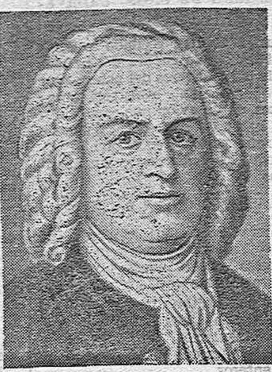
JUAN SEBASTIAN BACH Hoy, 21 de marzo, hace 250 años que el célebre compositor alemán nació en Eisenach

Los mejores cot-tail los sirve esta Casa a 0,75.—Cerveza clara helada y bien tirada.—Bocadillos económicos Plaza Ramón y Cajal, núm. 2