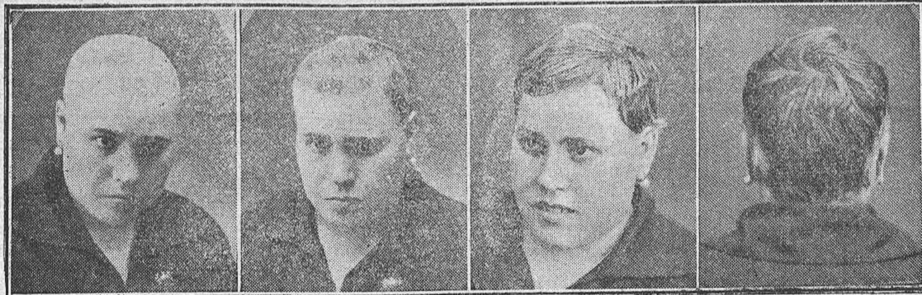
Calvo 14 años 5 meses tratamiento 8 meses 10 meses

De 9 a 1 mañana y de 2 a 7 tarde, visitará, gratuitamente y a domicilio, avisando previamente a dicho Hotel. Instituto J. Mourade, BARCELONA, Rambla de las Flores, 4, primero. En Madrid: Fuencarral, 15. CONSULTA PRIMERA TRATAMIENTO GRATUITO. Desinfectante, 10 pesetas. Capilar, 20 pesetas. Curación completa, 5 frascos y de regalo uno. Ambos productos forman parte del tratamiento.