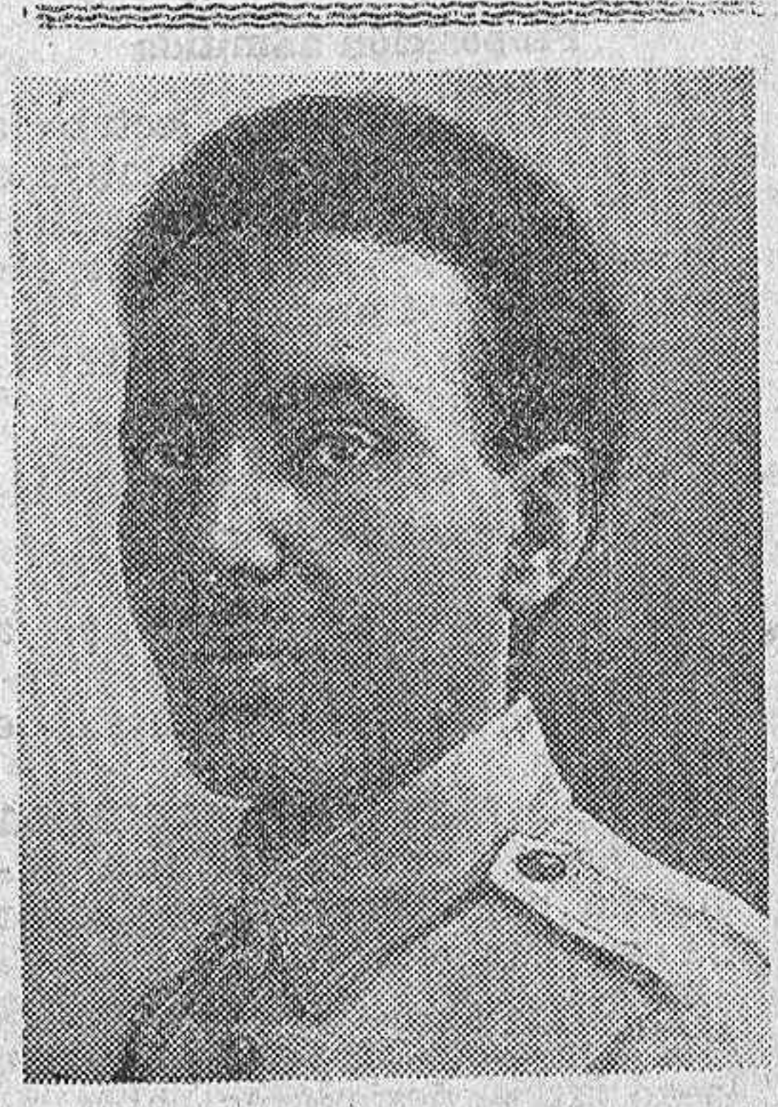
General Nasibu, comandante en jefe de las tropas etíopes en el frente Sur

hembras tarifadas se ha paseado triunfal en Almería en los coches oficiales que paga el Estado para el uso de sus servidores, con la misma cinica audacia que en la Roma pagana las meretrices de altos vuelos lucían sus impudicias en los carros triunfales. Que un desdichado subalterno municipal de menor cuantía, venga explotarlo en sitio céntrico, a pocos pasos del Ayuntamiento, un prostíbulo donde se permiten menores, donde se explota a otros subalternos de menor categoría, donde se escarnece la moral con asentimiento de todo el mundo, ¿qué importancia puede tener? —El mal está en el ambiente. Unos por omisión, y otros por complacencia, todos contribuyen a silenciar hechos de este calibre, que denigran, no ya a los que lo toleran, sino que pone a un nivel lamentable a las Corporaciones que hacen de tales sujetos representantes de su autoridad. Ha sido preciso que el escándalo trascienda, y que, por otro lado, ciertos y determinados elementos aspiren a enluchar en la posible vacante a algún panaguado o familiar, para que se ponga coto a esta vergonzosa explotación, que ha sublevado la conciencia de toda persona que aún no tiene perdida la sensibilidad. El Municipio ahora trata de ejercer sus funciones fiscales, un poco a destiempo, pero del mal el menos, y a ver ahora quién es el que está en puerta para renovar estas fechorías con el silencio o la complacencia de unos y de otros.