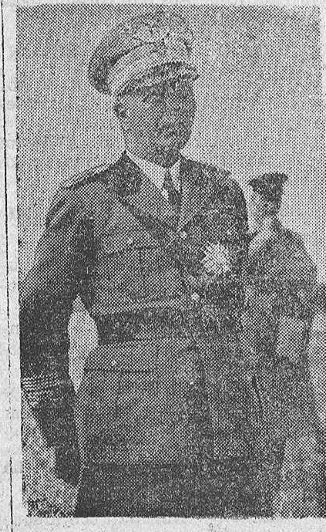
MARISCAL BADOGLIO que ha embarcado con rumbo a África del Este para encargarse del alto mando de las tropas italianas