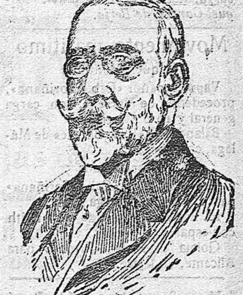
Excmo. señor don Manuel Allende Salazar, nuevo Presidente del Consejo de Ministros.