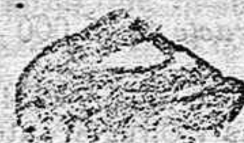
A LA HUMANIDAD SOLIENTE.

En el pasaje van incluidos los gastos de á bordo.