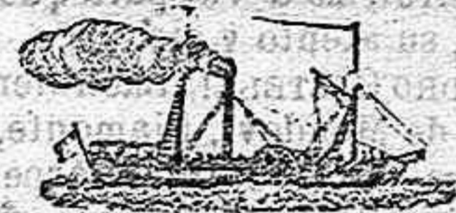
El nuevo y magnífico vapor Español TERESA.

Saldrá para ORAN todos los sábados á las 6 en punto de la tarde, admitiendo carga y pasajeros para dicho punto.