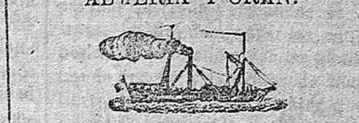
El nuevo y magnífico vapor Español TERESA.

Saldrá para ORAN todos los sábados á las 6 en punto de la tarde, admitiendo carga y pasajeros para dicho punto.