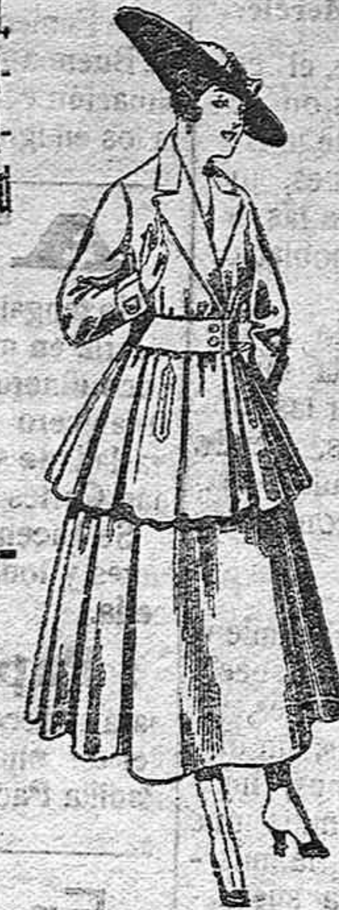
Traje de lana, en negro, azul y color, para señora, de pesetas 90 a 100.

Paletaría, Camisería, Géneros de punto, Corbatería, Guantería, Sombrerería, Zapatería, Paraguas, Bastones y Artículos de Viaje.