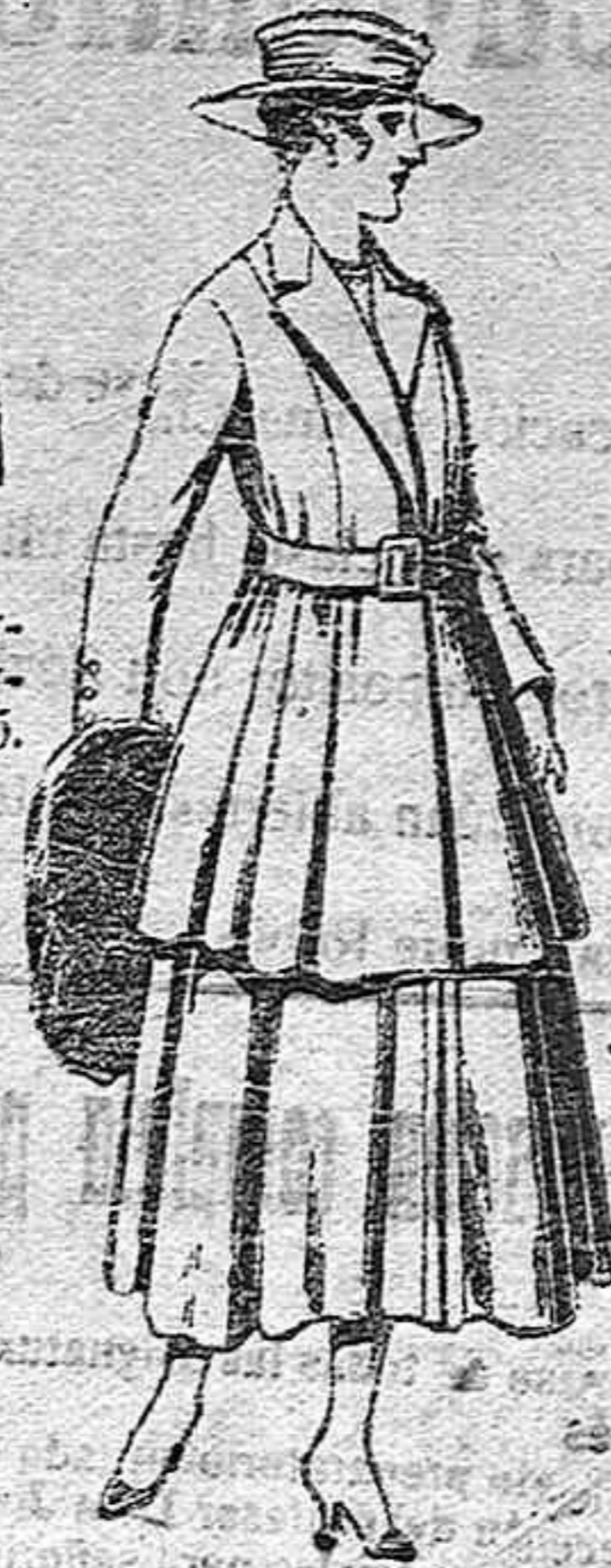
Traje de lana para señora, en color negro y azul, de pesetas 85 a 100.