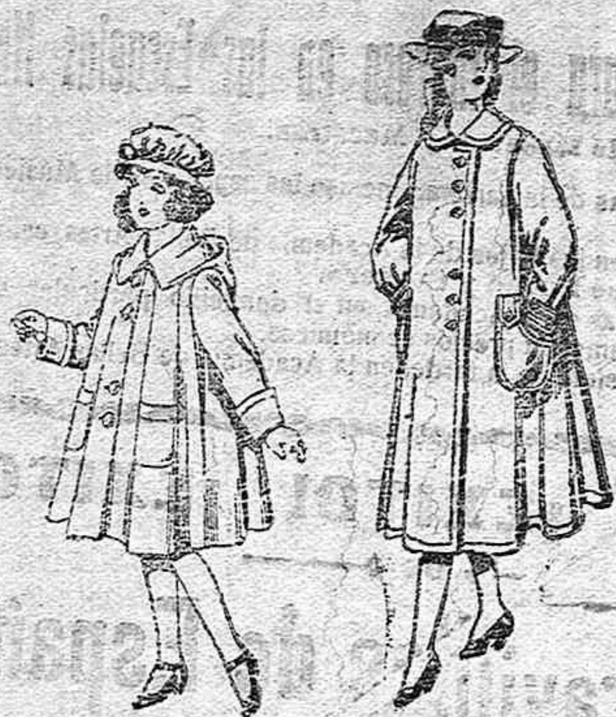
Abrigos de paten, para niñas de 4 a 9 años, de pesetas 22 a 33.