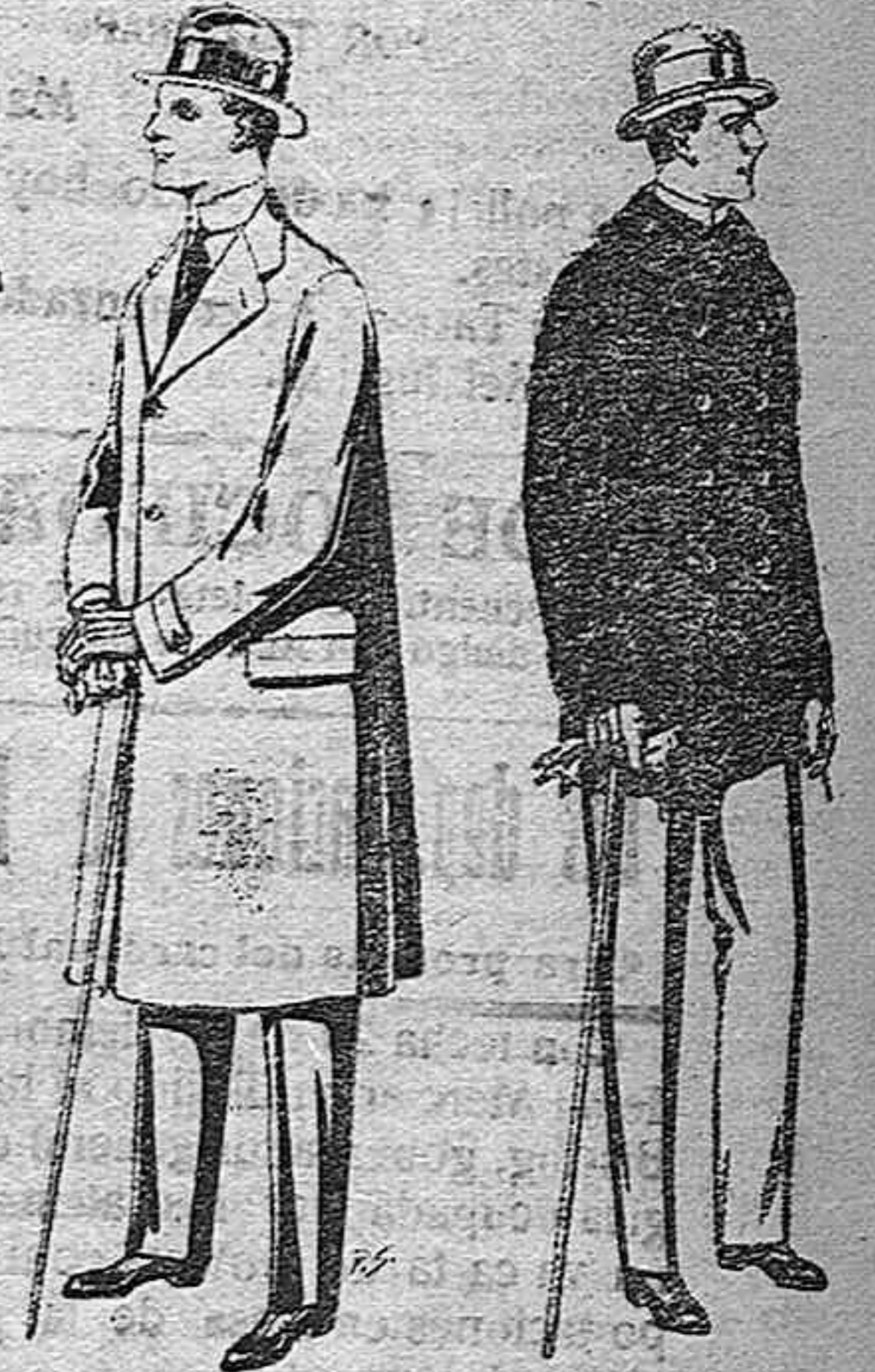
Gabanes de tejido pluma o ratina, de pesetas 33 a 100.