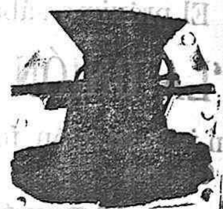
Pisadora de uva

Arados de todas clases, Cultivadores, Gradas, Bombas, Prensas y Pisadoras de uvas, Trituradores de pimientos, Desgranadoras de Maiz, desde 12 pesetas, Prensas para paja, Molinos de Viento, Norias.—Catálogos y presupuestos gratis de toda clase de Maquinaria Agrícola Industrial.