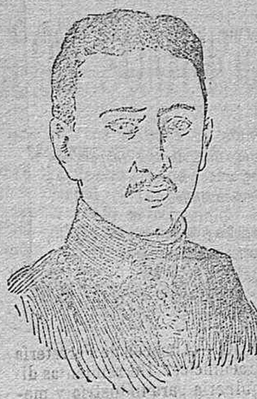
El emperador Carlos Francisco José de Austria, que se dice ha abdicado, internándose en Suiza