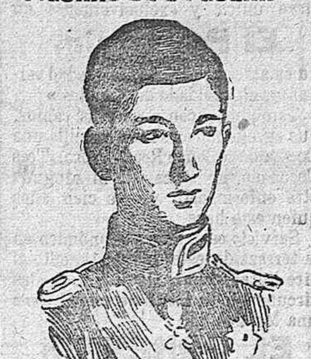
El príncipe Boris, que por abdicación del Zar Fernando I ha subido al trono de Bulgaria