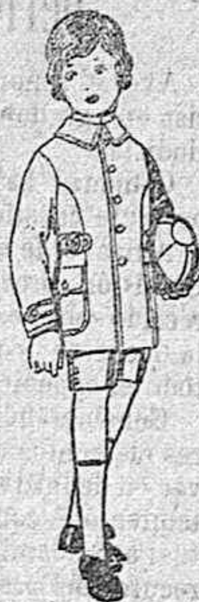
Trajes modelo sport, de lanilla, melton, etc. para niños de 4 a 9 años de ptas. 26 a 32.