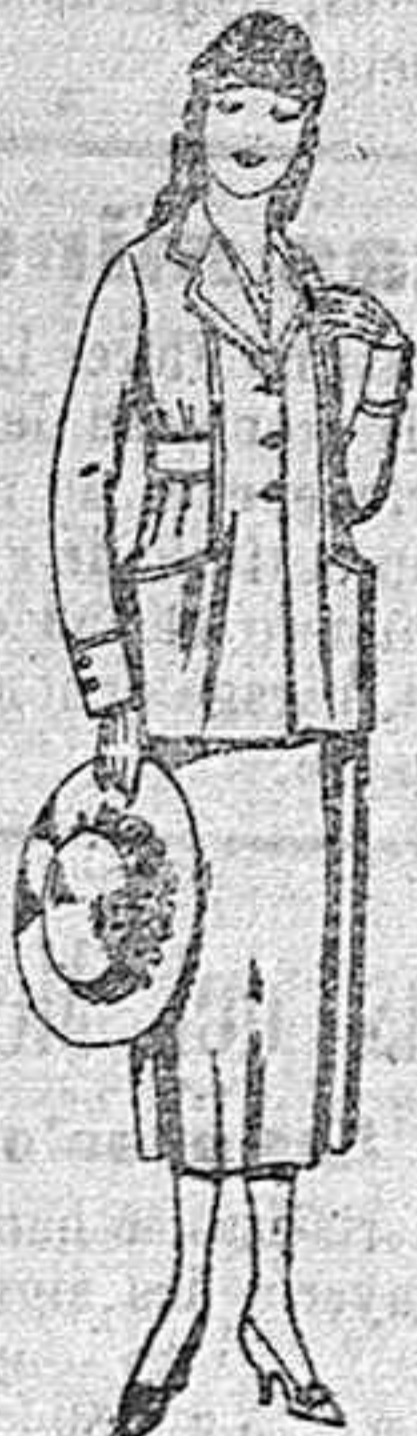
Trajes de estambre, gabardina, etc. en azul y color de ptas. 45 a 58.