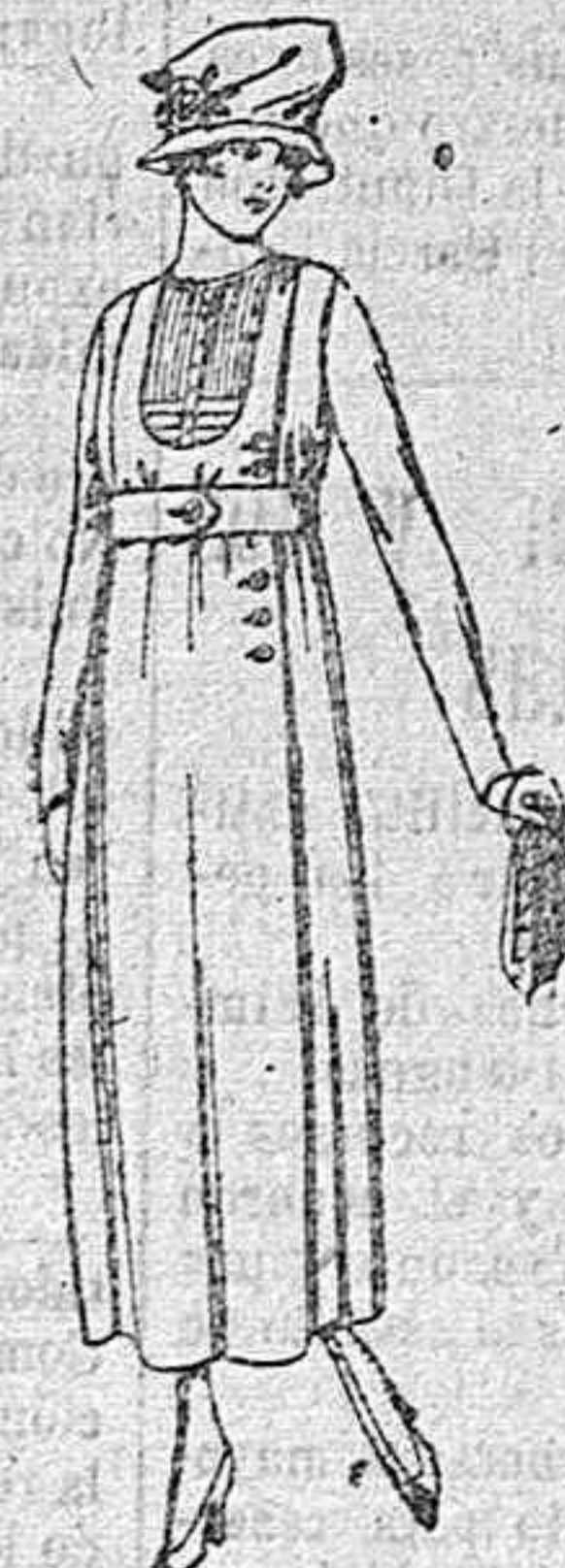
Vestidos de sarga inglesa, lanilla etc. en negro, azul y color de ptas. 60 a 75.