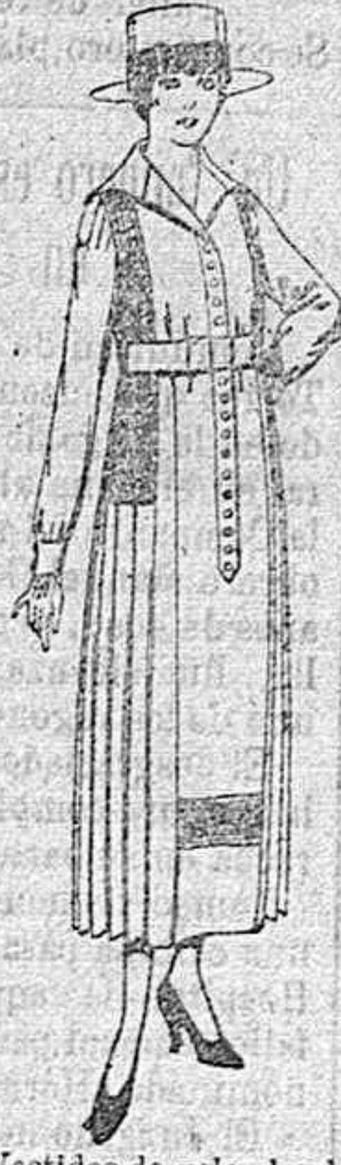
Vestidos de velo de algodón, blanco, bordados de ptas. 40 a 50.