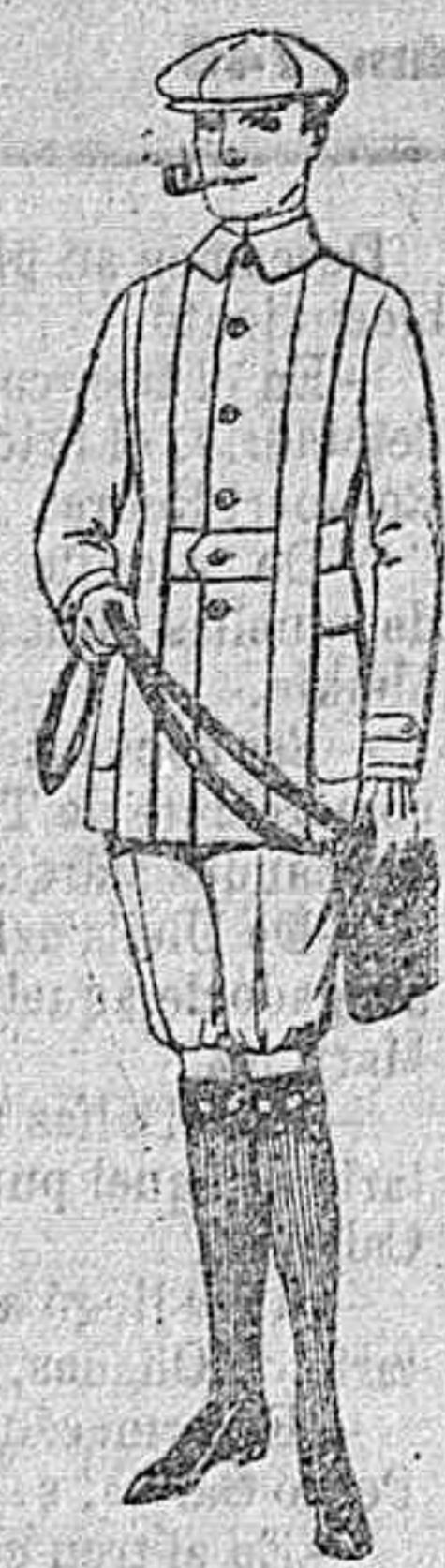
Cazadoras de dril crudo o Kaki de ptas. 15 a 18. Pantalones cortos para excursionistas, en dril, beige o gris de ptas. 9 a 15.