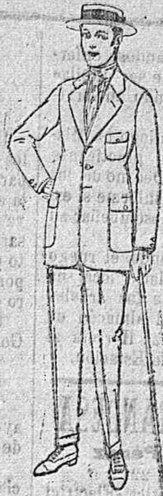
Trajes de dril crudo, Kaki o listado de ptas. 14 a 45.