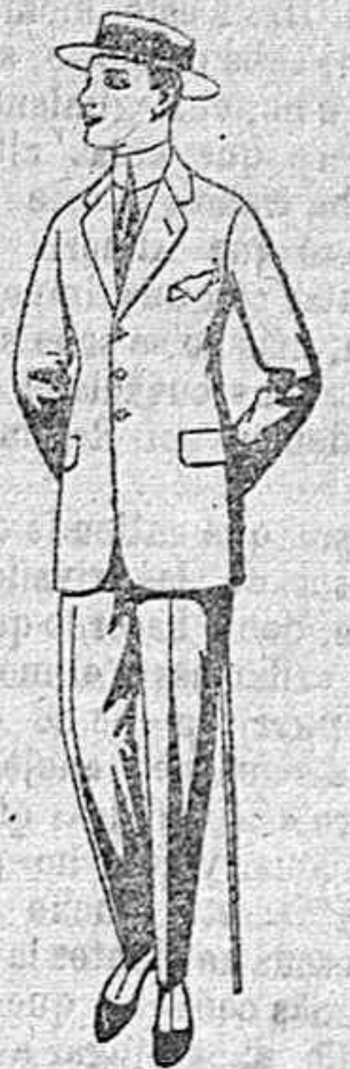
Trajes de lanilla, melton, vicuña, etc., para juveniles de 10 a 15 años de ptas. 19 a 55.