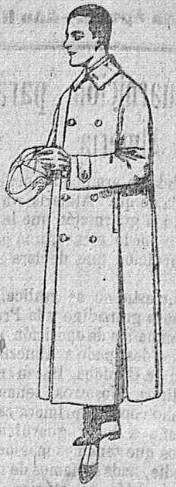
Guardapolvos de dril crudo y colores de ptas. 14 a 40.