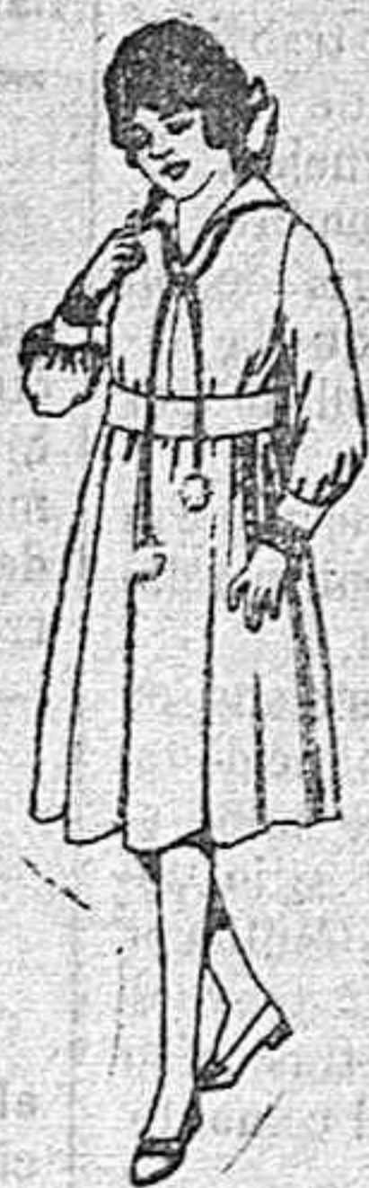
Vestidos de gabardina o estambre azul, bordados para niñas de 4 a 9 años de ptas. 25 a 30.