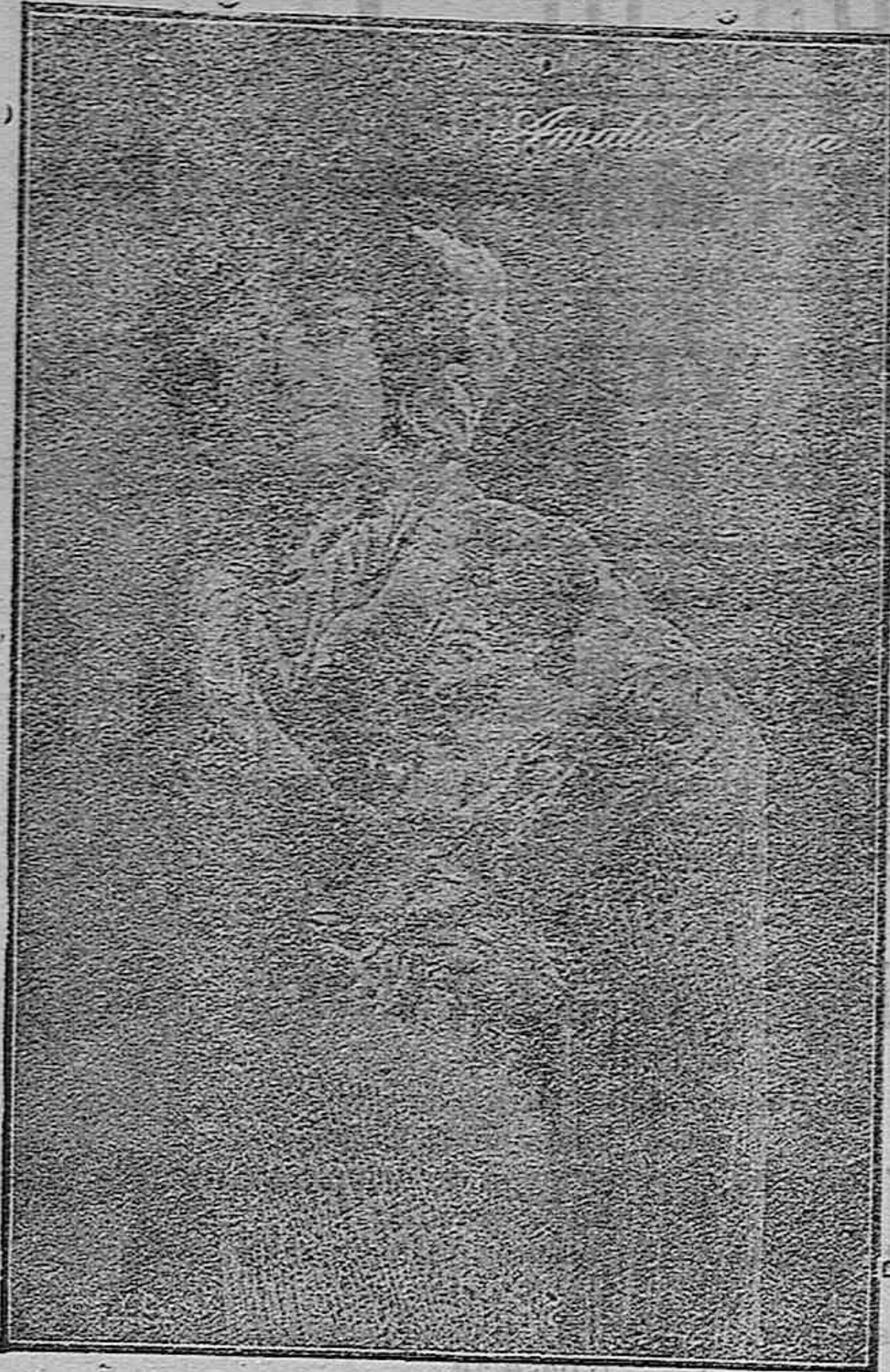
Debut de Amalia Molina

Esta noche se presentará de nuevo en el Circo de Variedades la reina de los cantos trágicos de España, Amalia Molina.