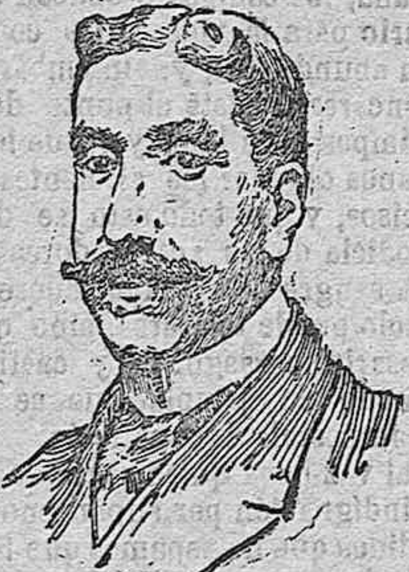
El presidente del Consejo de Ministros, D. Joaquín Sánchez de Toca.