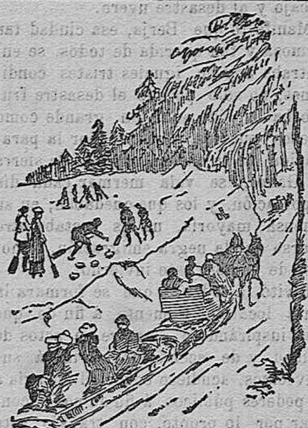
Jugando al “kurling”.—El retorno

Venta en Almería, PERFUMERIA VENUS, Puerta de Purchena, 4.