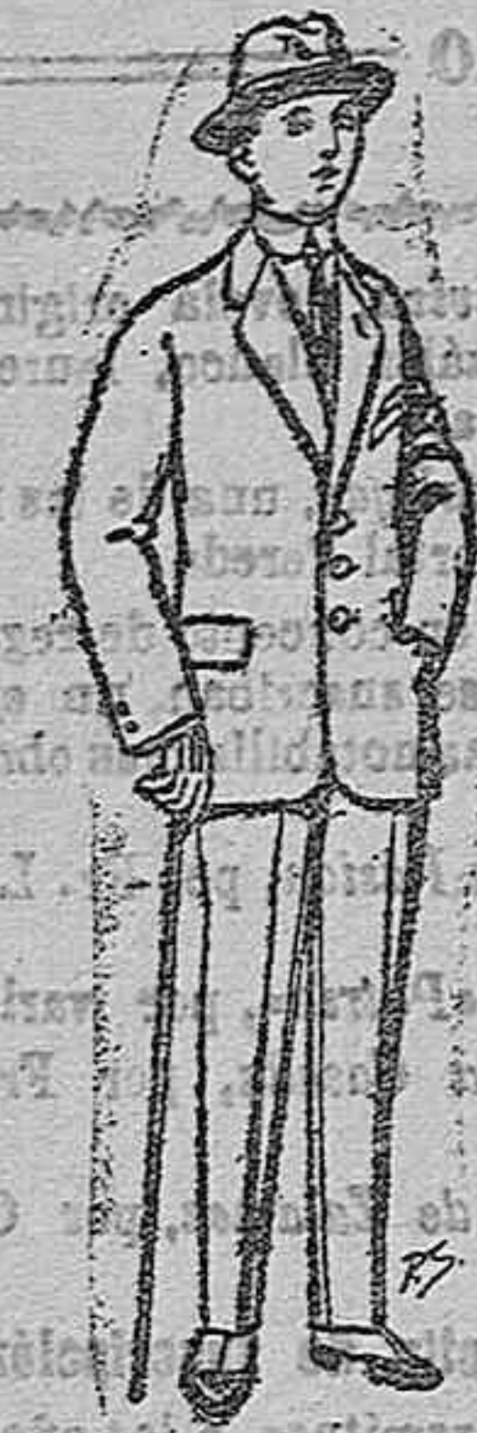
Trajes de patén vi- cuña o jerga para niños de 10 a 16 años De ptas. 13 a 48