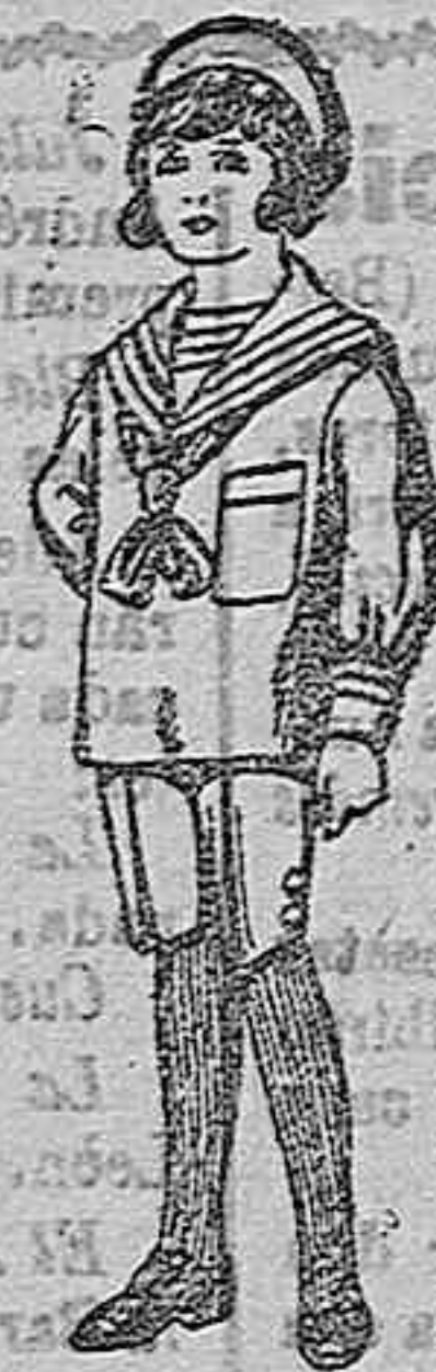
Traje de jerga azul borbado oro en la manga para niños de 4 a 9 años De ptas. 20 a 22