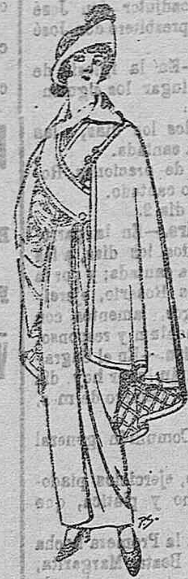
Gabanes de patén y de cheviot De ptas. 55 a 105