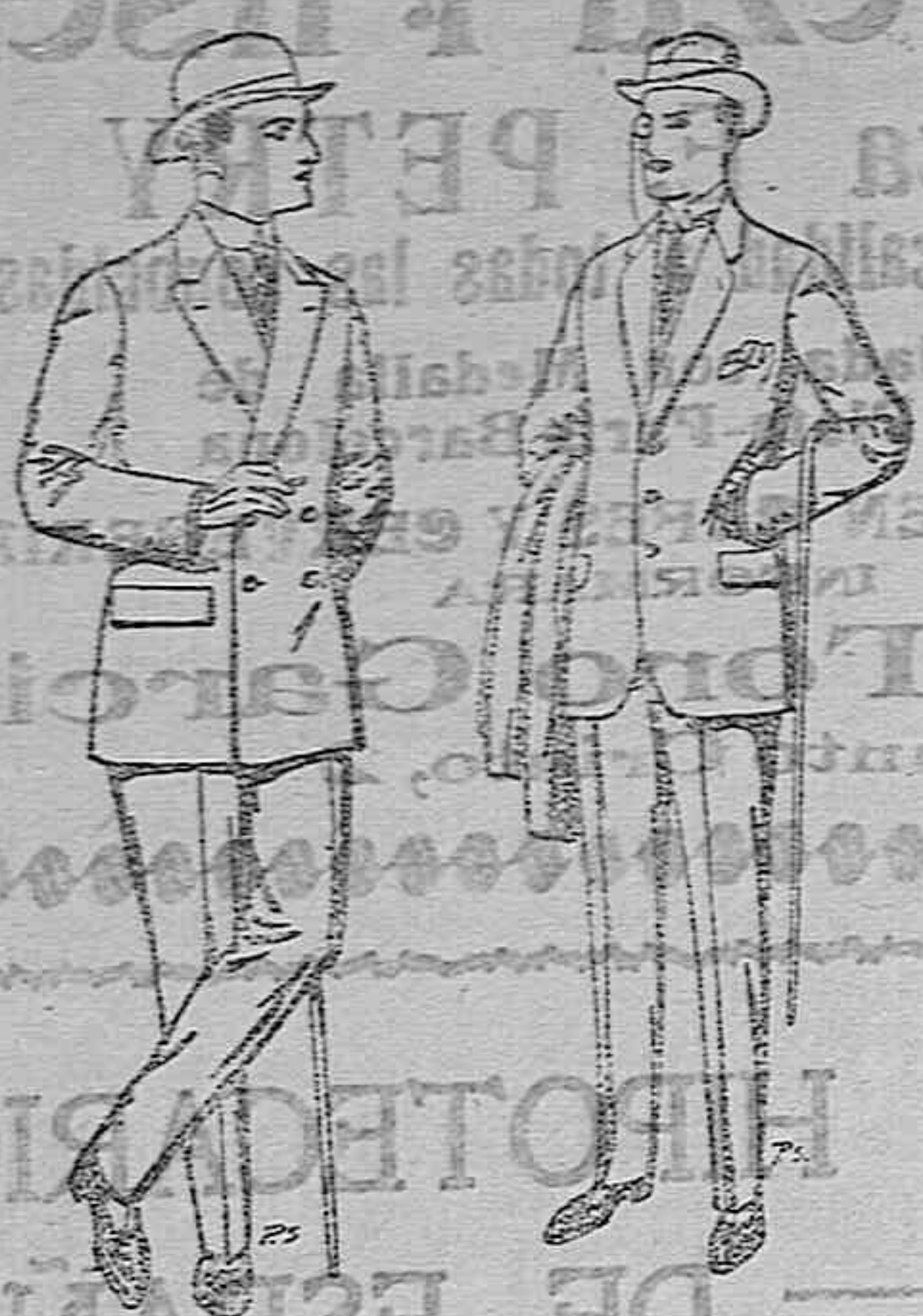
Trajes de cheviot, pa- tén, etc. De ptas. 25 a 80

Gran exposición de artículos de la temporada