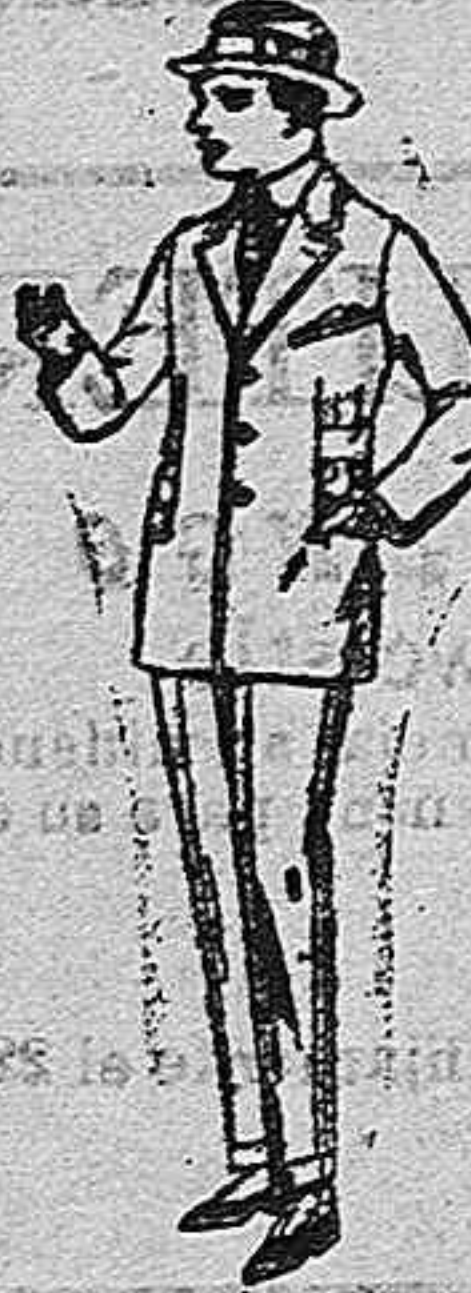
Trajes pteña, viena o jerga, forma sport, para niños y jovencitos de 10 a 16 años de ptas. 30 a 85.