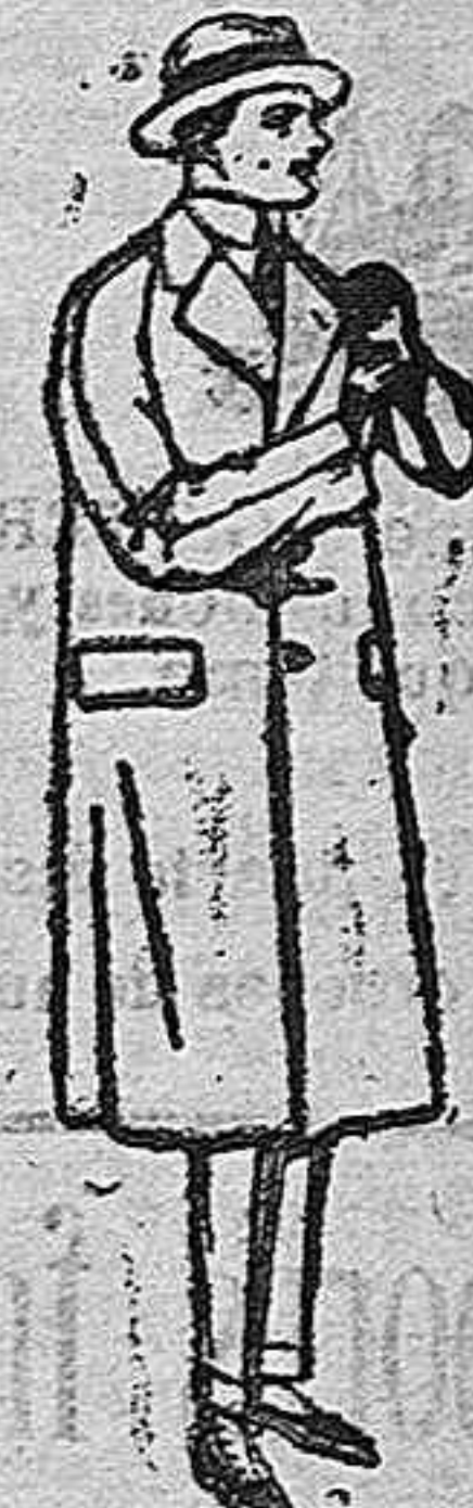
Gabanes raglán de patón melton o cheviot, con fieltro seda o satén de ptas. 60 a 160.