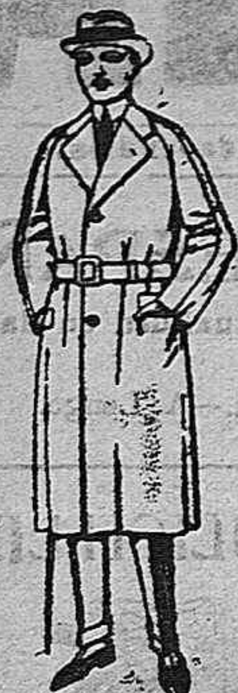
Gabanes raglán de patón, gamuza o esmeralda de ptas. 50 a 100.

SUCURSALES: Madrid, Barcelona, Alicante, Bilbao, Cádiz, Cartagena, Gijón, Granada, Málaga, Palma de Mayorca, Santander, Sevilla, Valencia, Valladolid, Zaragoza.