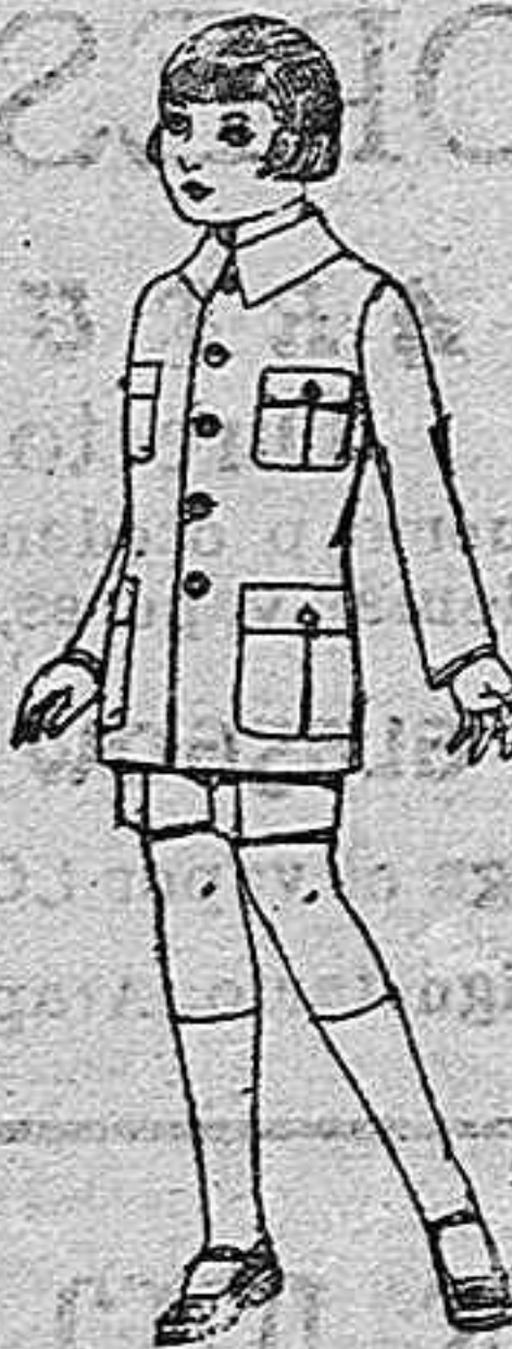
Trajes de patón modelo sport para niños de 4 a 9 años de ptas. 16 a 70.