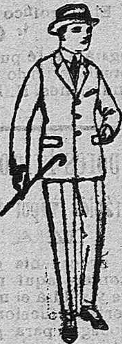
Trajes de patón, viena o jerga, para niños y jovencitos de 10 a 16 años de ptas. 20 a 35.