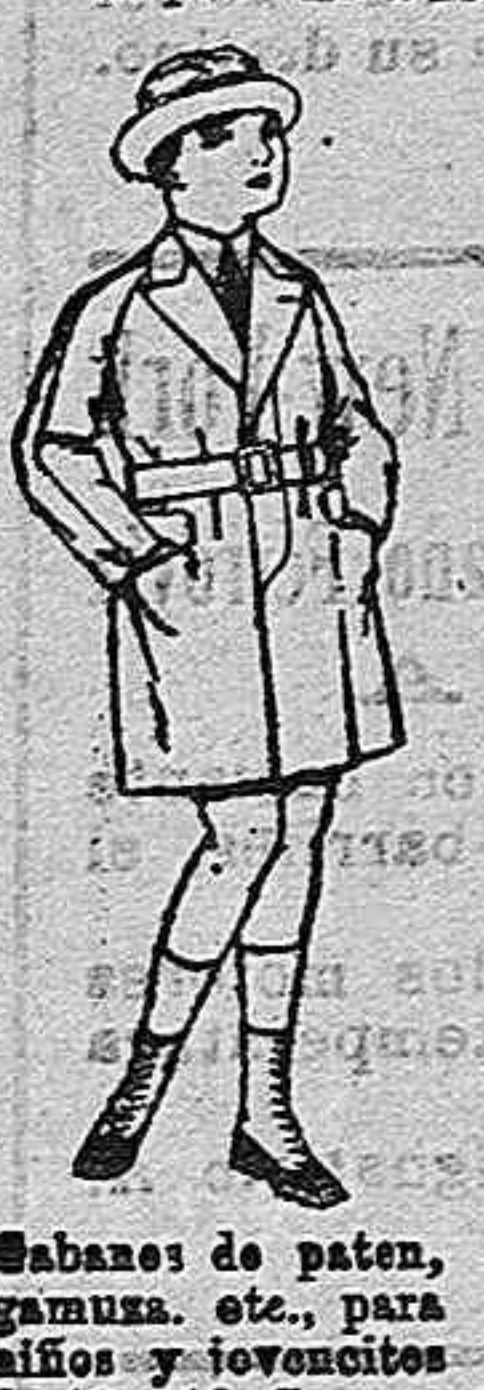
Gabanes de patón, gamuza, etc., para niños y jovencitos de 10 a 16 años de pesetas 25 a 85.