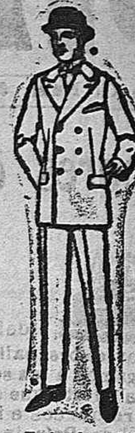
Trajes de melton cheviot, estambre, viena o jerga de ptas. 36 a 60.