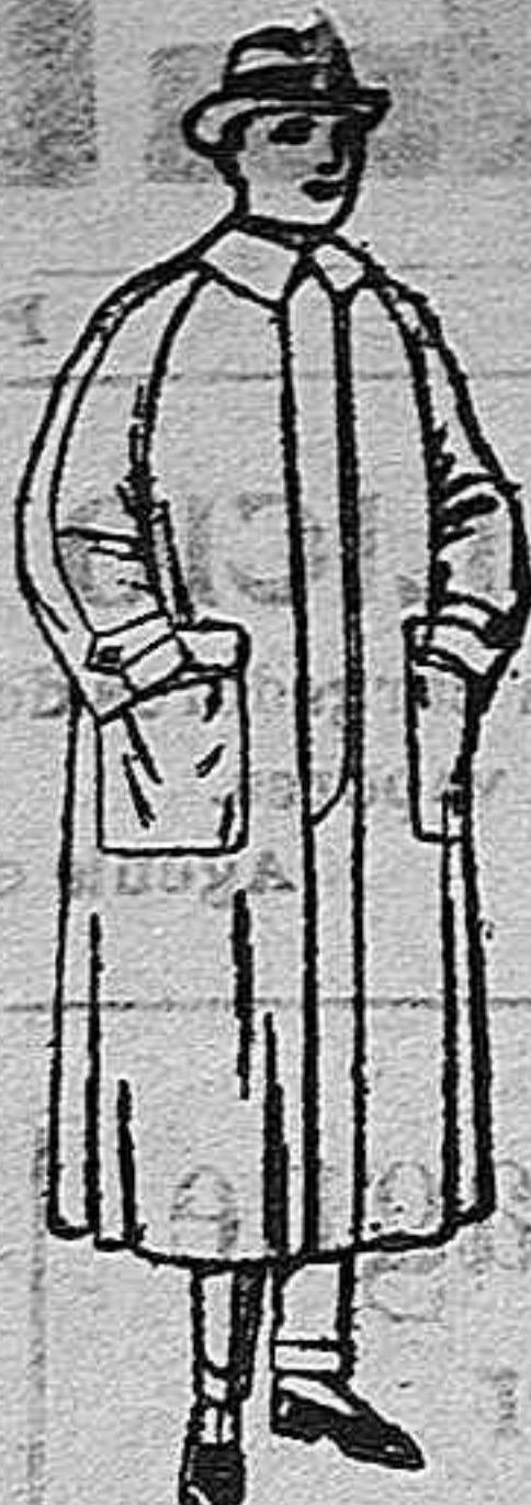
Impermeables raglán en azul y colores de ptas. 20 a 100.