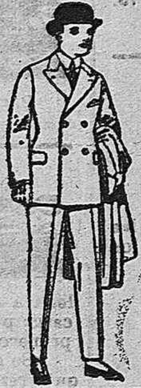
Trajes de patón, viena, etc., para niños y jovencitos de 10 a 16 años de pesetas 32 a 85.