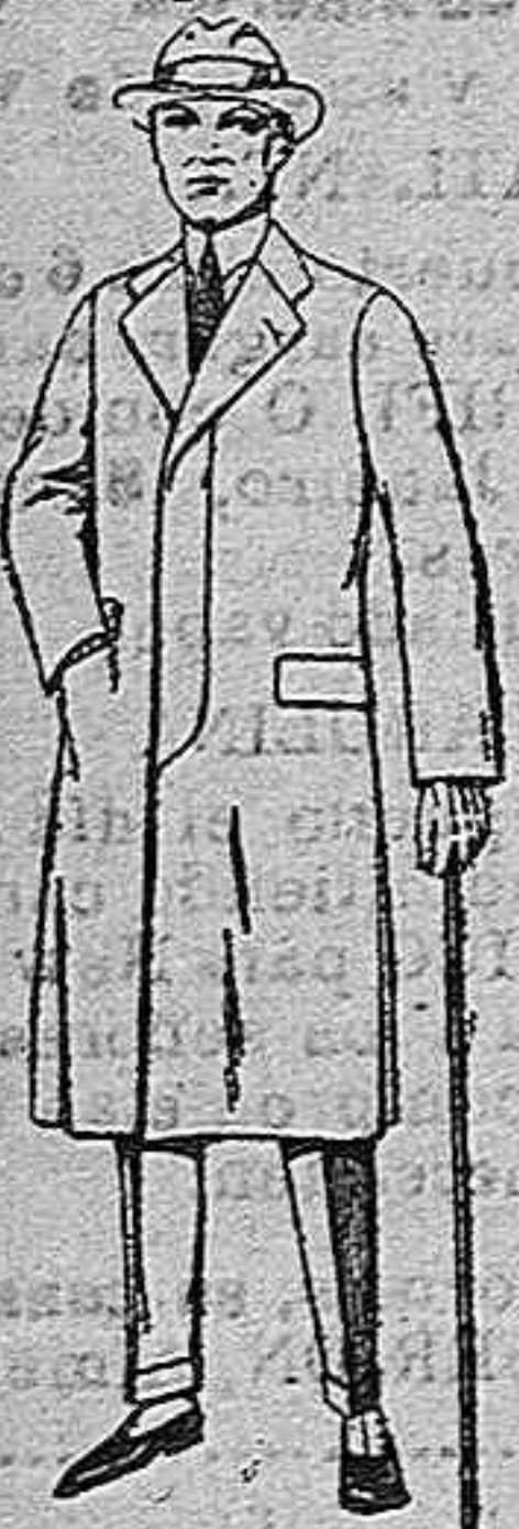
Gabanes de cheviot, gamuza o patón, etc. de ptas. 45 a 140.