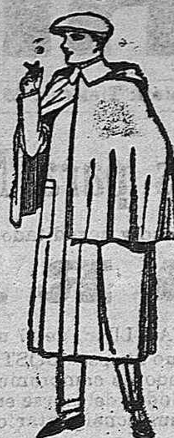
Impermeables macferland en negro y azul de ptas. 85 a 175.