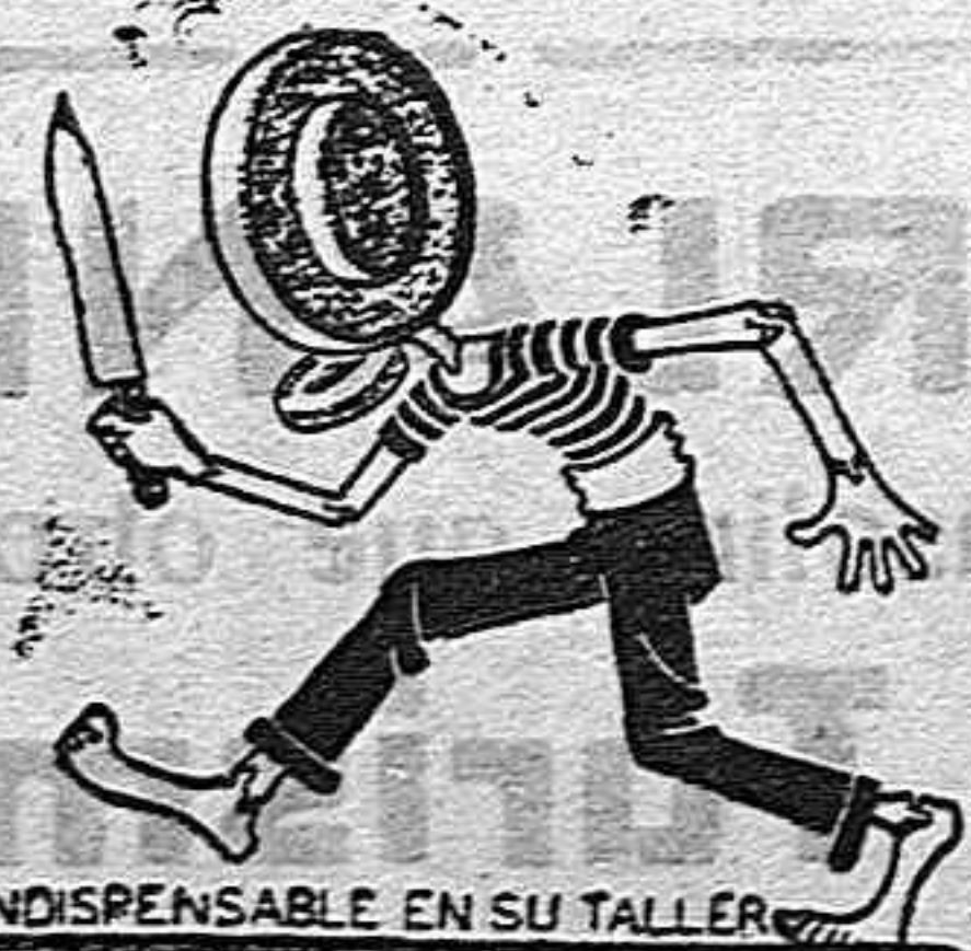
INDISPENSABLE EN SU TALLER

Depositario exclusivo de la gran Fábrica de piedras de afilar y demás aplicaciones marca ONENA, de Santander