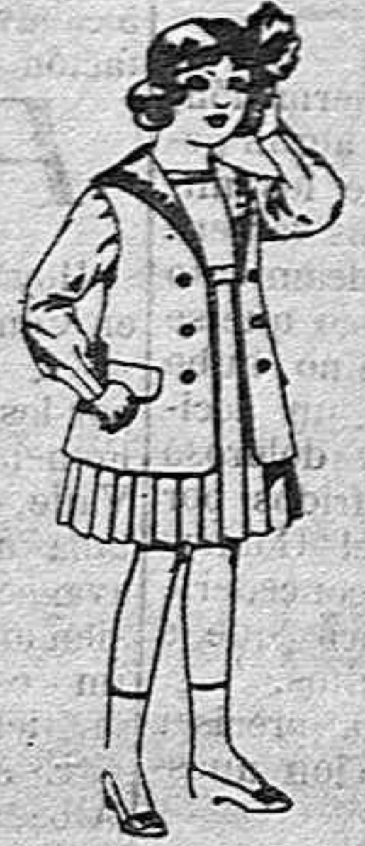
Traje de g bardina blanco, cuello de orandín bordado, para niñas de 4 a 9 años. de pesetas 22 r 24.