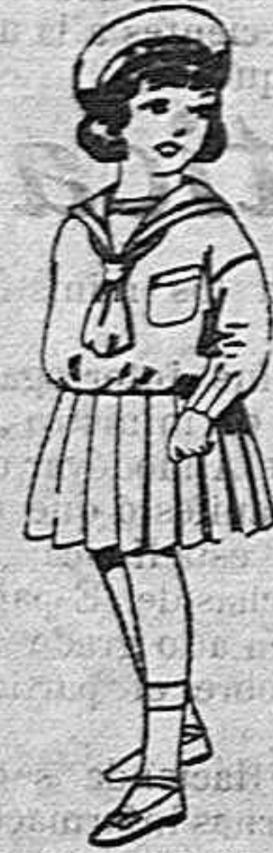
Trajes de marinera de lanilla azul para niñas de 4 a 9 años de pesetas 32 a 38 los mismos de dril blanco de 13 a 24 pesetas.