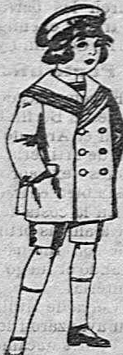
Trajes matelot de vicuña o jergal azul para niño de 4 a 9 años de 14 pesetas a 32.