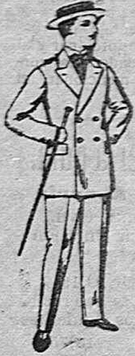
Traje de estambre, vicuña o jerga, para jovencito de 10 a 17 años. de ptas 19 50.