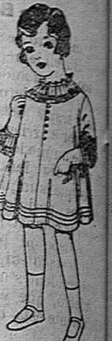
Vestidos de lana blanca bordada de ptas. 6 75 a 8.

Géneros del país y extranjeros para la Sección de Medida. Sombreros de paja de 2'50 a 12 pesetas.