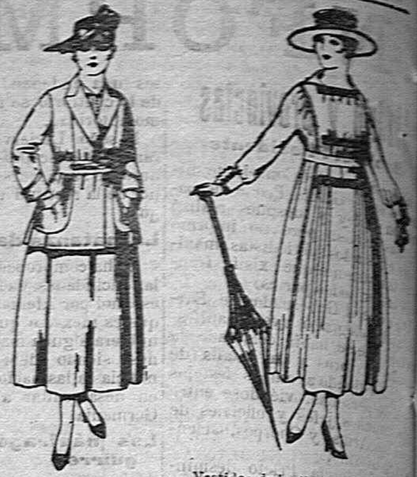
Traje de estambre negro, azul y color. de ptas. 70 a 70. Vestidos de lanilla negros, azules, colores de ptas. 60 a 70.

Camisería, Géneros de punto, Corbatería, Guantería Sombrereria, Zapatería, Paraguas, Bastones y Artículos de viaje.