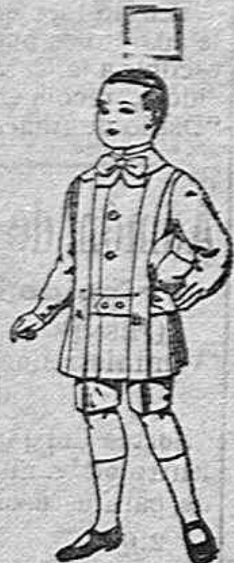
Trajes de lanilla para niños de 4 a 9 años. de ptas. 12 a 31