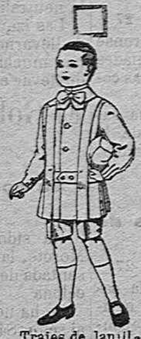
Trajes de lanilla para niños de 4 a 9 años. de ptas. 12 a 31