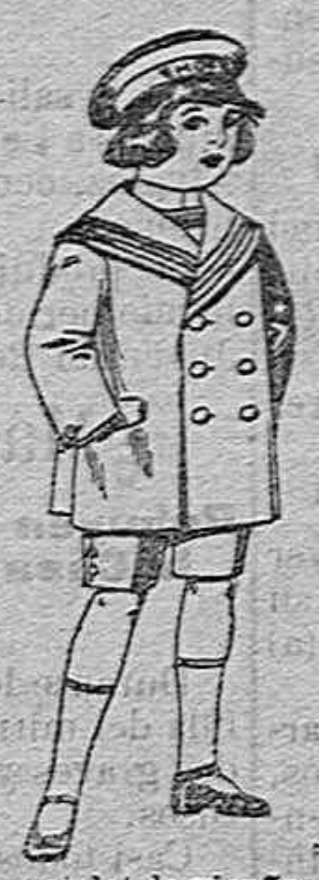
Trajes matelot de vicuña o jergal azul para niño de 4 a 9 años de 14 pesetas a 32.