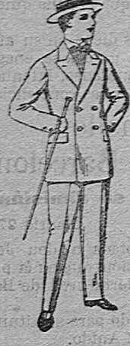
Traje de estambre, vicuña o ja-s para jovencito de 10 a 17 años. de ptas 19 50.