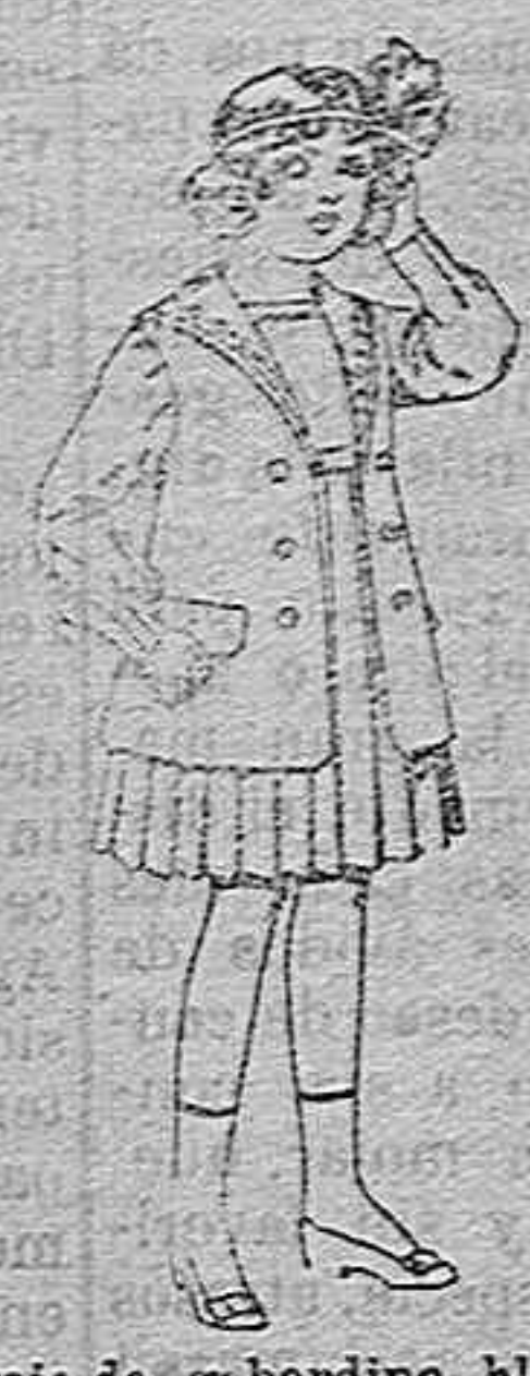
Traje de gabardina blanco, cuello de orhandin bordado, para niñas de 4 a 9 años. de pesetas 22 r 24.