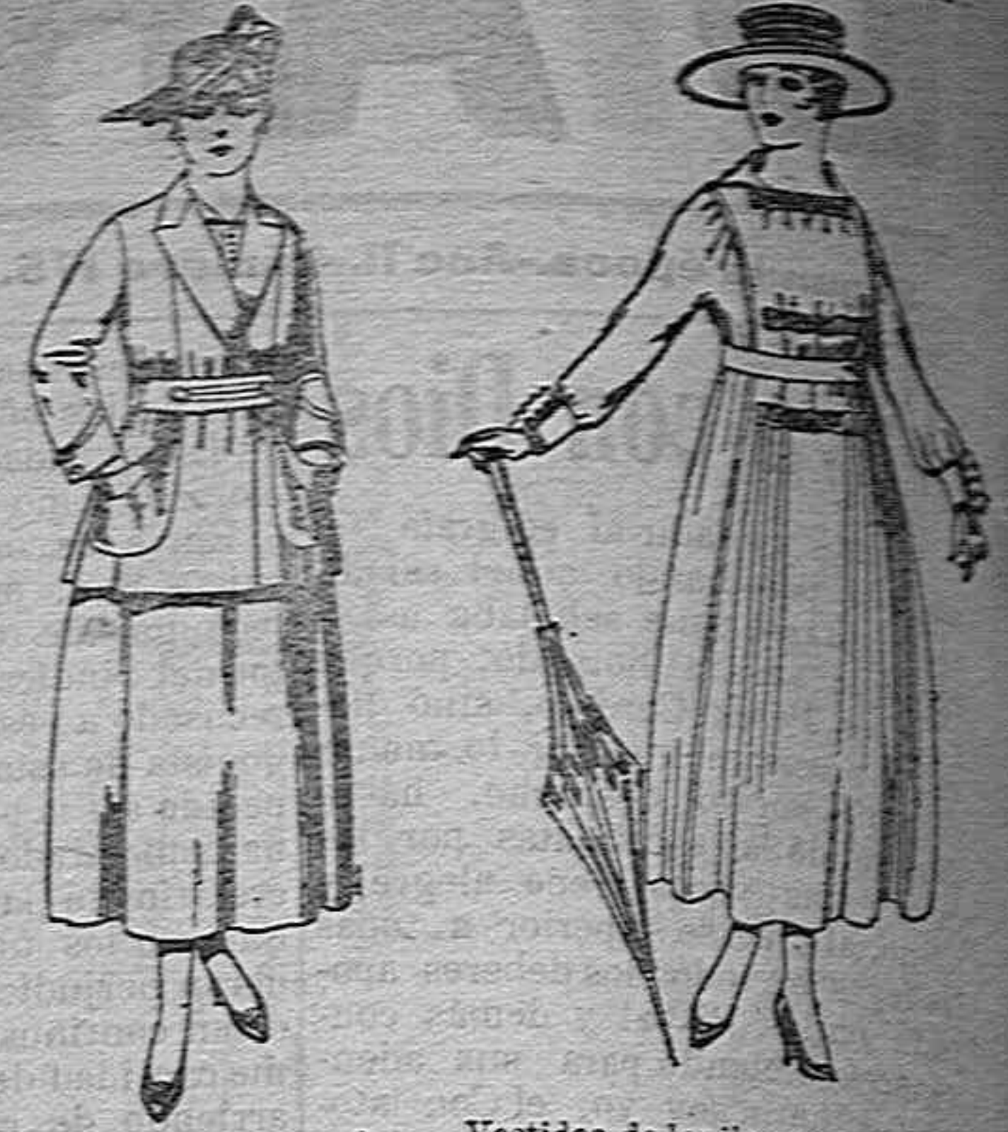
Traje de estambre negro, azul y color de ptas. 70 a 70. Vestidos de lanilla negros, azules, colores de ptas. 60 a 70.