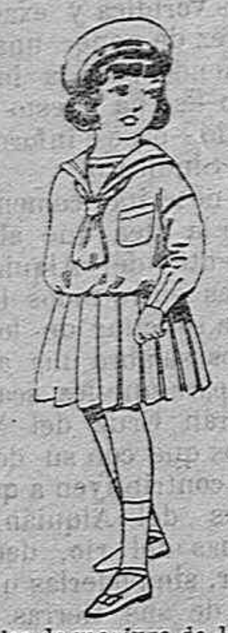
Trajes de marinera de lanilla azul para niñas de 4 a 9 años de pesetas 32 a 38 los mismos de dril blanco de 13 a 24 pesetas.