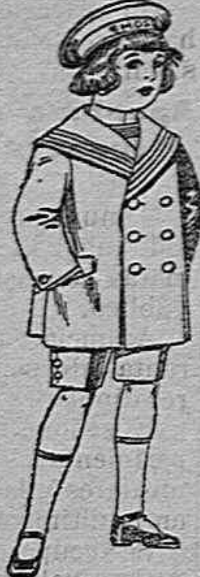
Trajes matelot de vicuña jergal azul para niño de 4 a 9 años de 14 pesetas a 32.