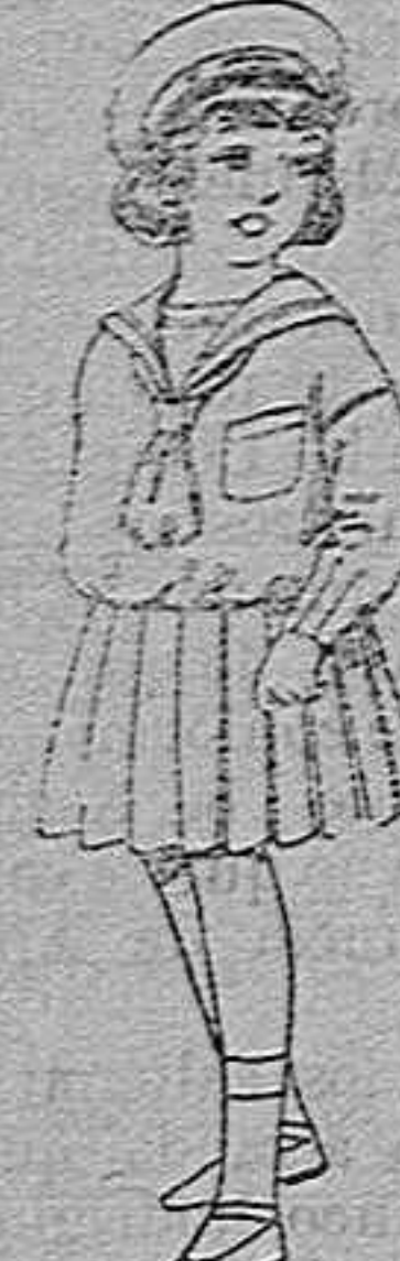
Trajes de marinera de lanilla azul para niñas de 4 a 9 años de pesetas 32 a 38...