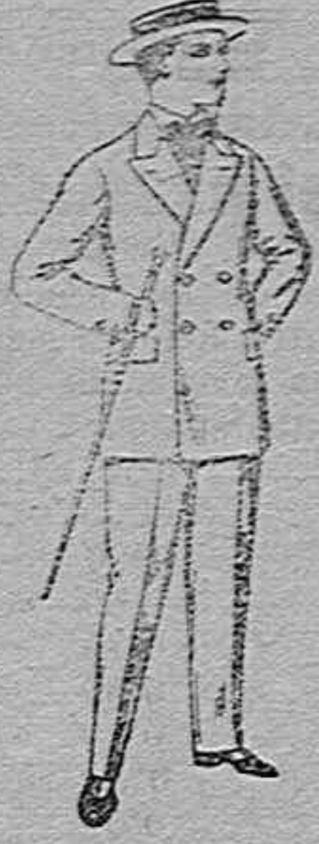
Traje de estambre, vicuña o jerga, para jovencitos de 10 a 17 años.