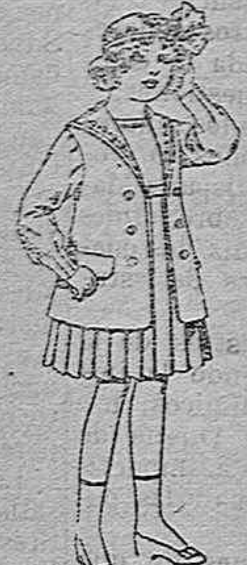
Traje de gabardina blanco, cuello de orlandín bordado, para niñas de 4 a 9 años.