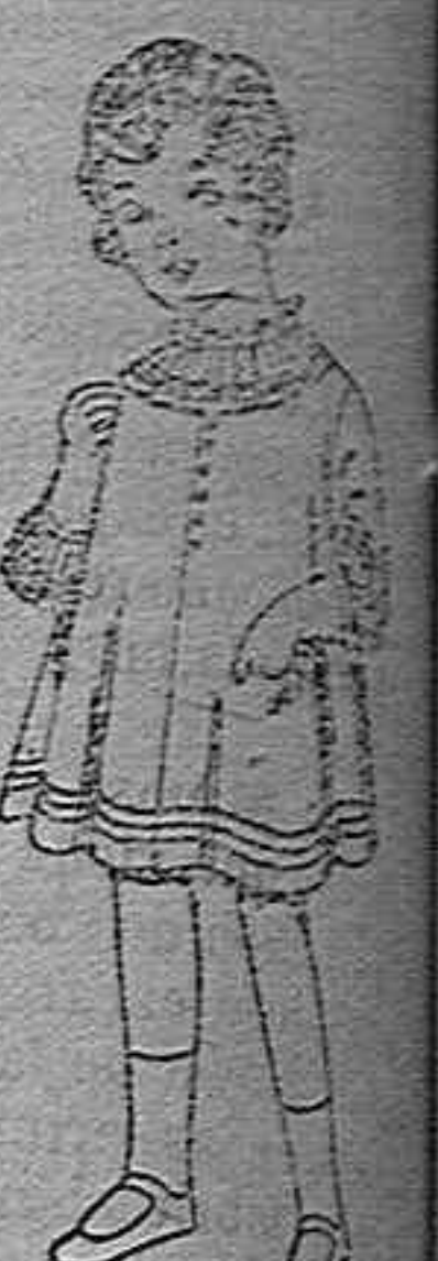
Vestidos de vellón blanco bordado de ptas. 60 a 70.

Géneros del país y extranjeros para la Sección de Medida. Sombreros de paja de 2'50 a 12 pesetas.