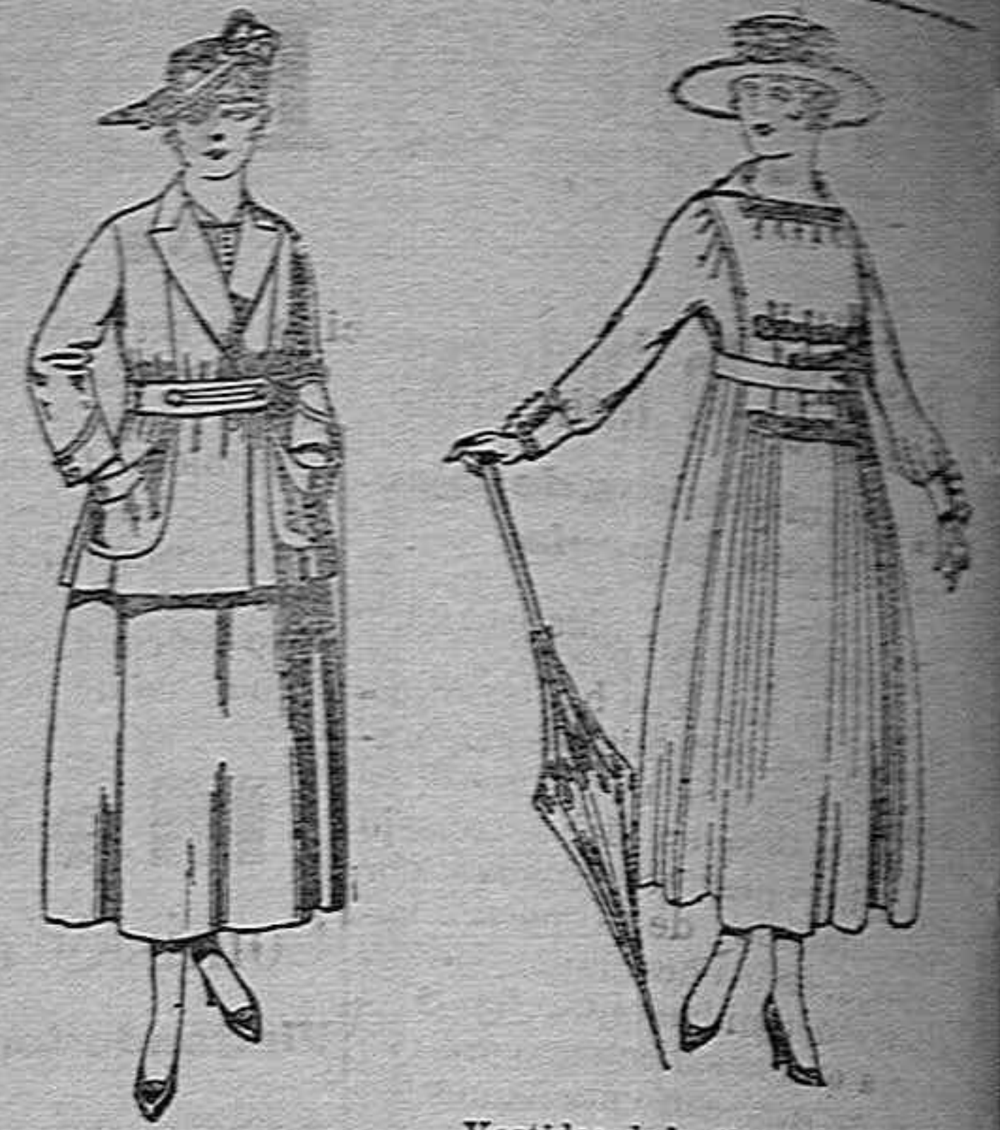
Traje de estambre negro, azul y color de ptas. 70 a 70. Vestidos de lanilla negra, azules, colores de ptas. 60 a 70.

Camisería, Géneros de punto, Corbatería, Guantería Sombrereria, Zapatería, Paraguas, Bastones y Artículos de viaje.