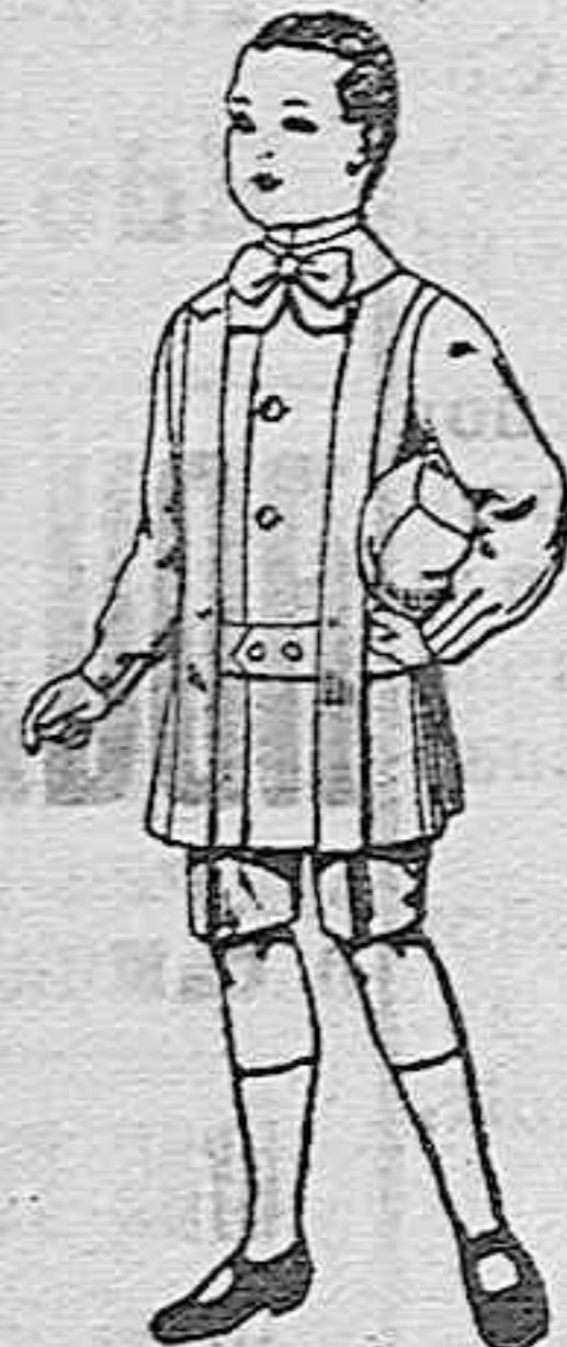
Trajes de lanilla para niños de 4 a 9 años de ptas. 12 a 31.