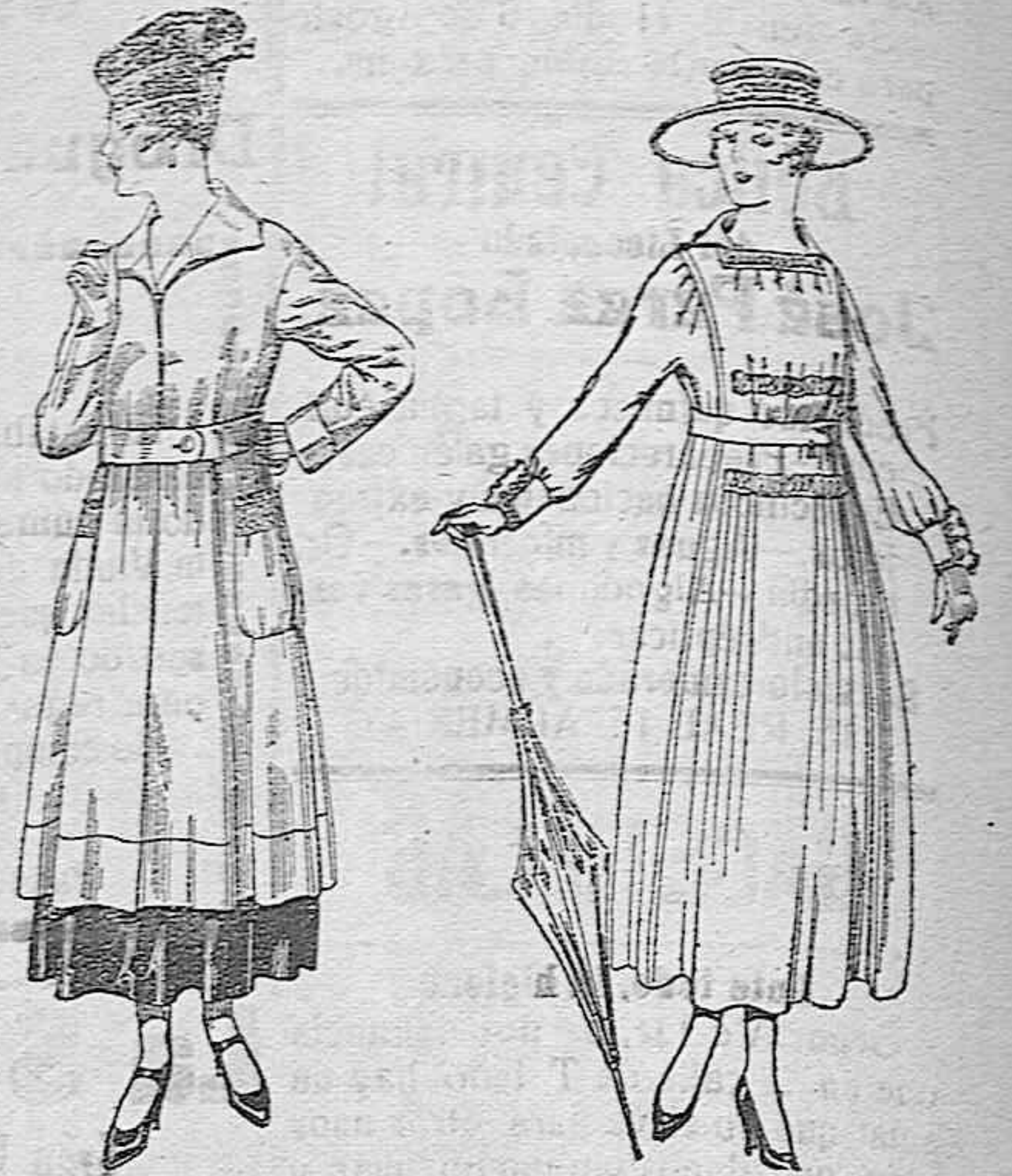
Abrigos de tricot de lana, en colores lisos, de pesetas 63 a 75.