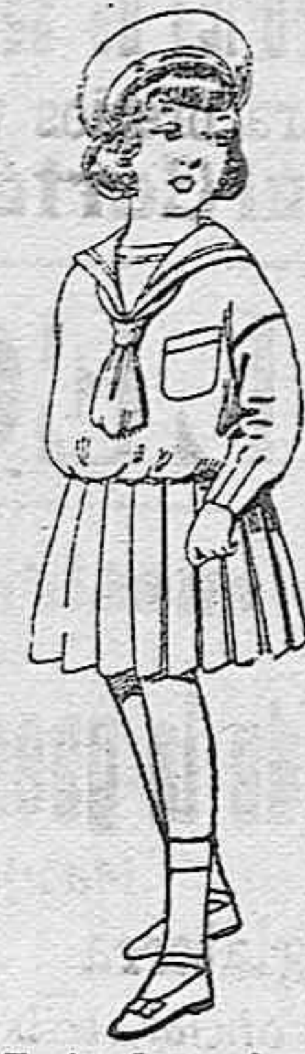
Trajes de marinera de lanilla azul para niñas de 4 a 9 años de ptas. 32 a 38. Los mismos de dril blanco de 13 a 24 ptas.