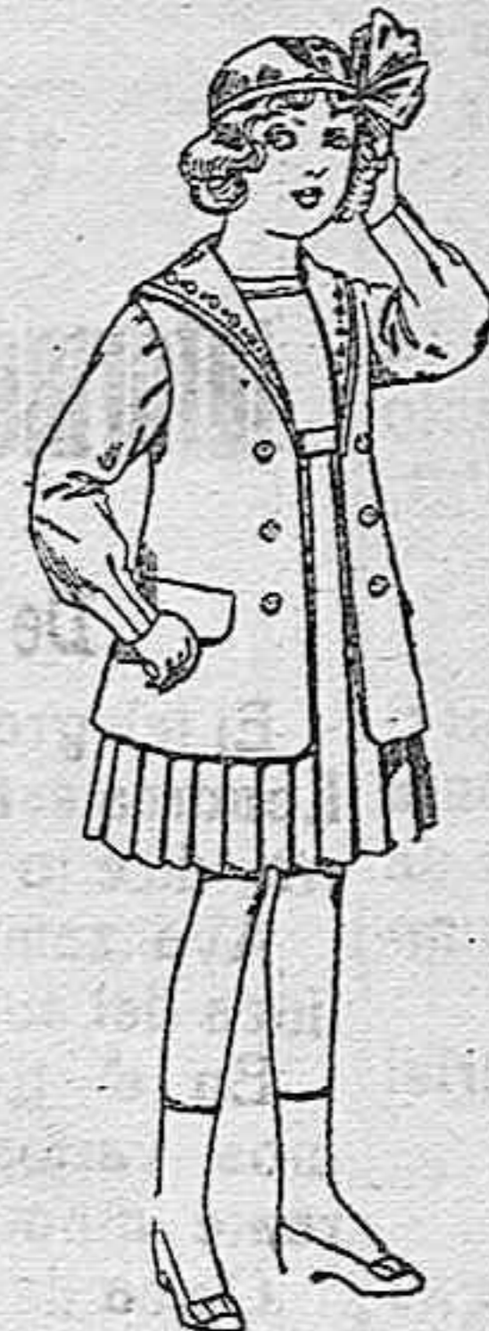
Trajes de gabardina blanco, cuello de organidín bordado, para niñas de 4 a 9 años, de ptas. 22 a 24