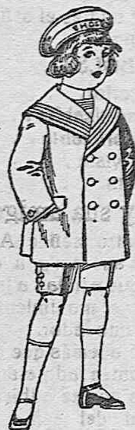
Trajes matot de vicuña o jergal azul para niño de 4 a 9 años de ptas. 14 a 32