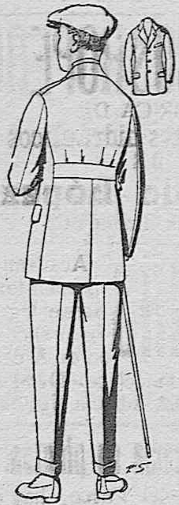
Trajes modelo sport, de lanilla, mellón, etc., para jovencitos de 10 a 15 años, de ptas. 27 a 52. Los mismos en dril de ptas. 11 a 21.