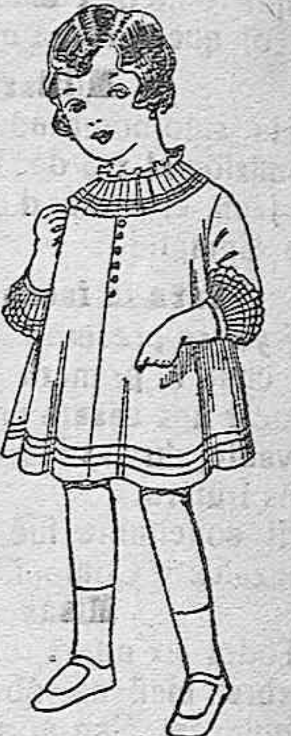
Vestidos de seda blanco bordados de pesetas 6'75 a 8.