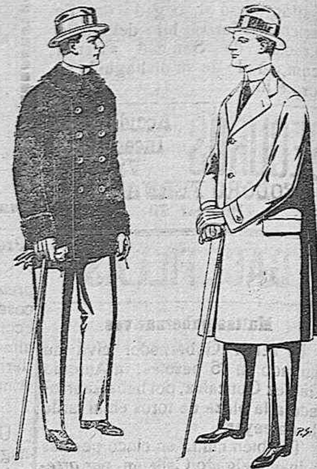
Pellizas de ratina con cuello del mismo género y con astrakan, de pesetas 16 a 90