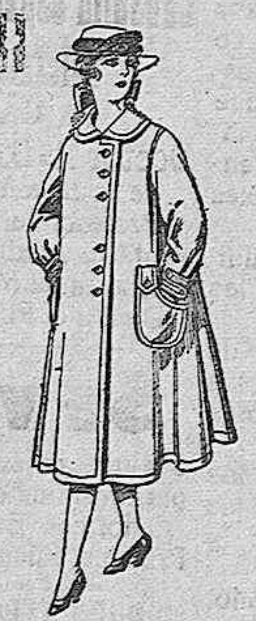
Abrigos de lana para jovencitas de 11 a 15 años, de ptas. 35 a 40