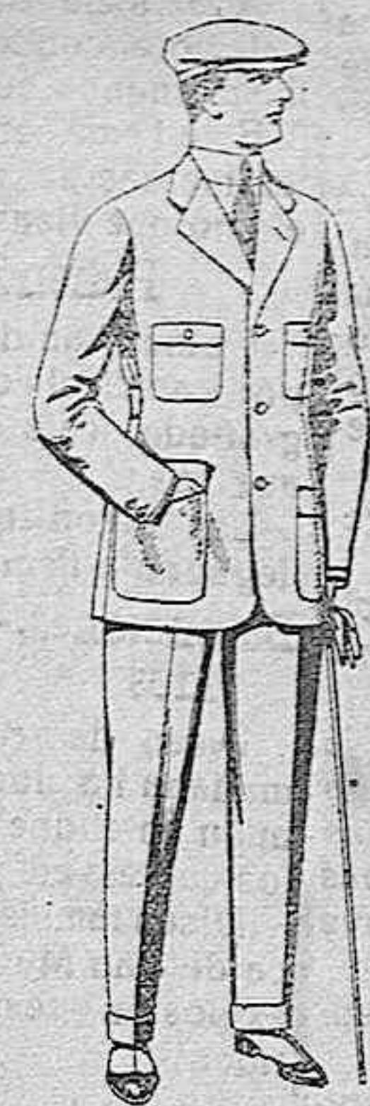
Trajes de cheviot, corte elegante, para sporman, de pesetas 45 a 55.