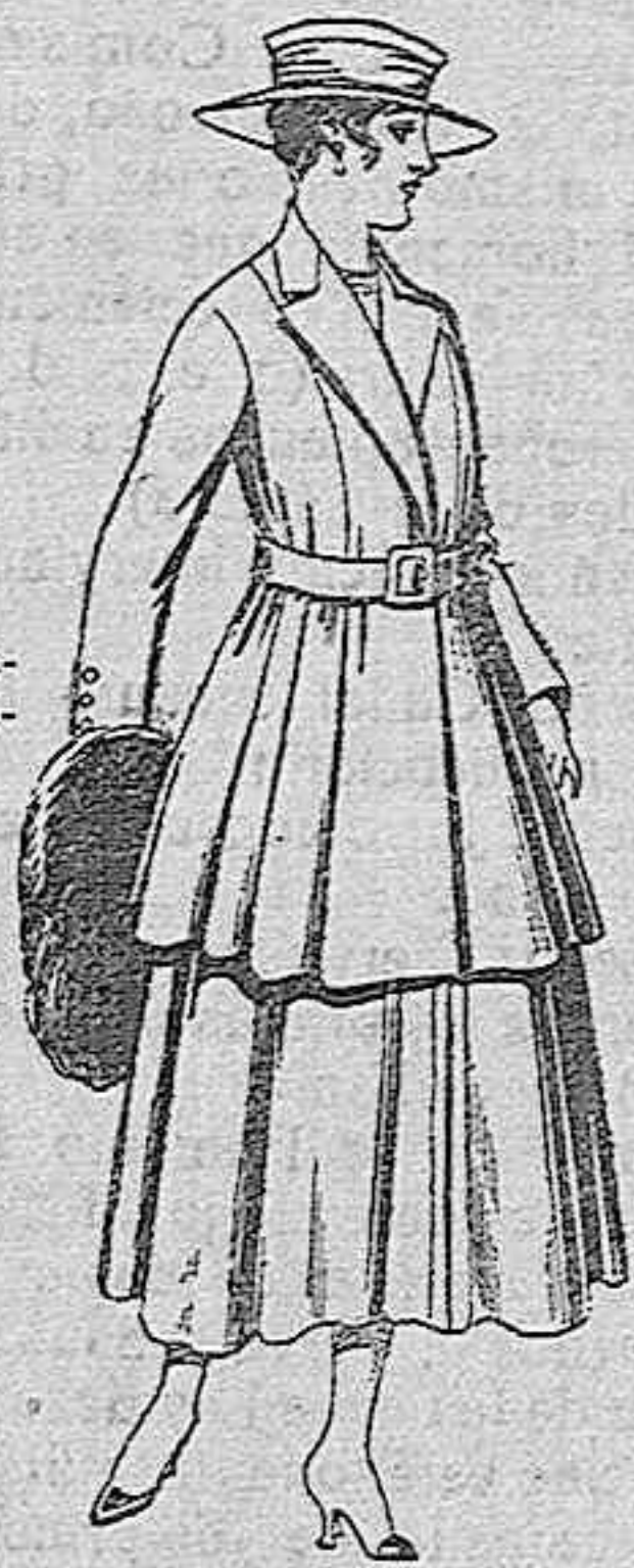
Traje de lana, para señora, en color negro y azul, de pesetas 85 a 100