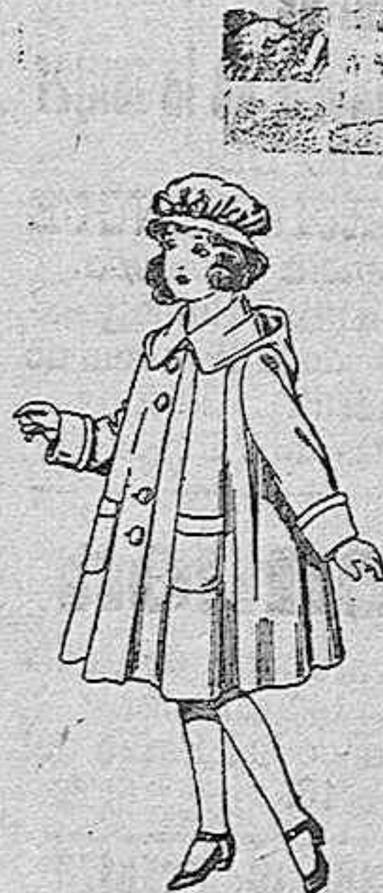
Abrigos de paten, para niñas de 4 a 9 años, de pesetas 22 a 33.