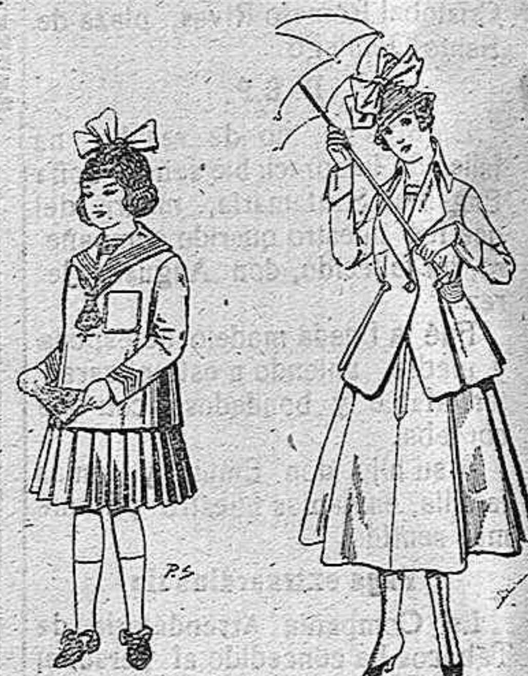
Trajes de lanilla para niñas de 4 a 12 años De pesetas 32 a 40 Trajes de lanilla para jovencitas de 13 a 16 años De pesetas 53 a 55