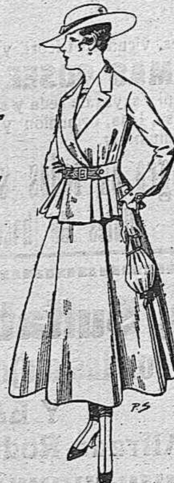
Trajes de lanilla para señora A pesetas 70