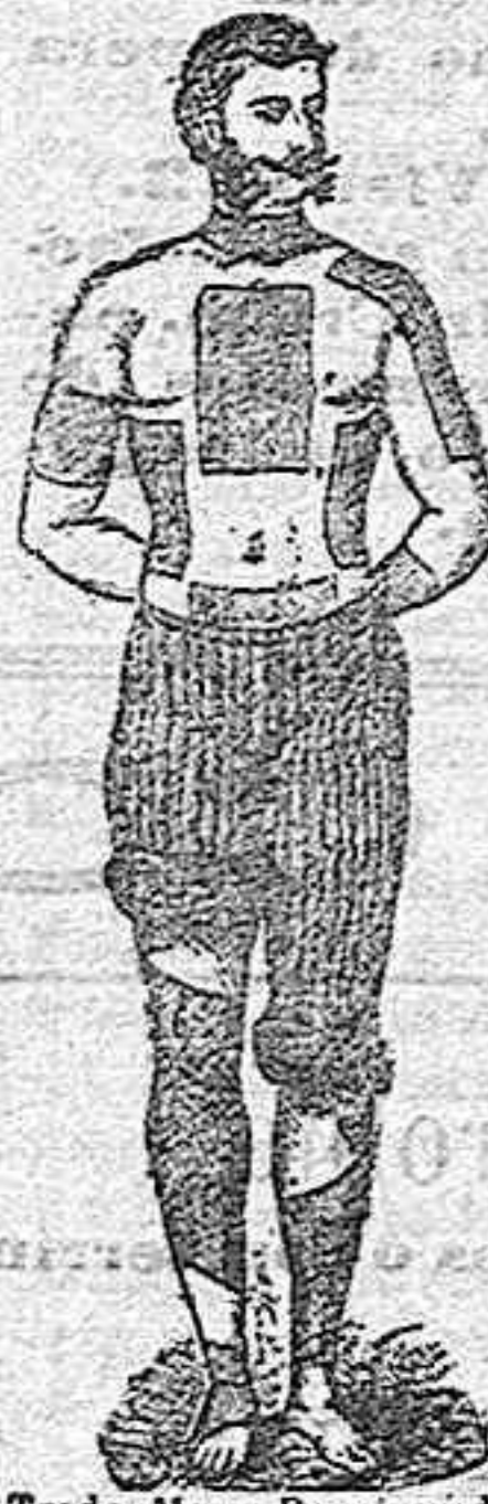
Trade Mark Registered.

PERFORADOS AMERICANOS DE FIELTRO ROJO DEL doctor Winter.