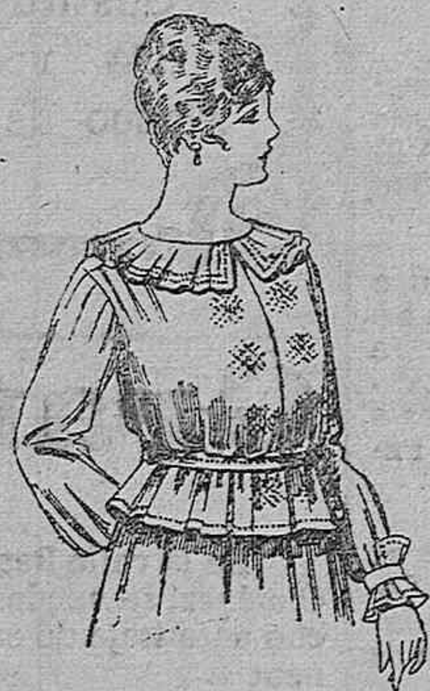
Blusa de crepón o negro, azul y color. A ptas. 33.