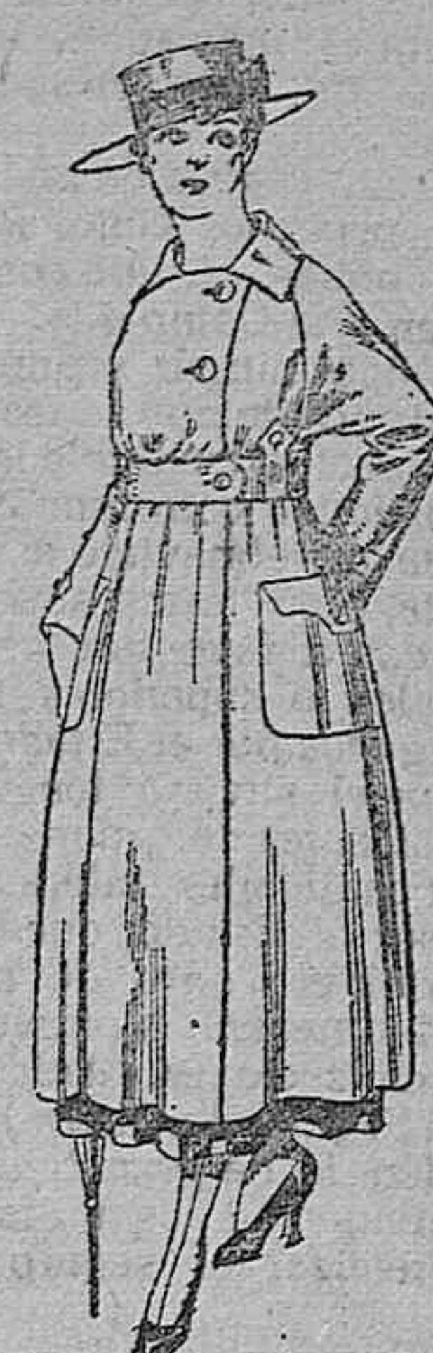
Vestido de estambre negro, azul y color, bordado. De pesetas 64 a 75.