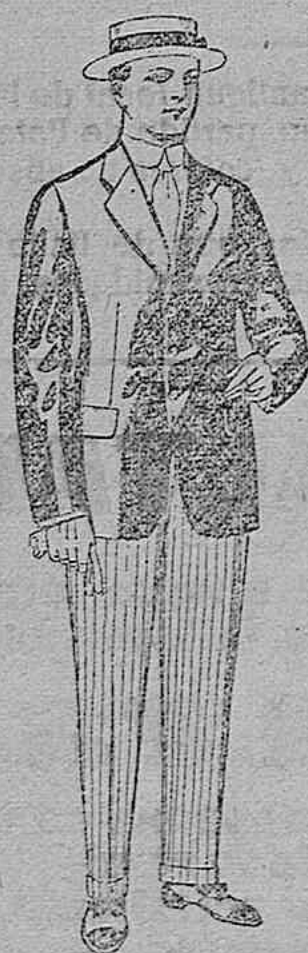
Trajes de lanilla, vicuña, etc., para jovencitos de 10 a 16 años. De ptas. 19 a 56.