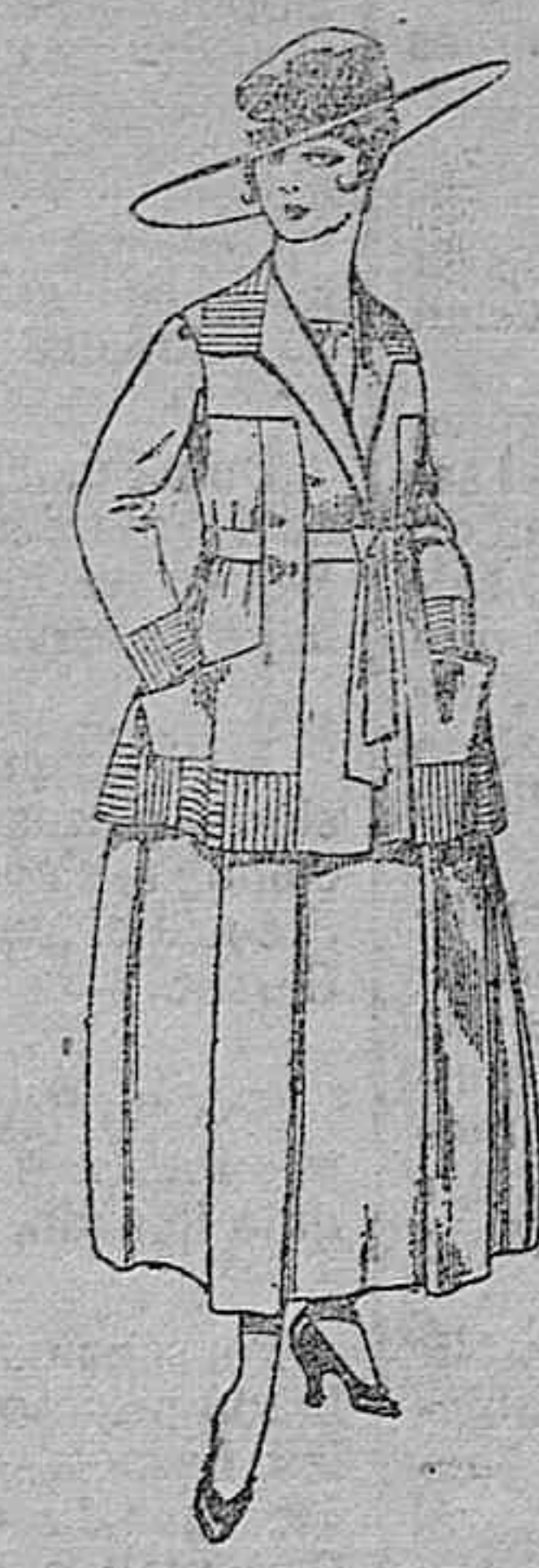
Traje de lanilla negro, azul y color, bordado, a pesetas 90