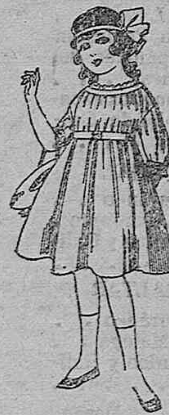
Vestidos de lanilla azul, para niñas de 4 a 9 años. Da ptas. 22 a 25. Lo mismos en voiles. De ptas. 10 a 17.

Servicio fijo, sin escalas, para pasaje y carga entre Barcelona, Almería y Melilla, por el vapor