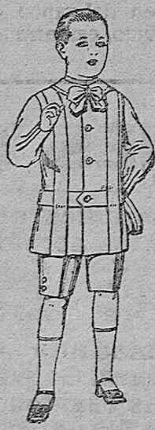
Trajes de lanilla, melton, etc., para niños de 4 a 9 años. De ptas. 16 a 33.