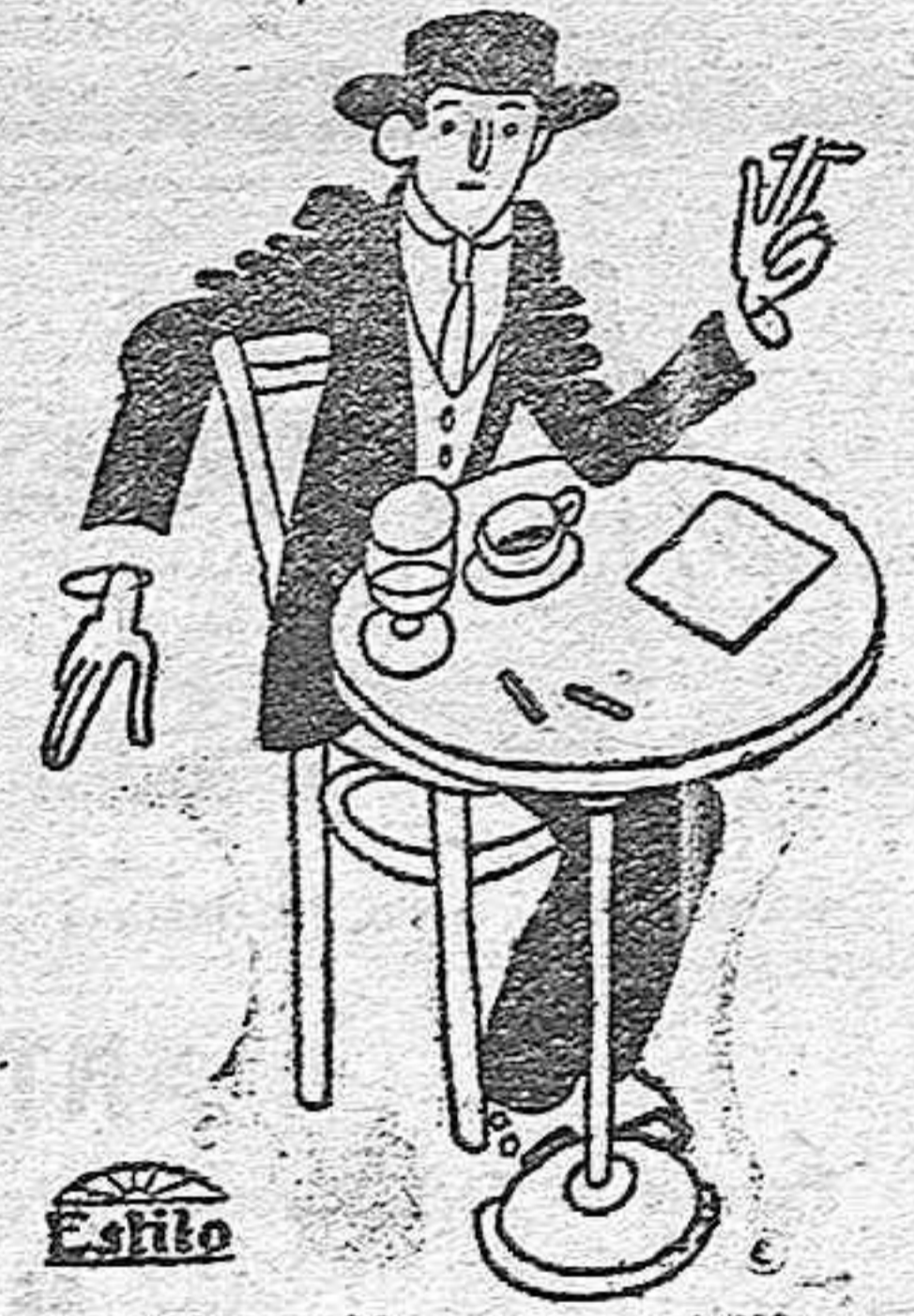
Un café y unos pitillos es la cosa más sabrosa si el café es de Costa Rica y el papel es INDIO ROSA.

El Consulado Americano establecido e incorporado en esta ciudad durante la presente guerra, estará abierto hasta el 28 de Noviembre inclusive—después de esta fecha todos los asuntos relacionados con esta oficina deberán ser dirigidos al Consulado Americano en Málaga.