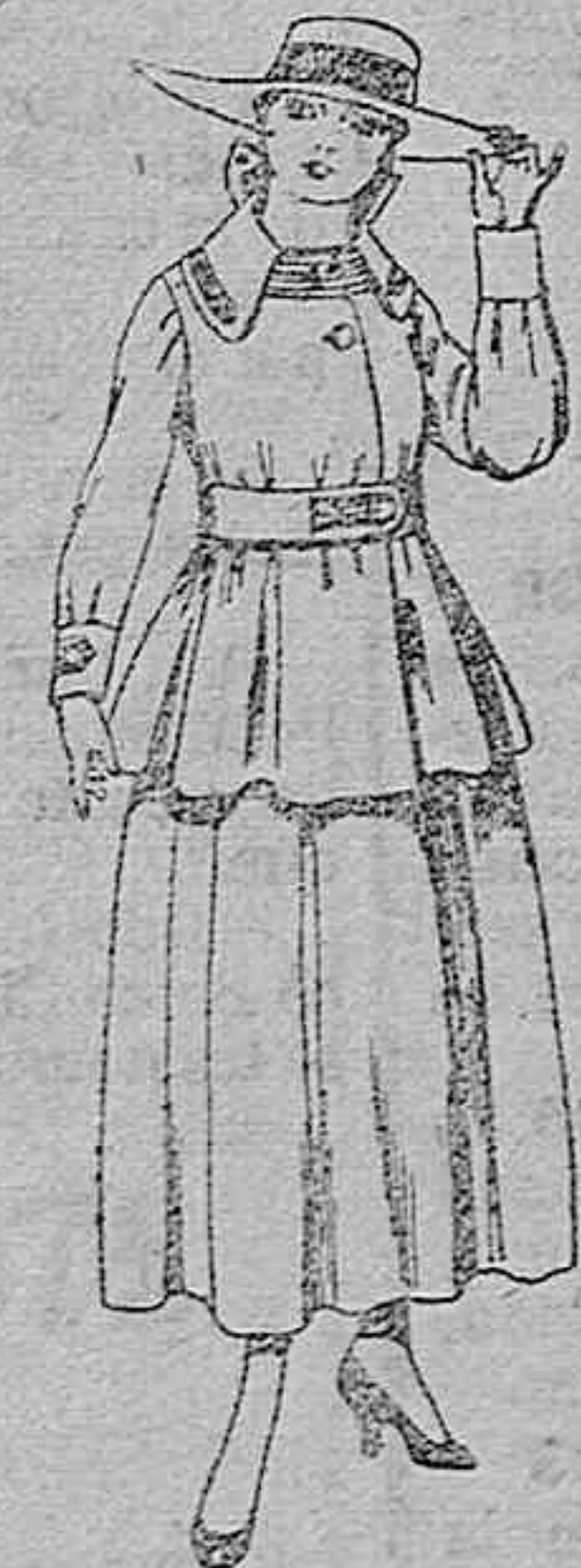
Trajes de lanilla negra, azul y color, para jovencitas de 13 a 18 años. De ptas. 50 a 85.