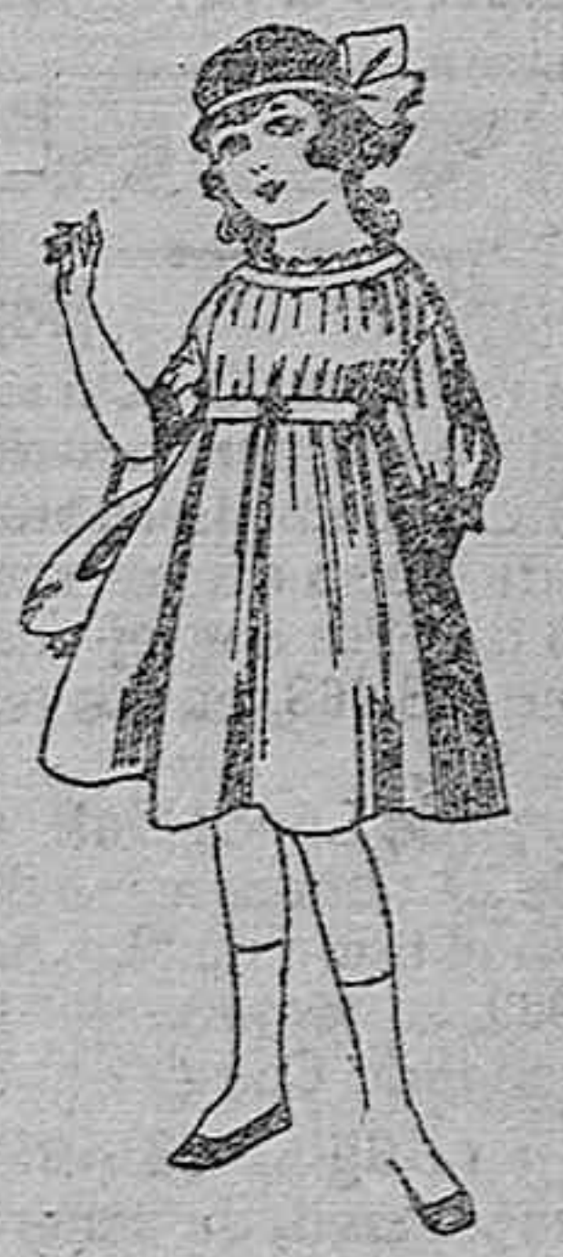
Vestidos de lanilla azul, para niñas de 4 a 9 años. De ptas. 22 a 25. Los mismos en voile. De ptas. 10 a 17.