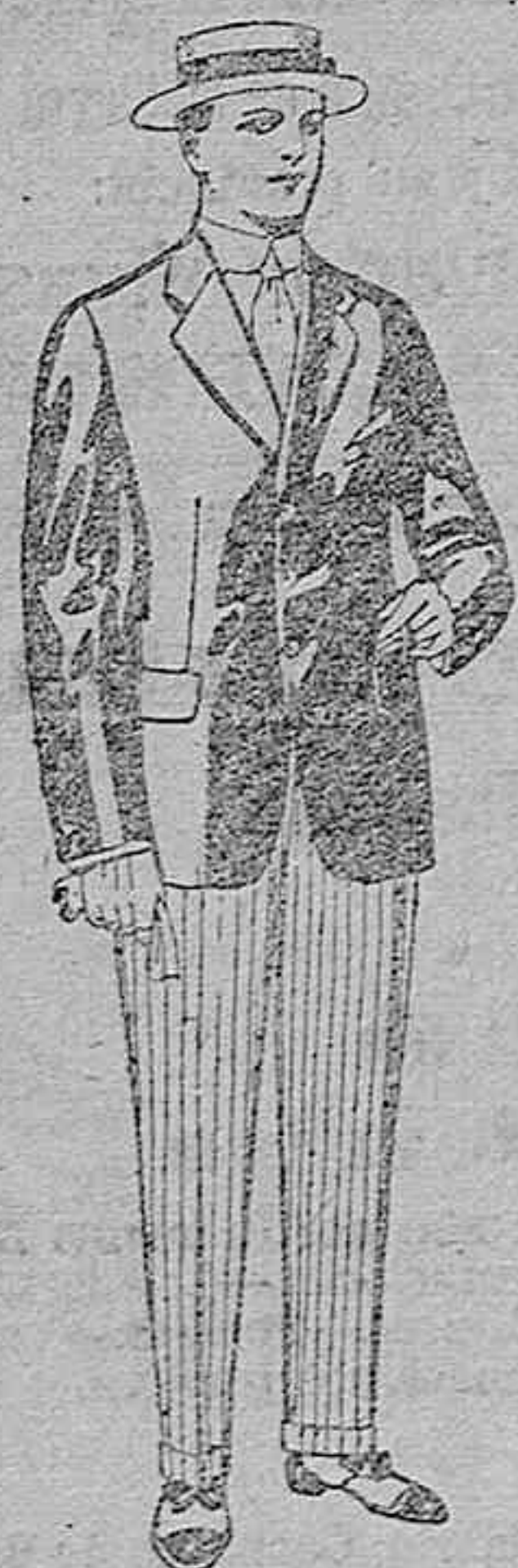
Trajes de lanilla, vicuña, etc., para jovencitos de 10 a 16 años. De ptas. 19 a 51.