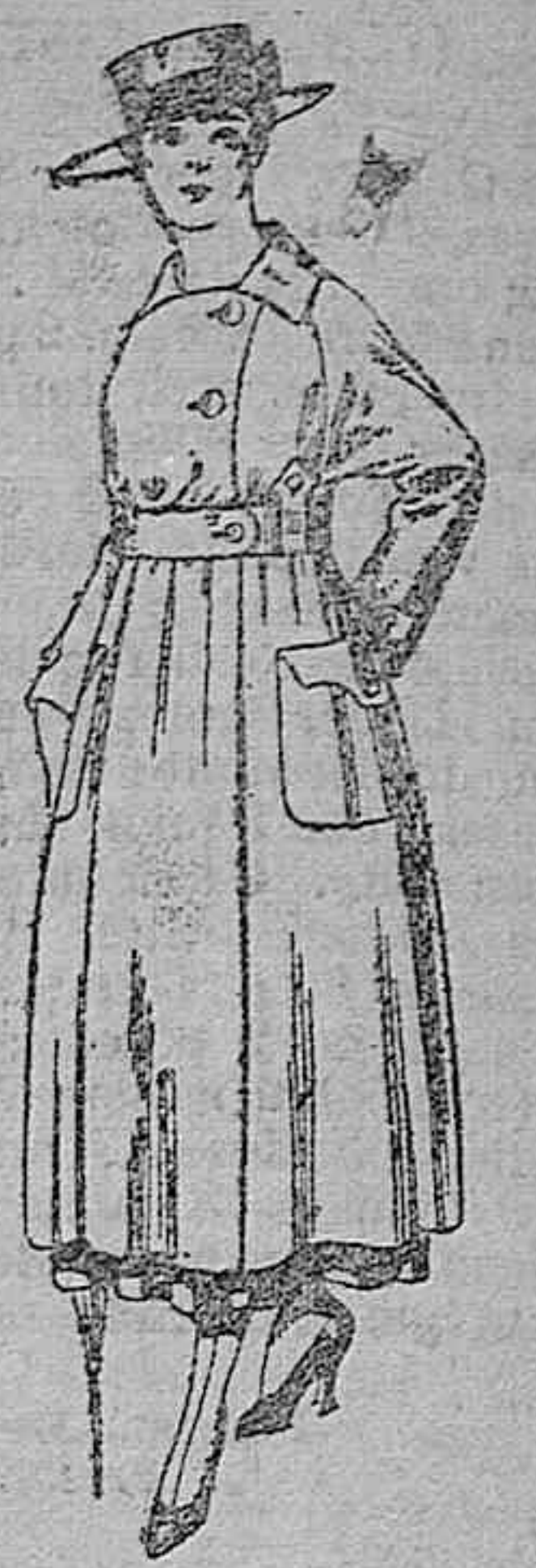
Vestido de estambre negro, azul y color, bordado. De pesetas 64 a 75.