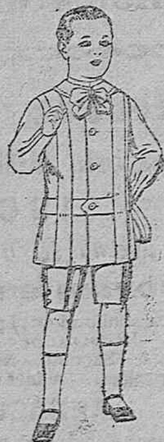
Trajes de lanilla, melton, etc., para niños de 4 a 9 años. De ptas. 16 a 33.