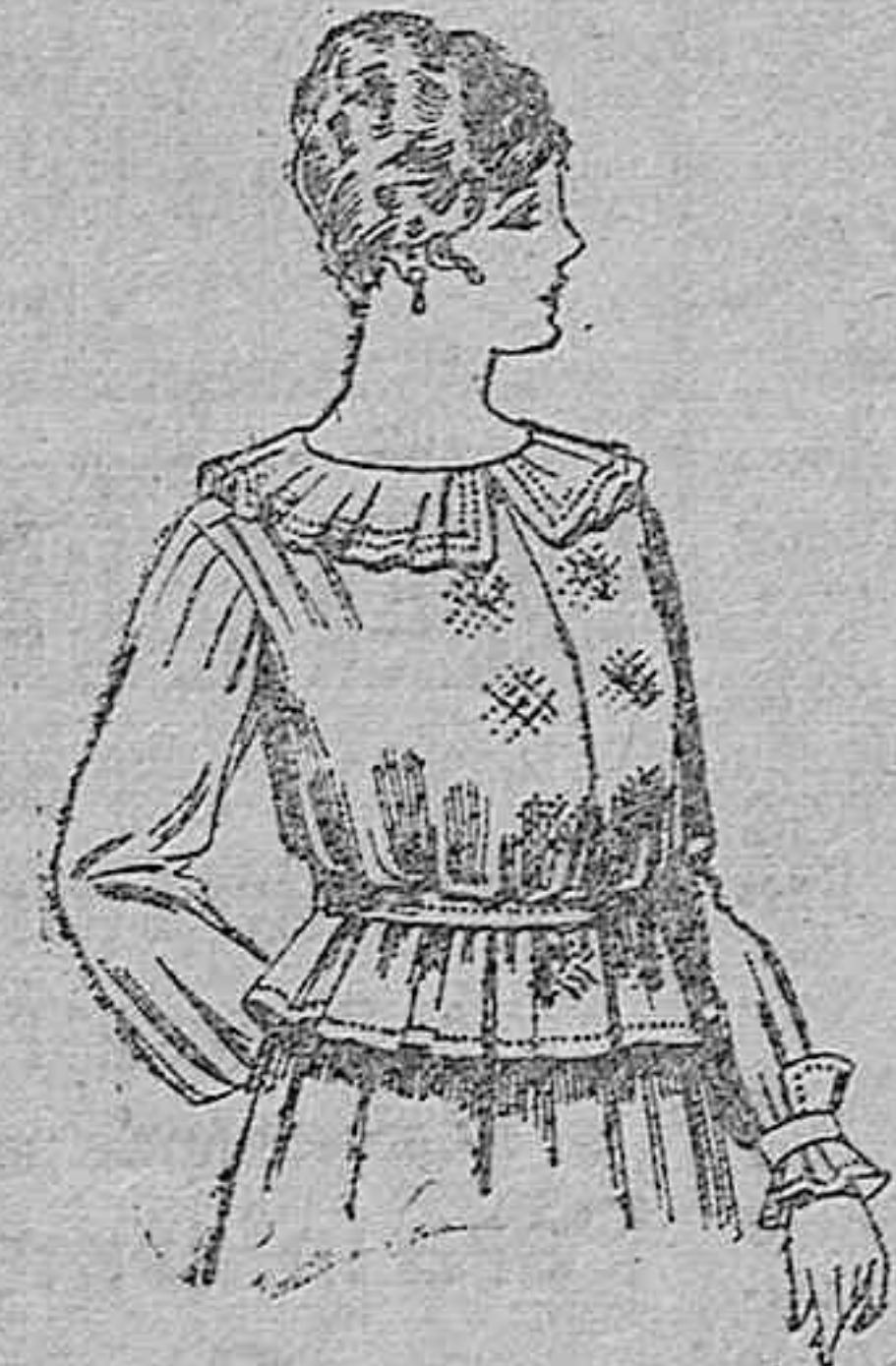
Blusa de crepón o negro, azul y color. A ptas. 32.