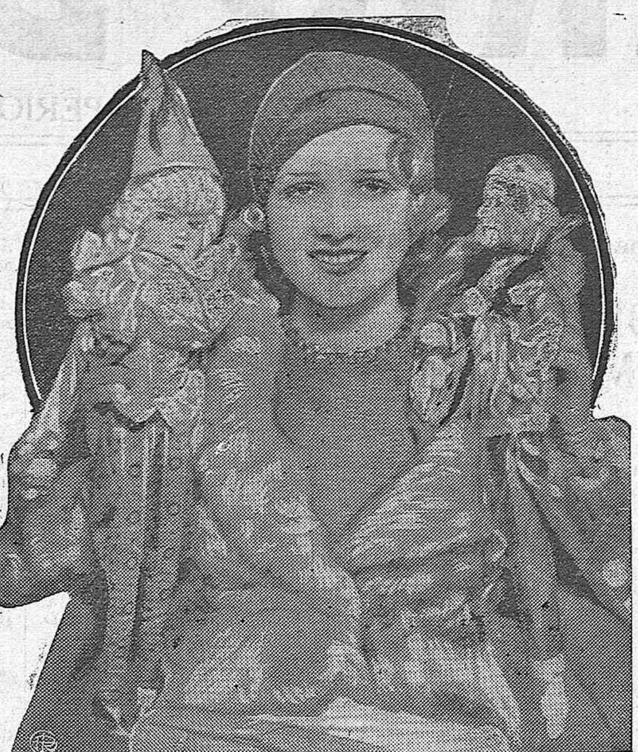
ANITA PAGE, gusta de coleccionar muñecas ataviadas por sí misma con originales vestidos que acreditan el talento creador de la notable artista de la pantalla.

EN MADRID Con un calor asfixiante se ha celebrado la novillada extraordinaria con novillos de Murube, que resultaron desiguales.