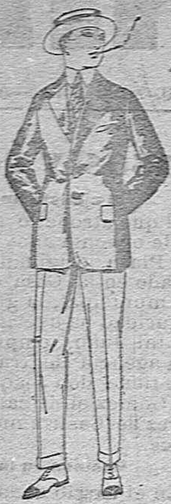
Trajes de alpaca negra o azul. de pts. 70 a 95 Americanas de alpaca negra o azul. de pts. 40 a 60 Pantalones de dril liso o listado. de pts. 9 a 18

SUCURSALES: Madrid, Barcelona, Alicante, Bilbao, Cádiz, Cartagena, Gijón, Granada, Málaga, Palma de Mallorca, Santander, Sevilla, Valencia, Valladolid Zaragoza.