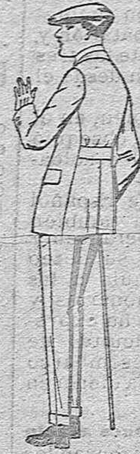
Traj. modelo Sport, de lanilla melton, etc., para jovencitos de 13 a 16 años. de pts. 37 a 90 El mismo modelo en dril listado, crudo o kaki. de pts. 25 a 42