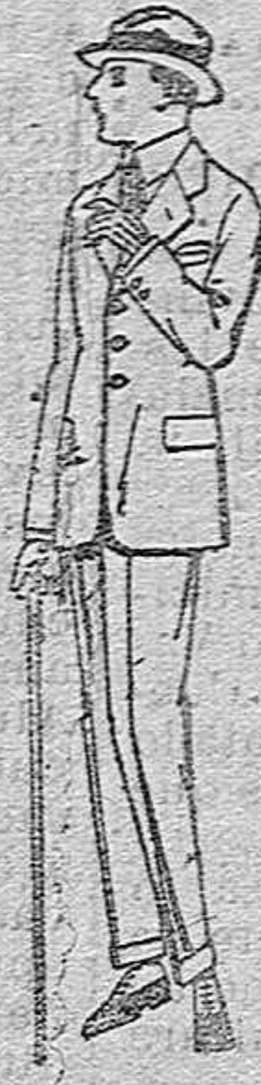
Trajes de lanilla, vicuña o estambre para jovencitos de 10 a 16 años. de pts. 30 a 90 Trajes de dril listado, crudo o kaki. de pts. 23 a 40