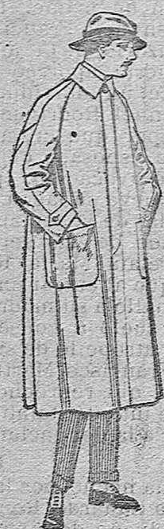
Impermeables forma gabán, raglán. de pts. 40 a 170 El mismo modelo en caoutchouc, negro. de pts. 70 a 90