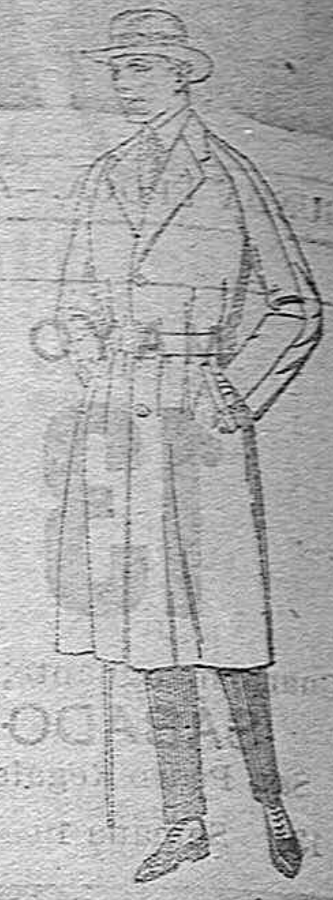
Gabanes de cheviot, tweed, melton, gabardina, etc., de pts. 60 a 150. Grandes existencias en generos para gabanes a medida.