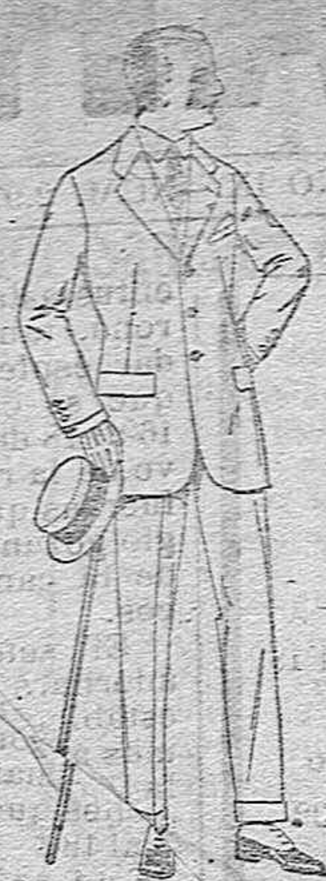
Trajes de lanilla, melton, estambre, vicuña o jerga. de pts. 35 a 145 Trajes de dril crudo, kaki o listado. de pts. 28 a 60