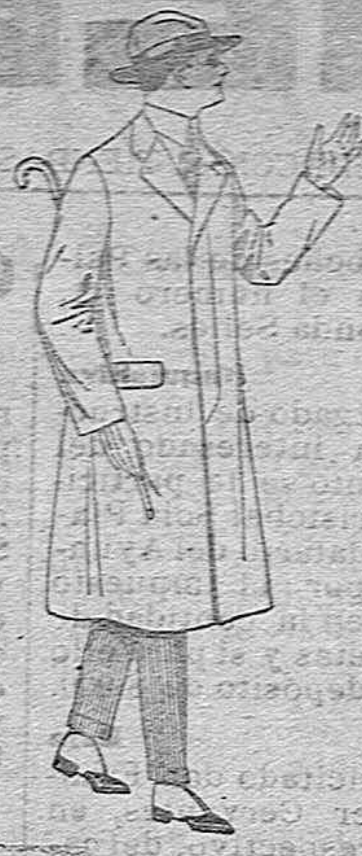
Gabanes de cheviot, melton, etc., con forro seda o satén. de pts. 52 a 200