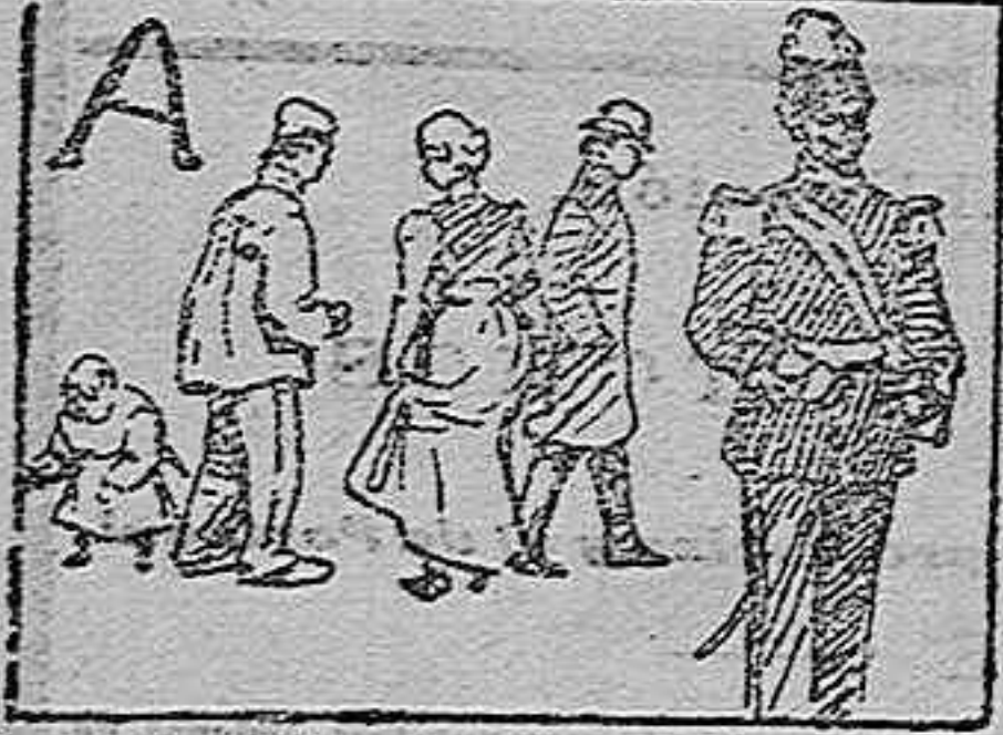
(La solución mañana.)