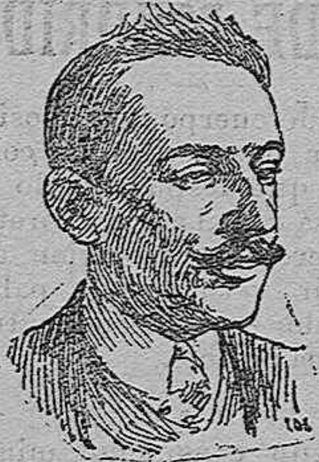
ANTES DE SUICIDARSE.

El anarquista Mateo Morral, autor del atentado á los Reyes, en Madrid.