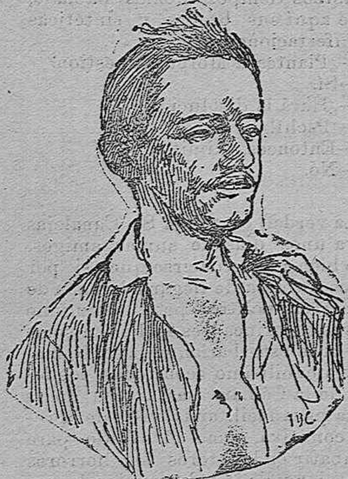
DESPUÉS DEL SUICIDIO.