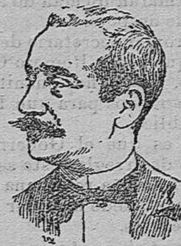
D. Cándido Nocedal, jefe del partido integrista.