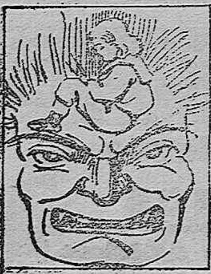
(La solución mañana.)