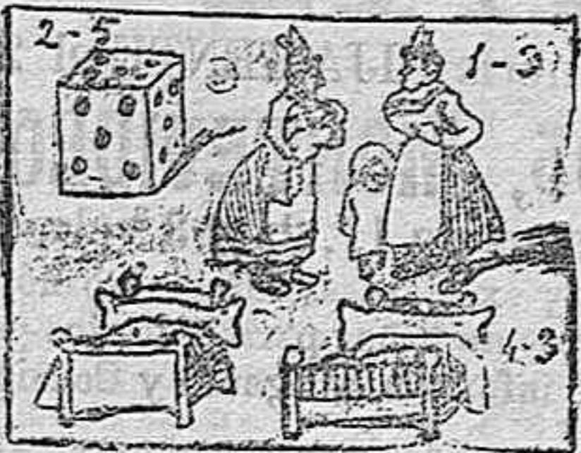
La solución mañana.