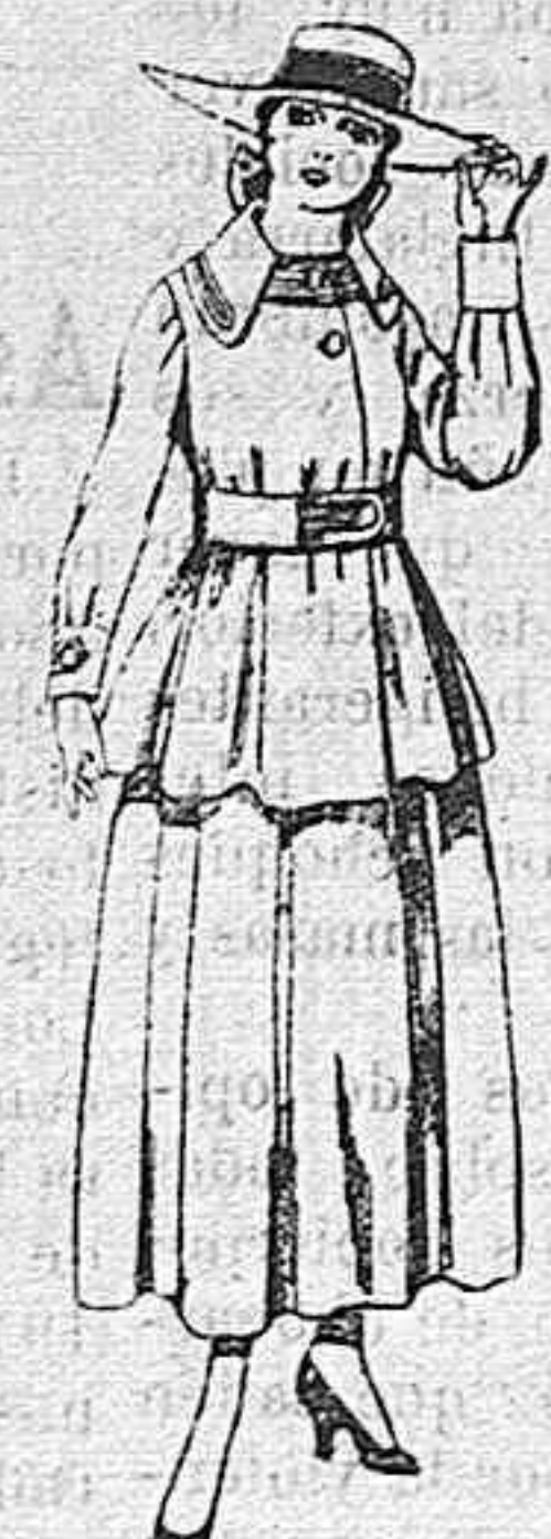
Trajes de lanilla negra, azul y color, para jovencitas de 13 á 16 años.