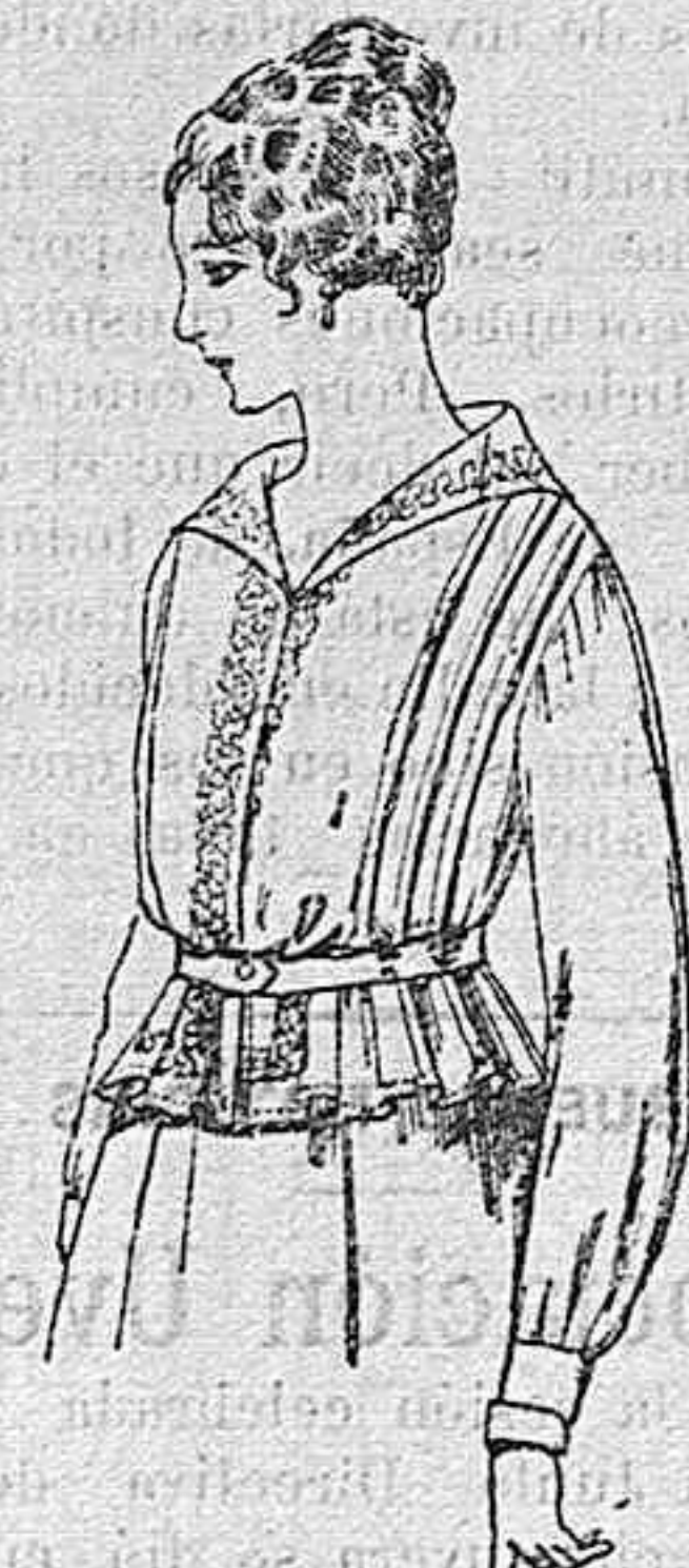
Blusa de voile blanco, bordados blancos, rosa ó azul A ptas. 9