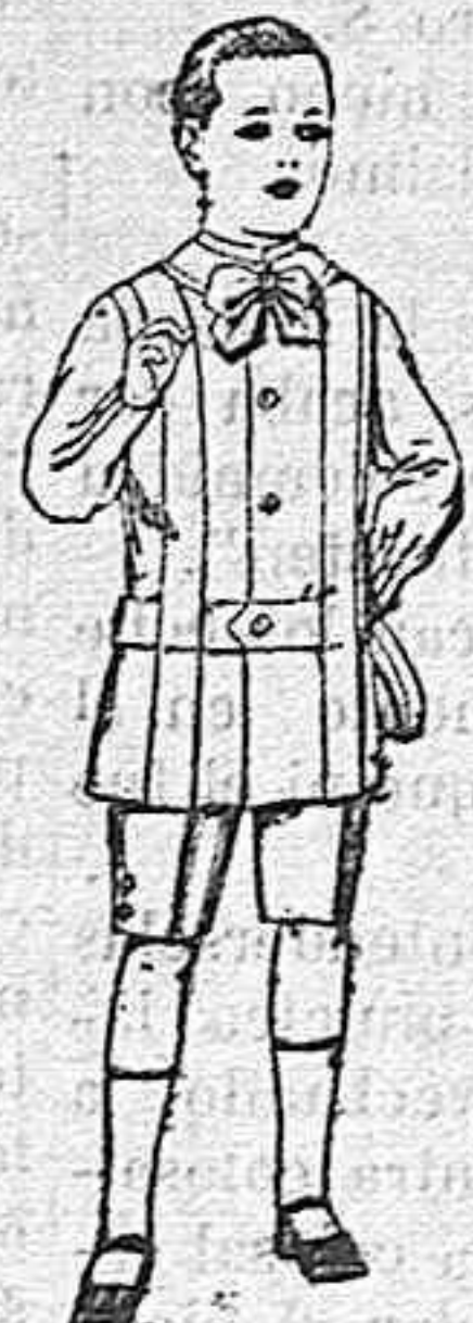
Trajes de lanilla, melton, etc. para niños de 4 á 7 años De ptas. 16 á 33.