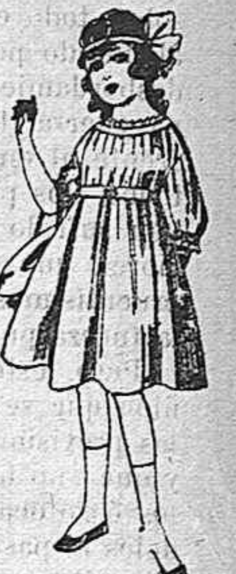
Vestidos de lana, azul, para niñas de 4 á 9 años De pesetas 22 á 25 Los mismos en voile. De pesetas 10 á 17