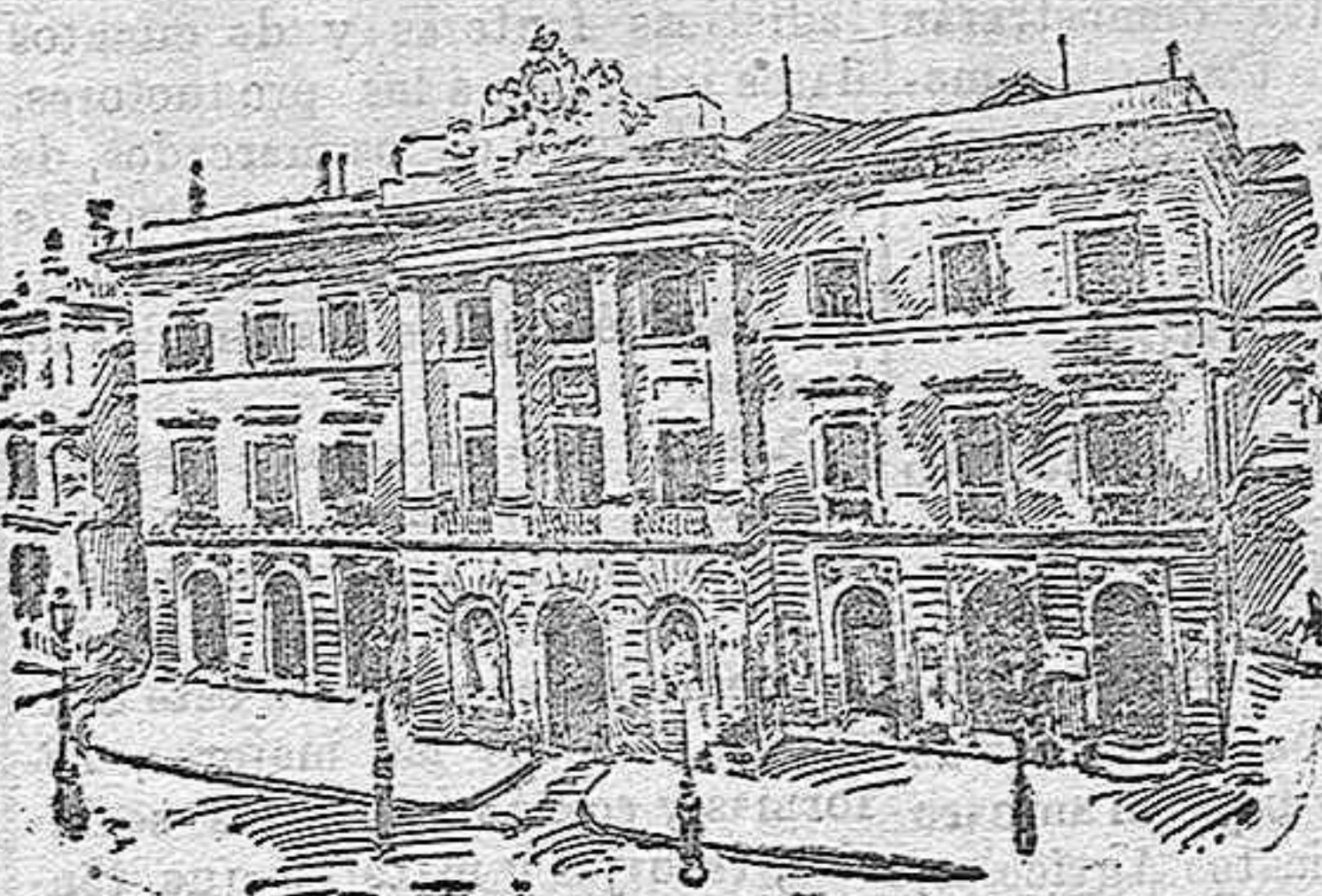
Palacio del Ayuntamiento.