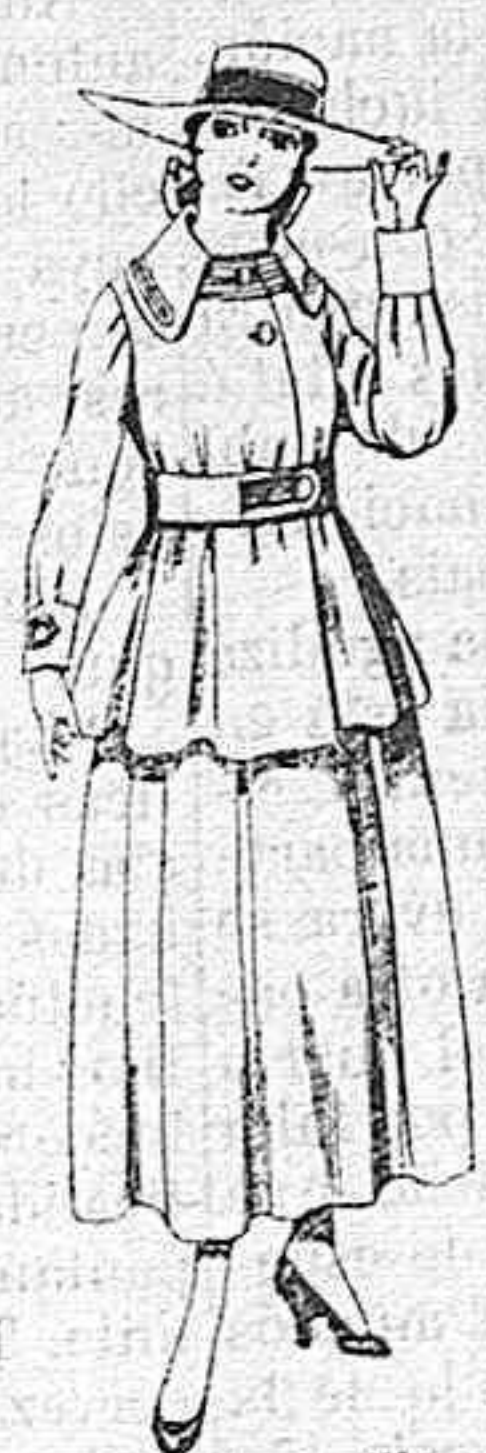
Trajes de lanilla negra, azul y color, para jovencitas de 13 á 16 años.