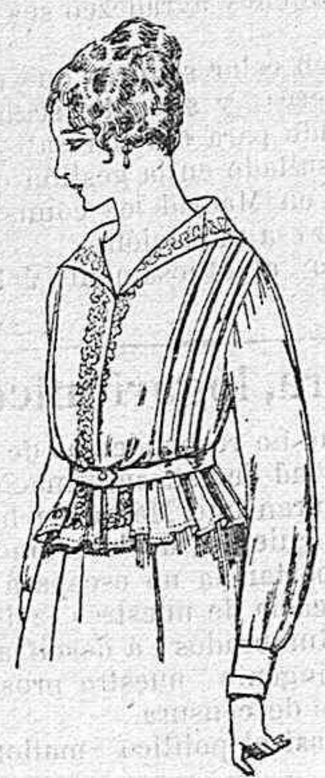
Blusa de voile blanco, bordados blancos, rosa ó azul A ptas. 9