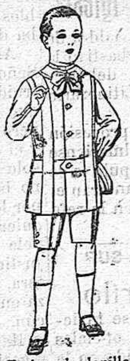
Trajes de lanilla, melton, etc. para niños d 4 á 7 años De ptas. 16 á 33.