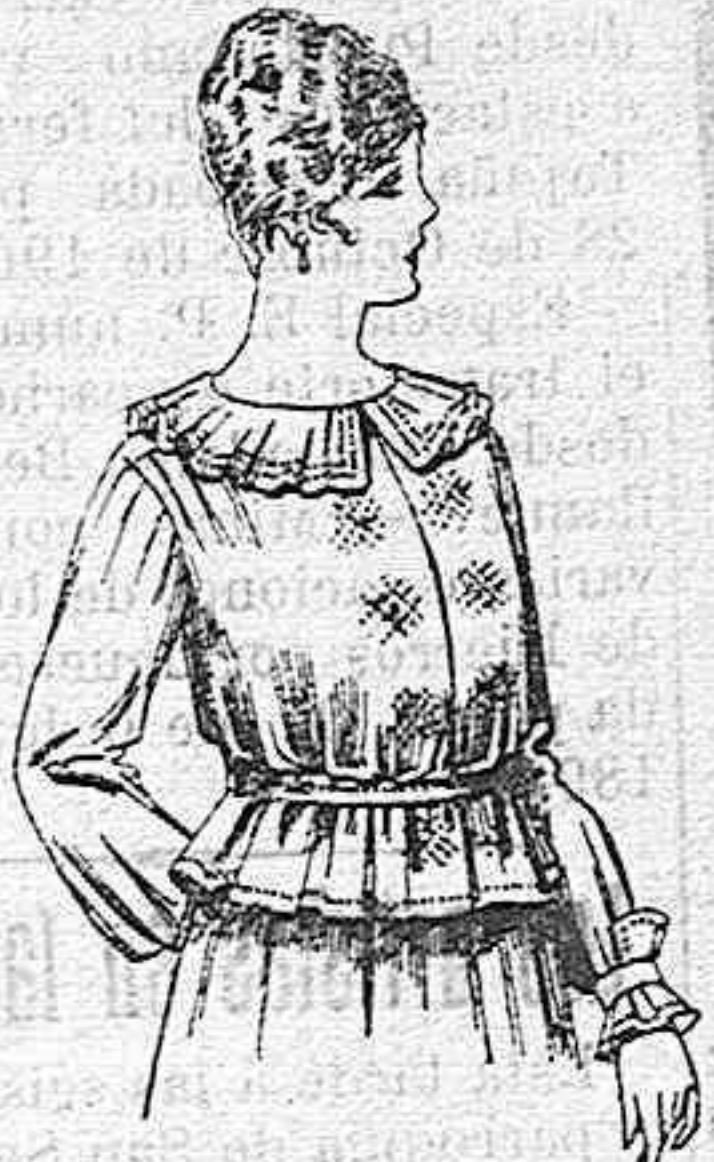
Blusa de crespón ó seda, en negro, azul y color. A ptas. 33.