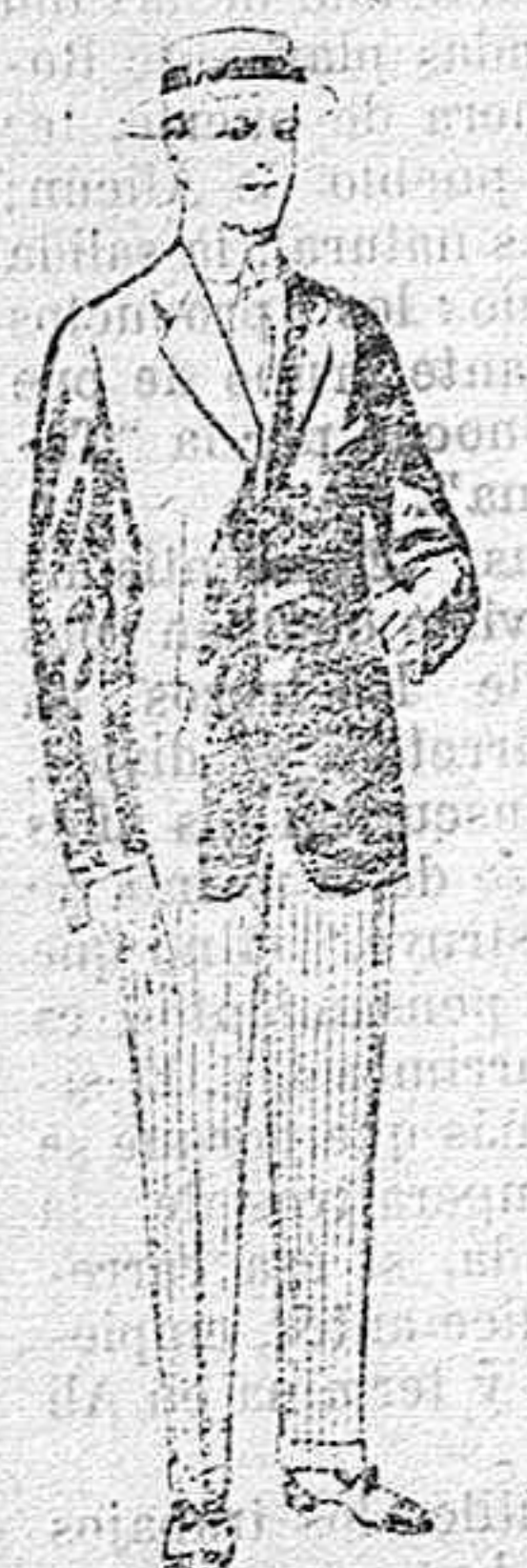
Trajes de lanilla, vicuña, etc., para jovencitos de 10 á 16 años. De pesetas 10 á 56