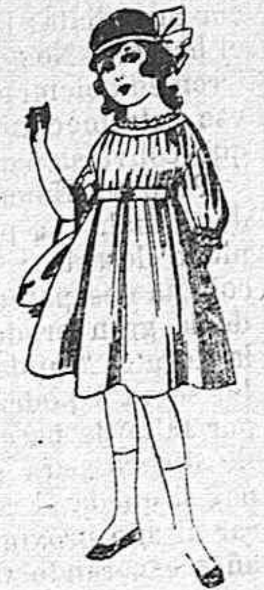
Vestidos de lana, azul, para niñas de 4 á 9 años De pesetas 22 á 25 Los mismos en voile. De pesetas 10 á 17