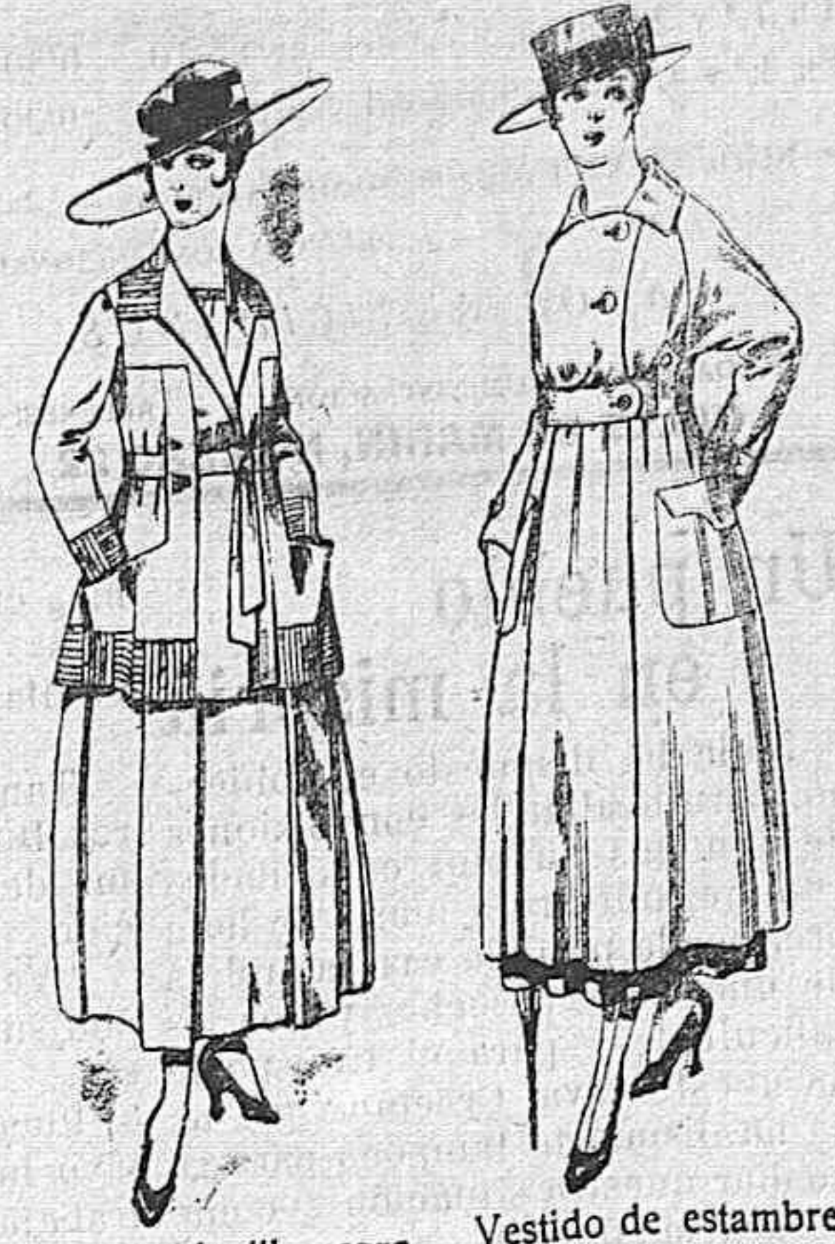
Trajes de lanilla negro, azul, y color, bordado, á pesetas 90. Vestido de estambre negro, azul y colores bordado De peseta 64 á 75