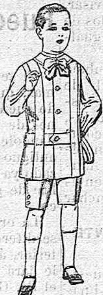
Trajes de lanilla, melton, etc. para niños de 4 á 7 años. De ptas. 16 á 33.