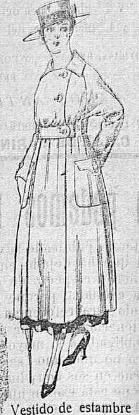
Vestido de estambre negro, azul y colores bordado. De peseta 64 á 75