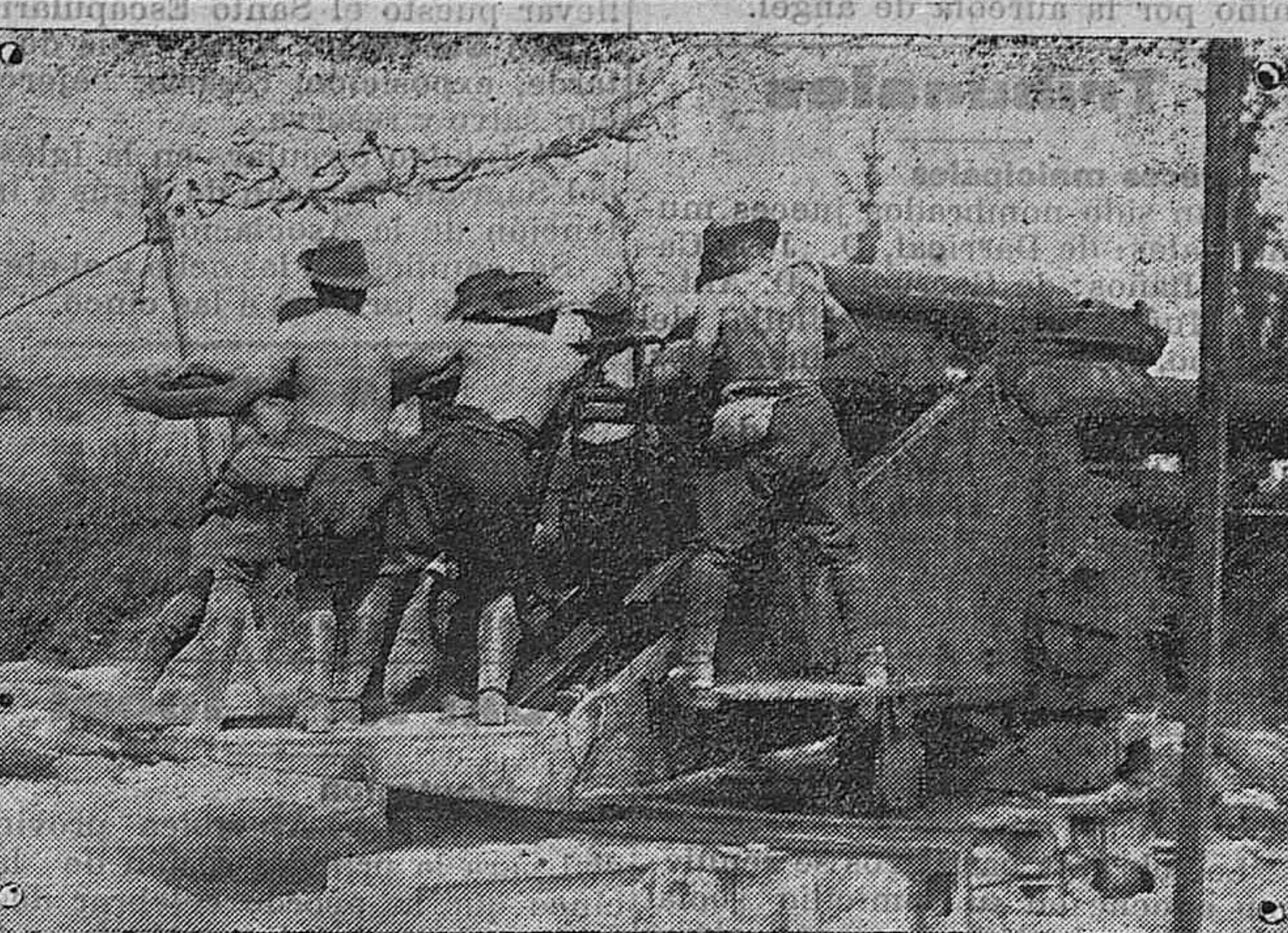
La Guerra Europea. Frente inglés: Soldados australianos en el servicio de artillería.

Los hechos hablan por sí mismos. Abrucena 2 Octubre 1916.