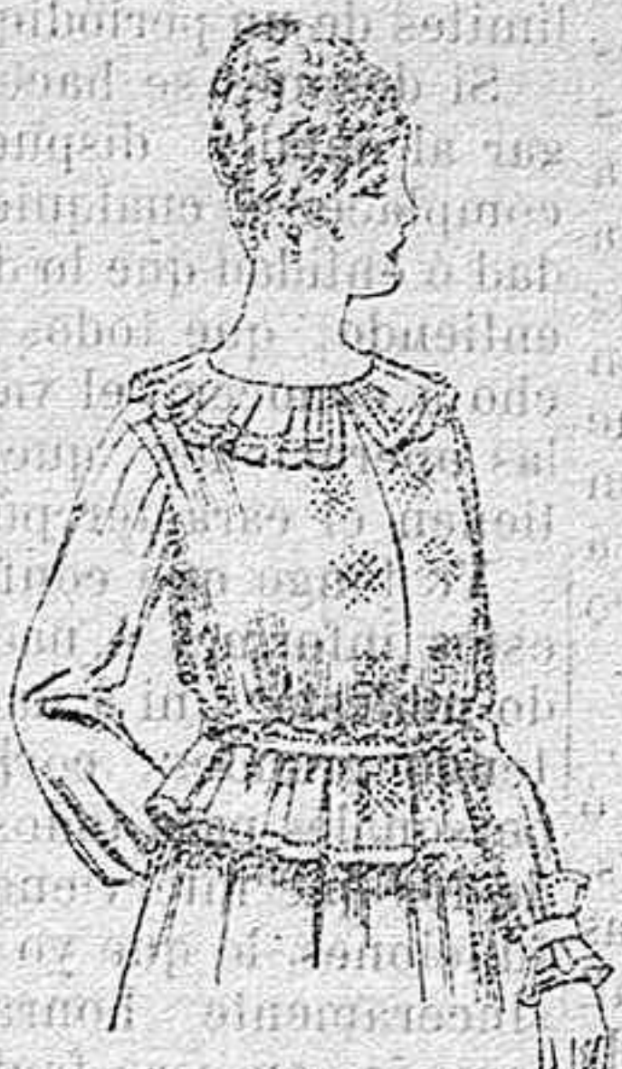
Blusa de crepón ó seda, en negro, azul y color. A ptas. 33.