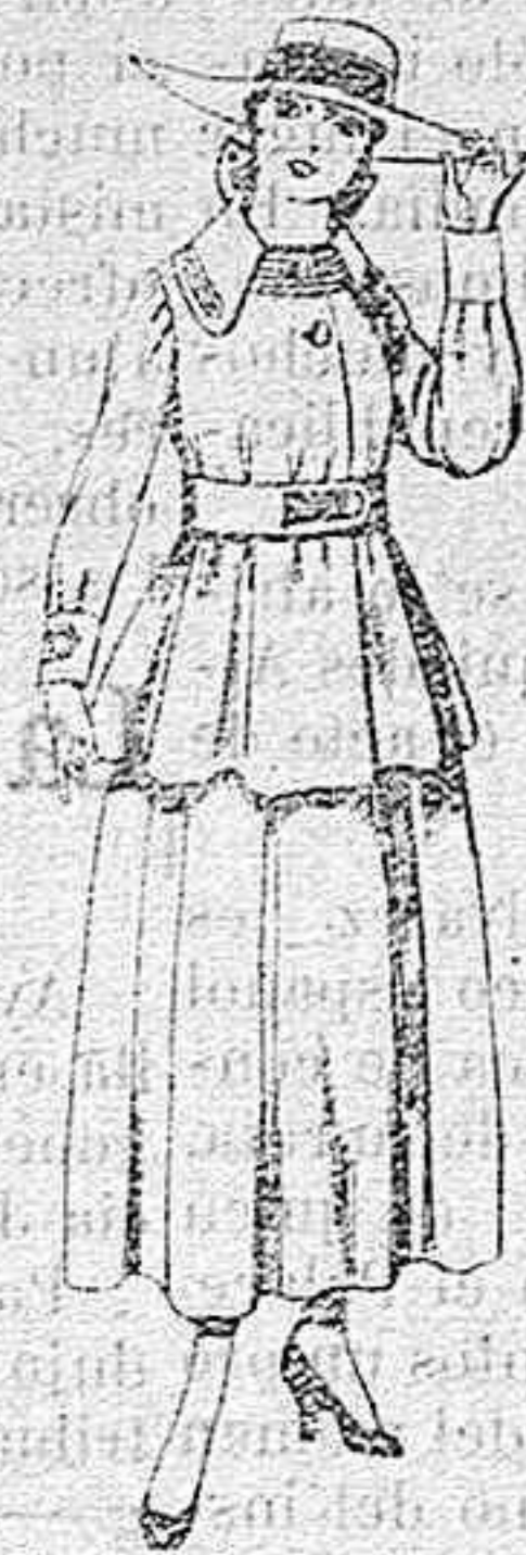
Trajes de lanilla ne- gra, azul y color, pa- ra jovencitas de 13 á 16 años.