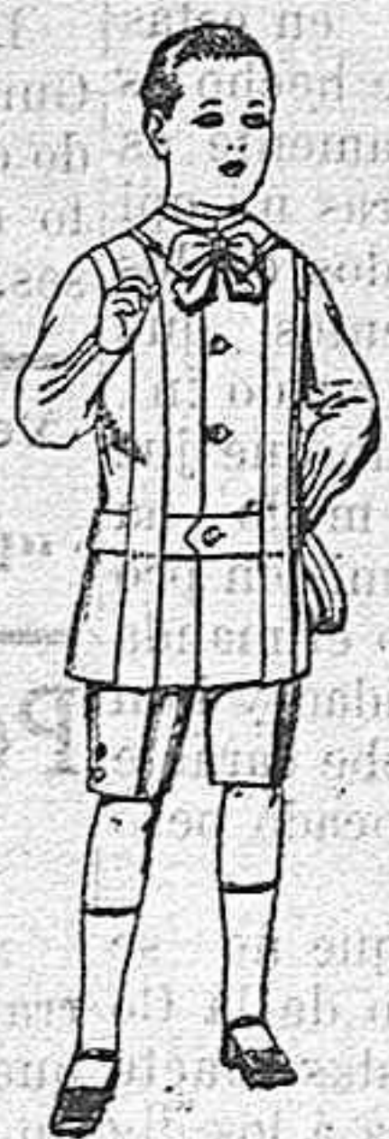
Trajes de lanilla, melton, etc. para niños d 4 á 7 años De ptas. 16 á 33.