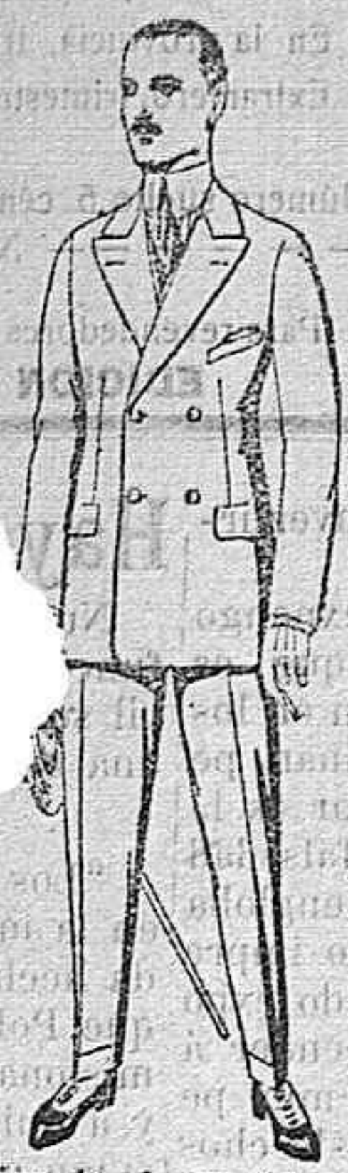
Trajes de vicuña ó jerga negros ó azules, de pe- setas 38 á 80. Los mismos de melton ó estambre novedad, de pe- setas 33 á 90.

Exposición de Artículos para la temporada