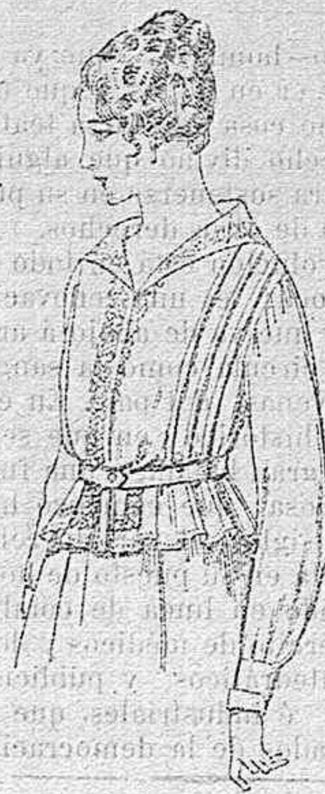
Blusa de voile blanco, bor- dado blancos, rosa ó azul A ptas. 9