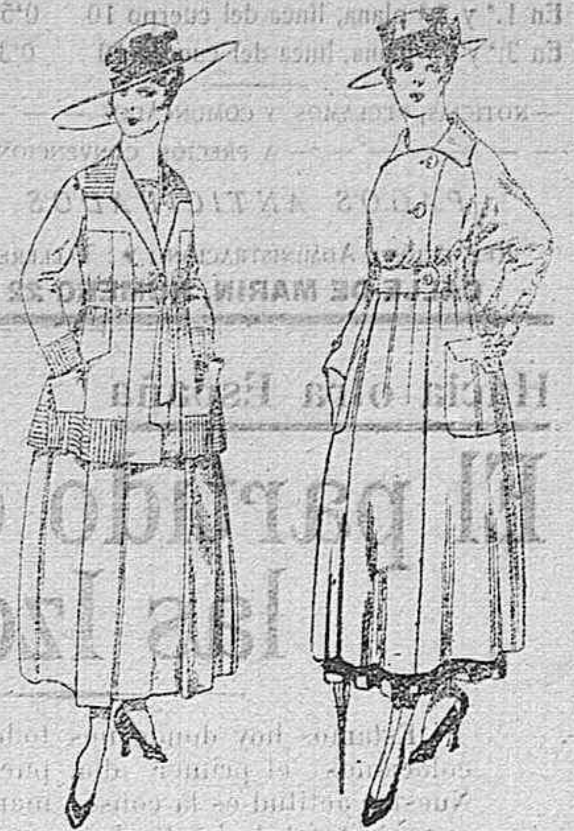
Trajes de lanilla negro, azul, y color, bordado, á pesetas 90.