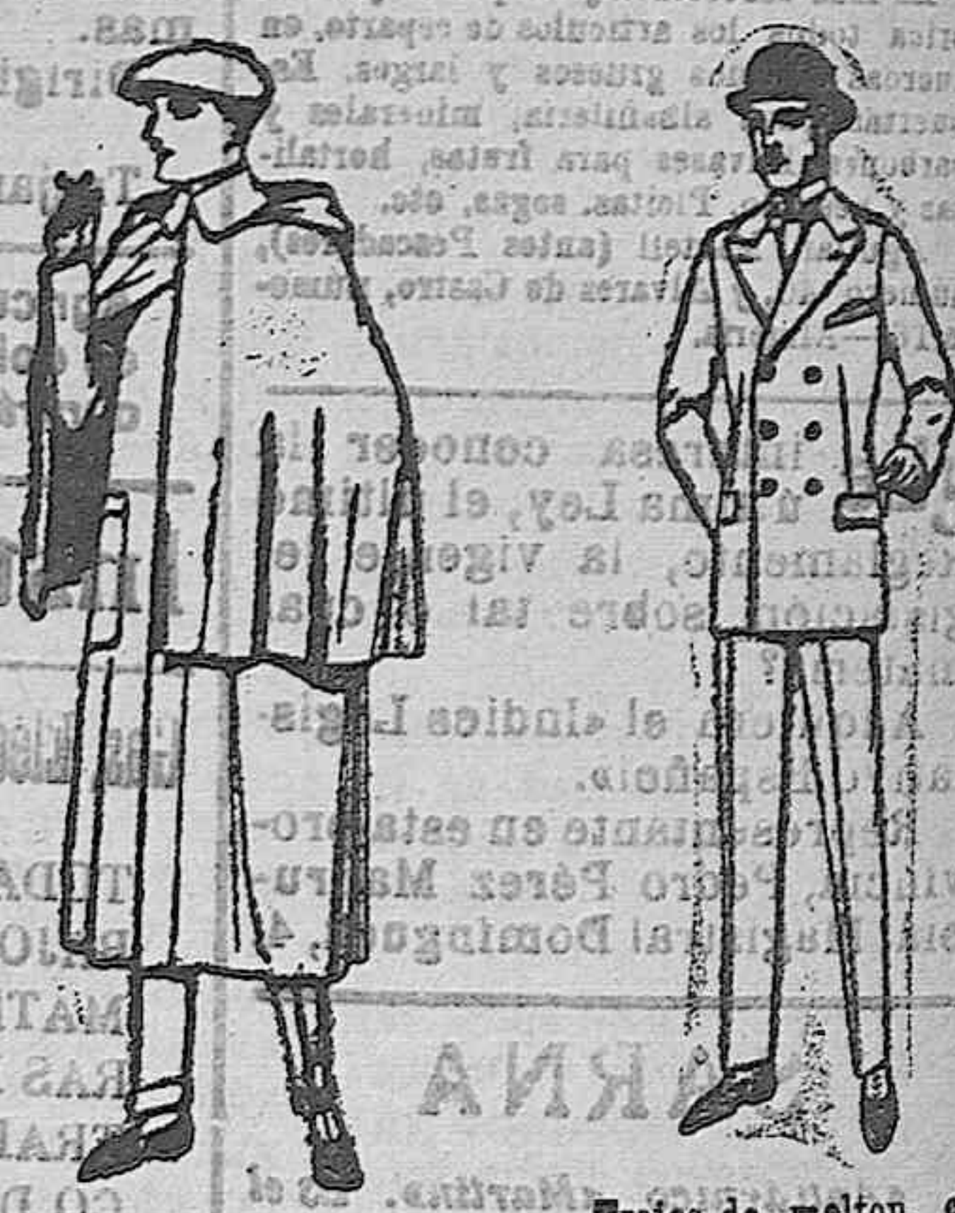
Impermeables macfarland en negro y azul. De ptas. 85 a 175 Trajes de melton, cheviot, estambre, viena o jerga. De ptas. 50 a 170