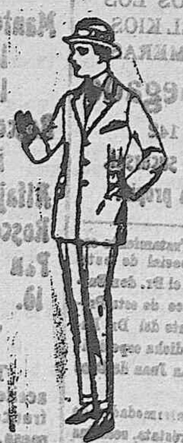
Trajes de patón, viena o jerga, forma sport, para niños y jovencitos de 10 a 16 años. De ptas. 40 a 85