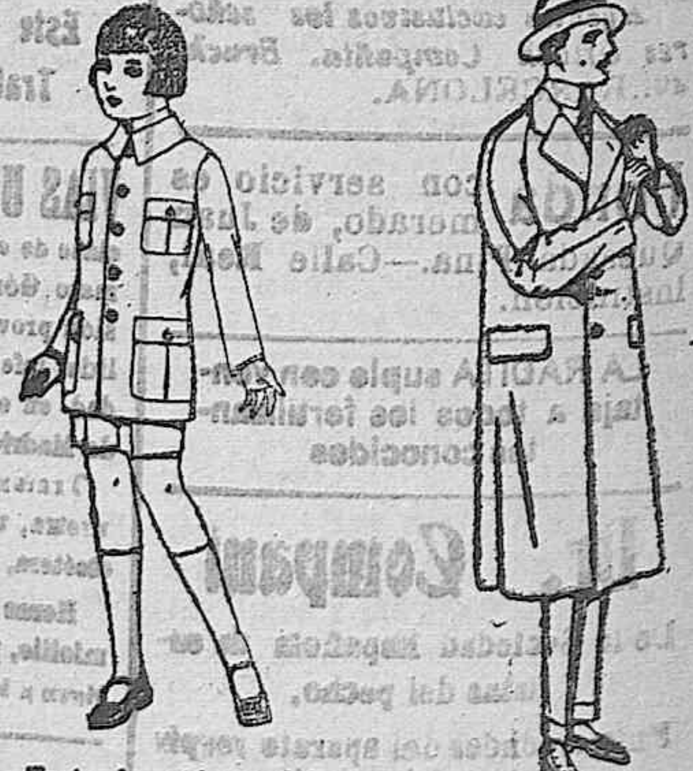
Trajes de patón, modelo sport, para niños de 4 a 9 años. De ptas. 22 a 35 Gabanes raglán de patón, melton o cheviot, con forro seda e están. De ptas. 60 a 100

PRECIO FIJO VENTAS AL CONTADO Pidase el catálogo general