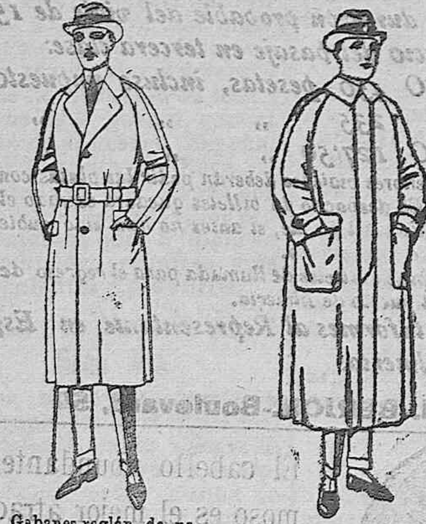
Gabanes raglán de patón, gamuza o cover. De ptas. 75 a 200 Impermeables raglán en azul y colores. De ptas. 32 a 170

SUCURSALES: Madrid, Barcelona, Alicante, Bilbao, Cádiz, Cartagena, Gijón, Granada, Málaga, Palma de Mallorca, Santander, Sevilla, Valencia, Valladolid y Zaragoza