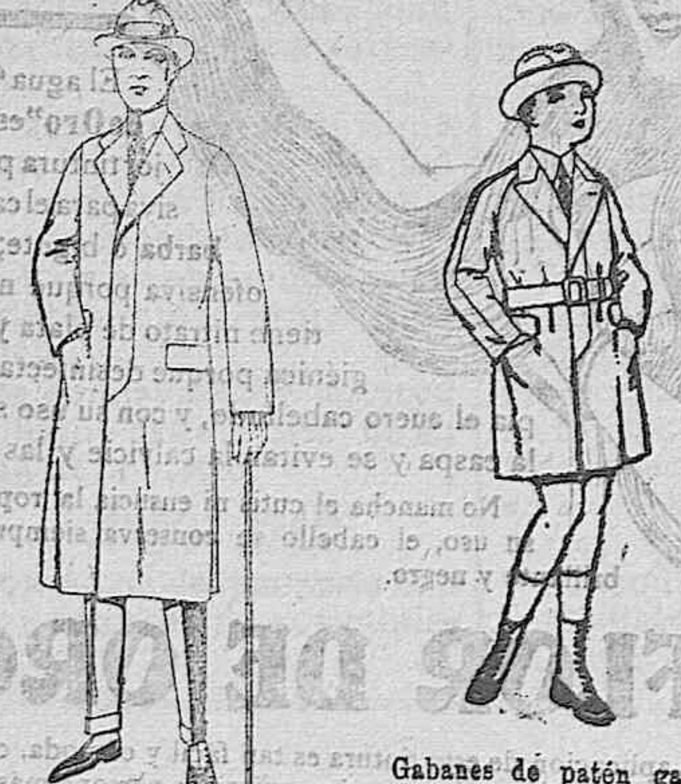
Gabanes de patón gamuza, etc., para niños y jovencitos de 10 a 16 años. De ptas. 45 a 140 Gabanes de cheviot, gamuza o patón, etc. De ptas. 30 a 75