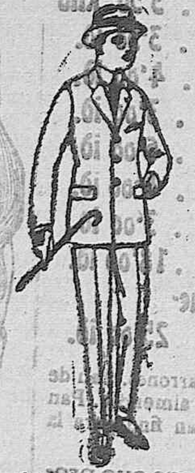
Trajes de patón y viena o jerga, para niños y jovencitos de 10 a 16 años. De ptas. 30 a 85