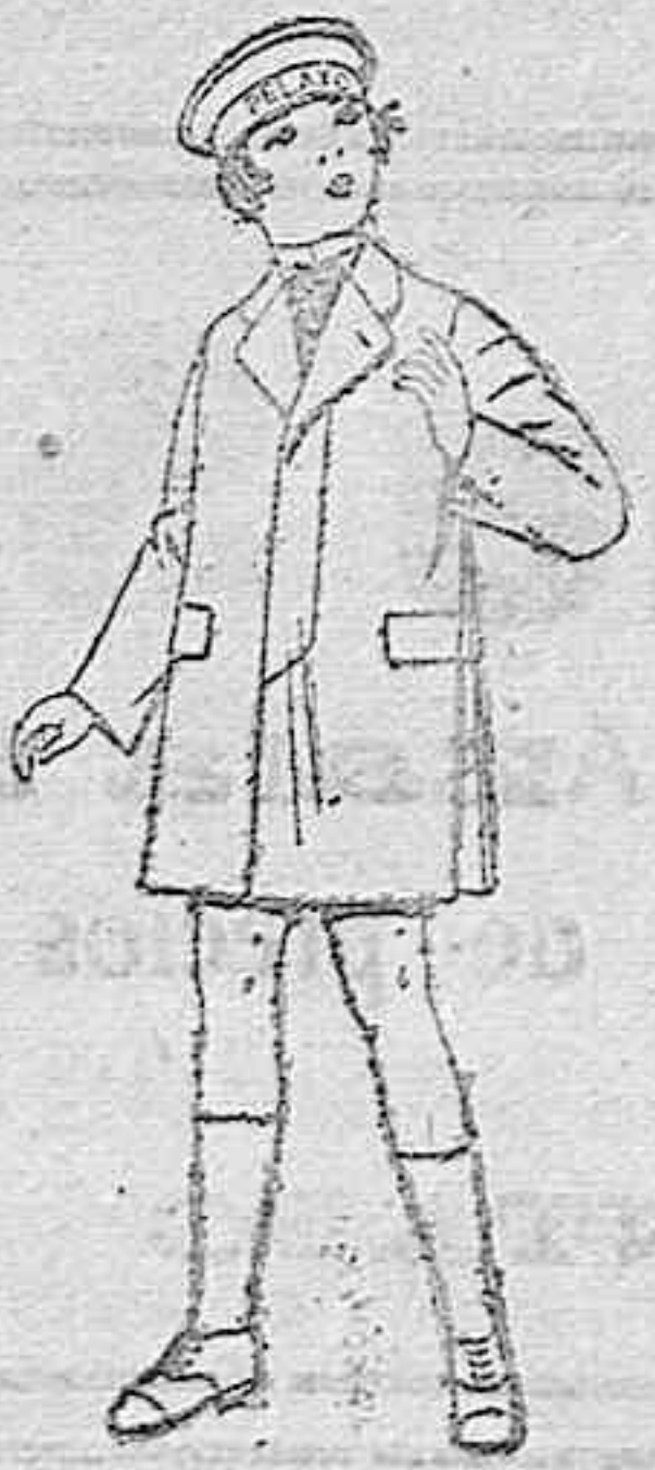
Gabanes de patén, gamuza, para niños de 4 a 9 años. De ptas. 20 a 50