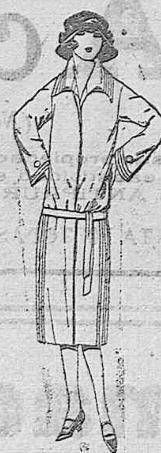
Vestidos de sarga inglesa, gabardina, en azul y color, para jovencitas de 12 a 15 años. De ptas. 60 a 80