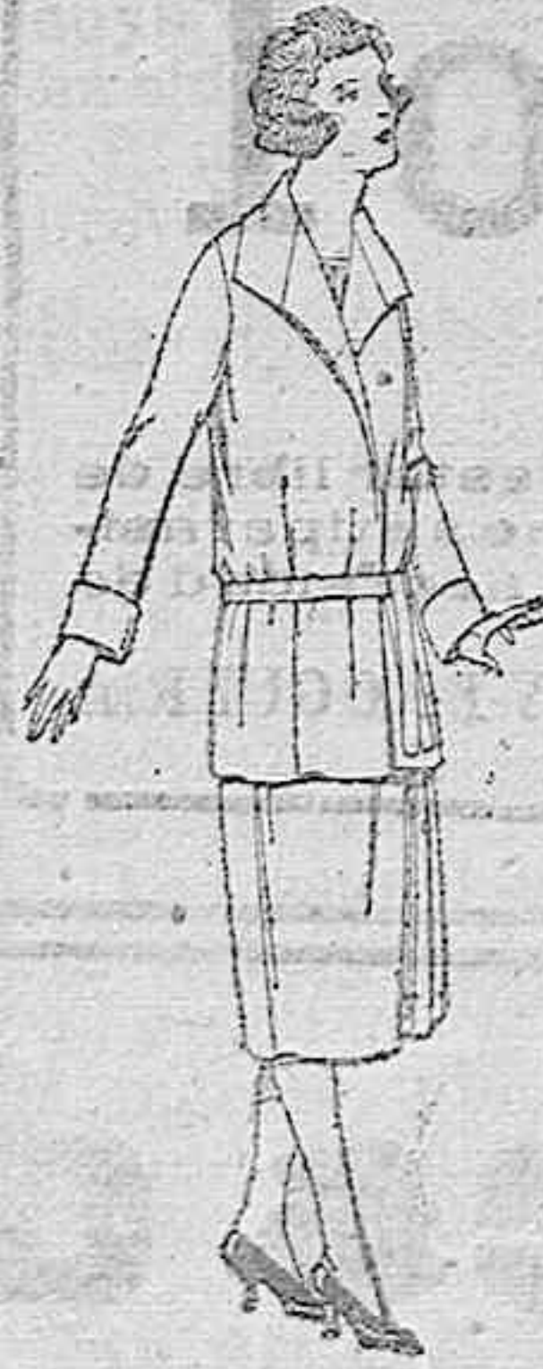
Trajes de estambre, lana, etc., en azul y color, para jovencitas de 12 a 15 años. De ptas. 58 a 100