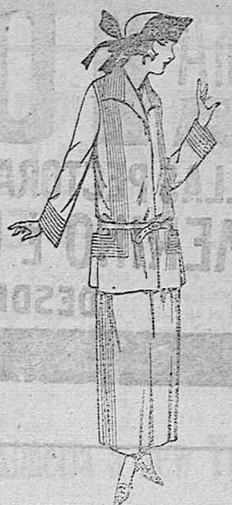
Trajes sastre, de popeline, estambre, en murino, negro y colores moda. De ptas. 125 a 180