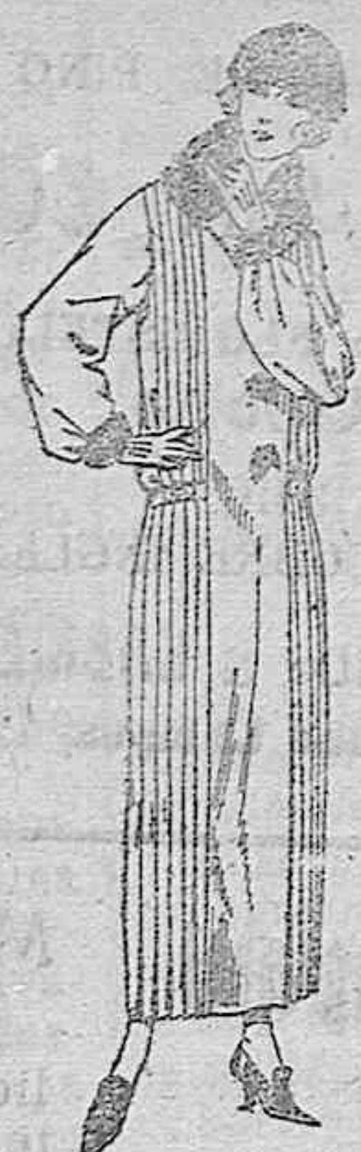
Vestidos de sarga, crepé, etc., en negro, azul y color. De ptas. 195 a 180