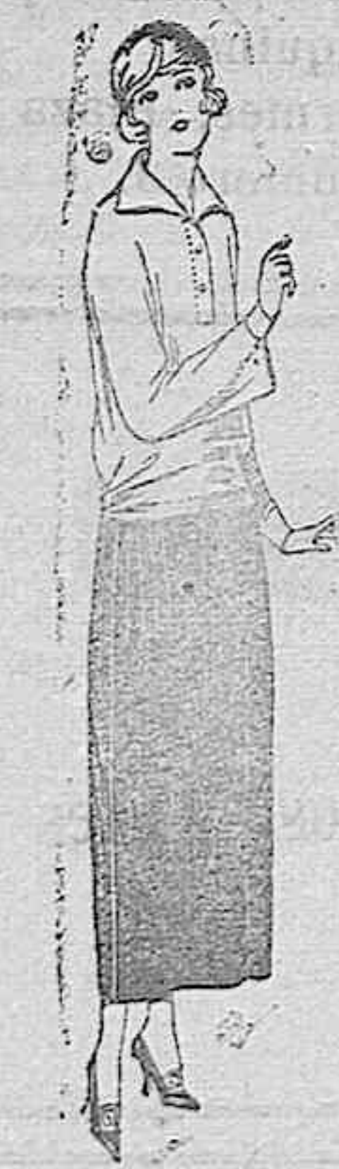
Faldas de popeline, estambre, en azul, negro y color. De ptas. 28 a 50