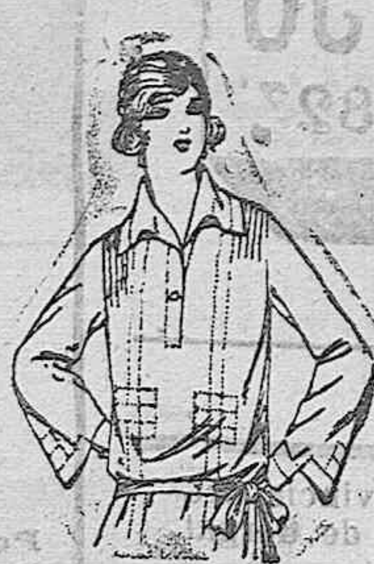
Blusas de crepón de seda, en negro, azul y color, adornos calados. De ptas. 30 a 65