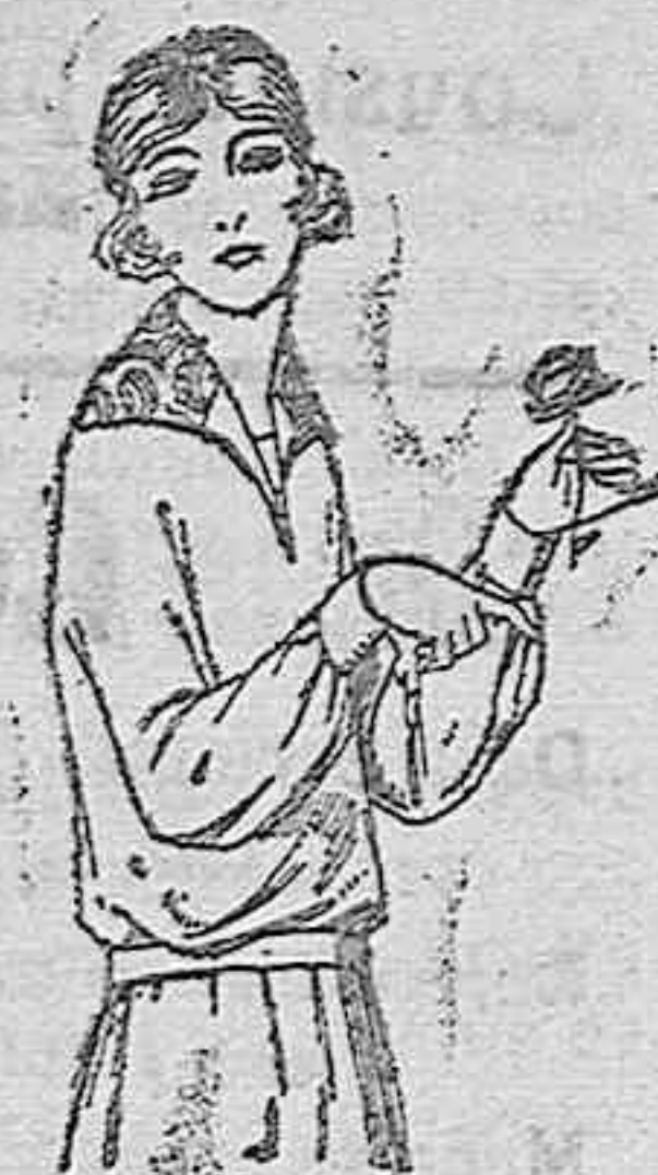
Blusas de punto de seda diferentes colores, adornos bordados. De ptas. 55 a 75