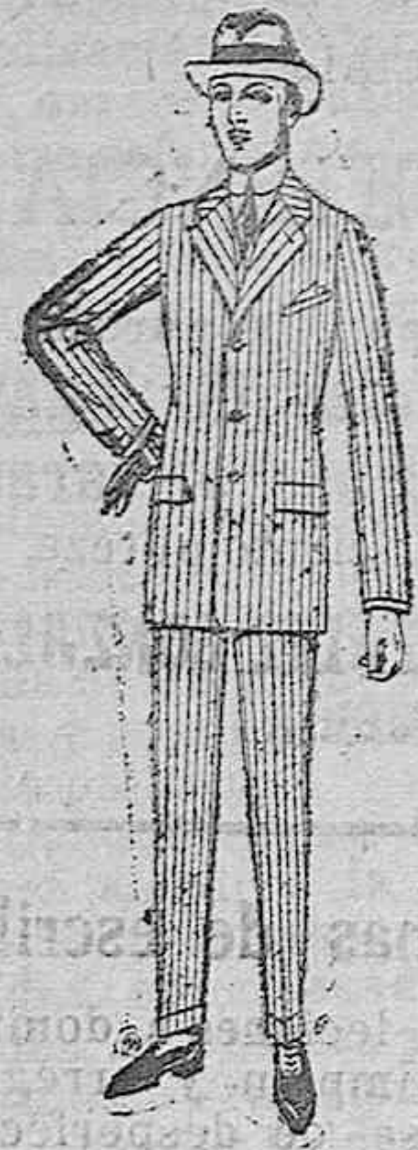
Trajes de cheviot, patén, estambre, etc. De ptas. 33 a 135

SUCURSALES: Madrid, Barcelona, Alicante, Bilbao, Cádiz, Cartagena, Gijón, Granada, Málaga, Palma de Mallorca, Santander, Sevilla, Valencia, Valladolid, Zaragoza.