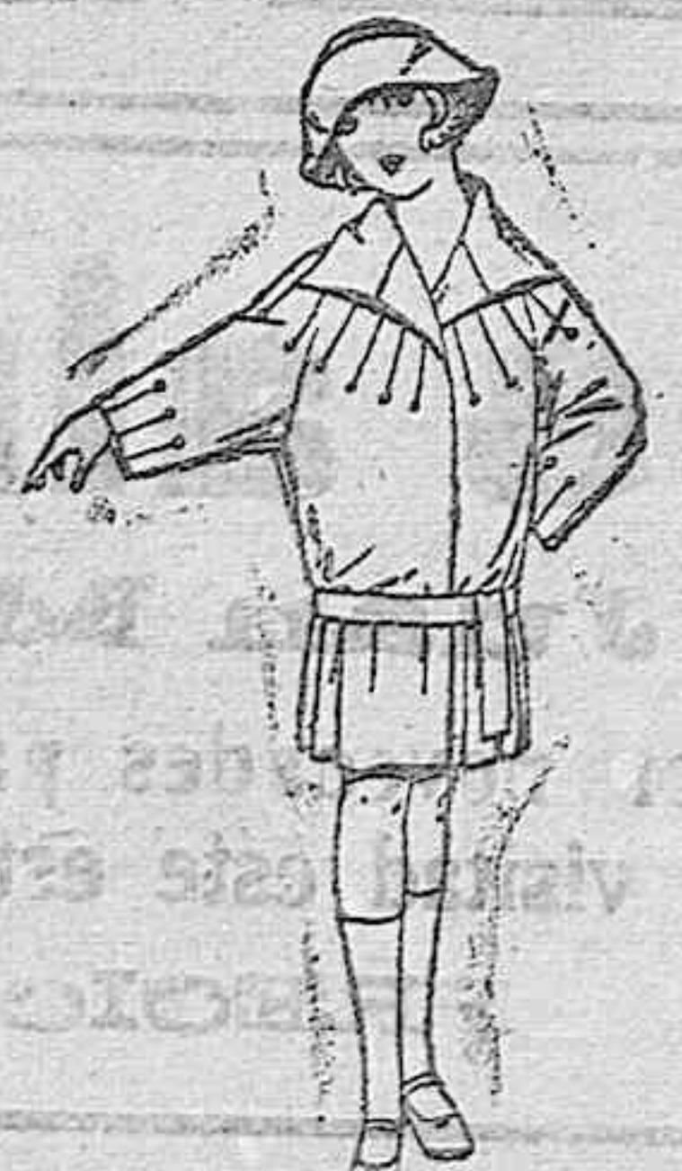
Abrigos de terciopelo de lana, en azul y color, adornos respuntados, Paletots de punto de seda, colores moda. De ptas. 25 a 40