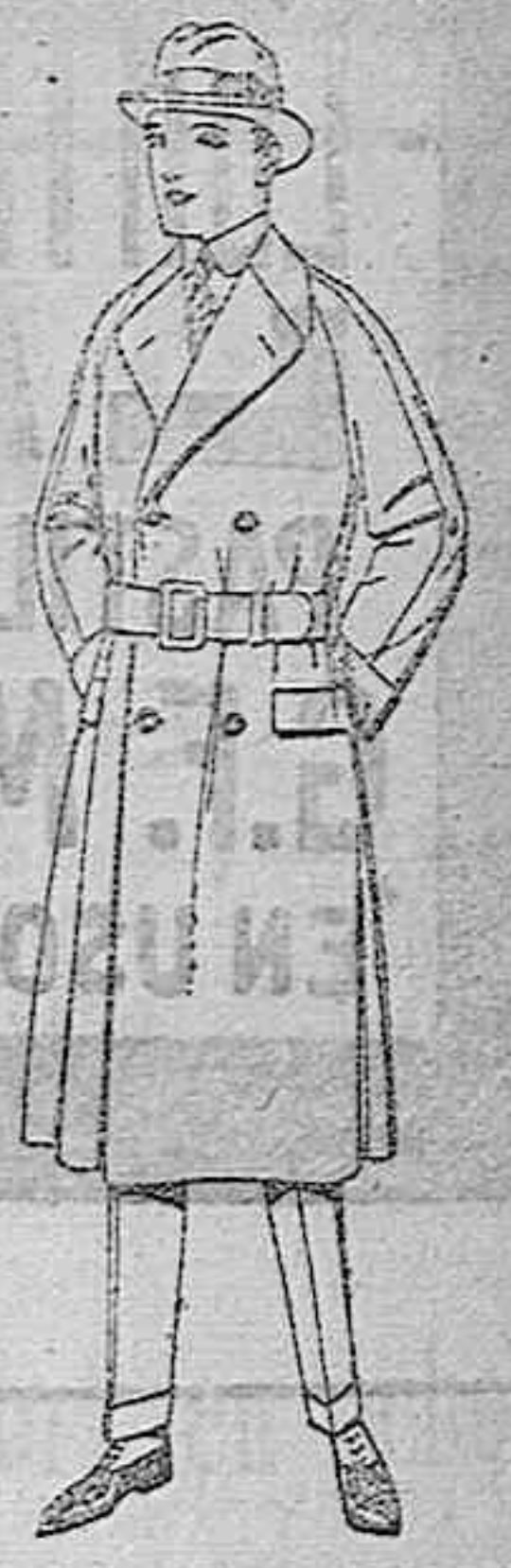
Gubanes cruzados de cheviot, cover o pluma. De ptas. 195 a 180