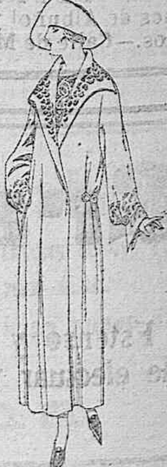
Abrigos de terciopelo de lana, gamuza, paletete, en azul, negro y color, adornos bordados. De 80 a 95