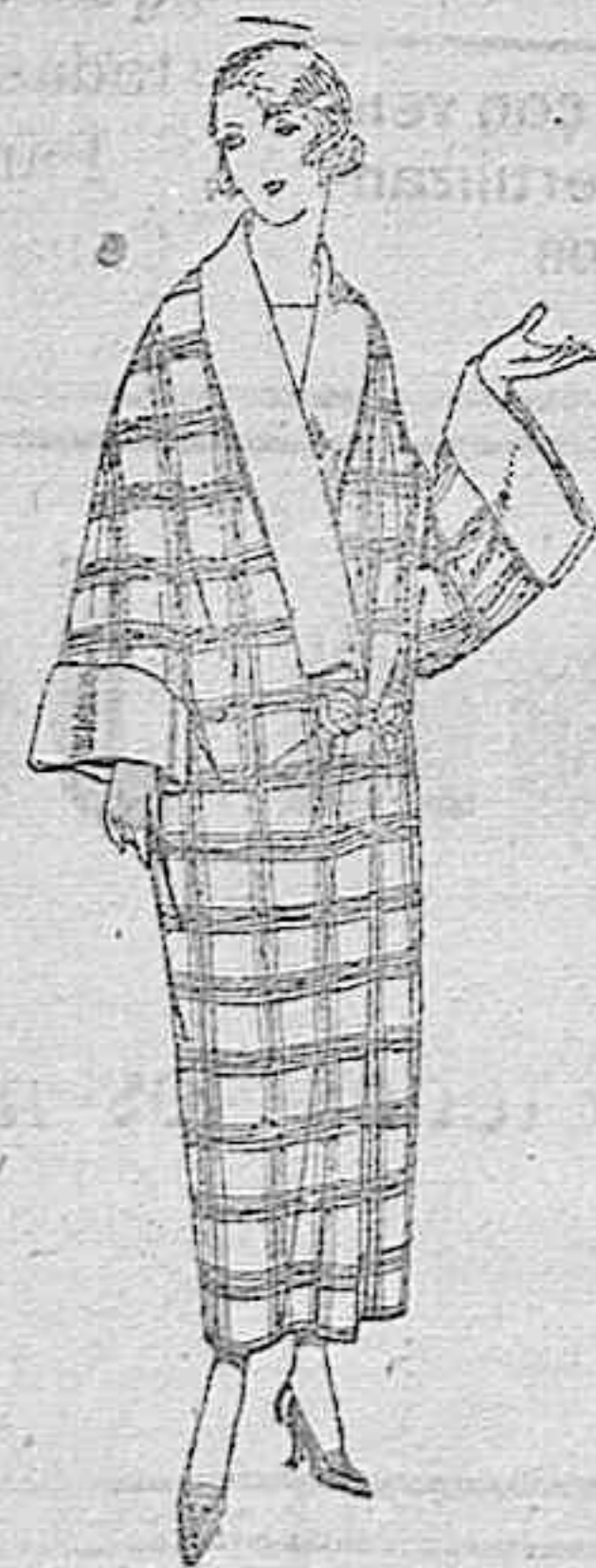
Batas de franela dibujos novedad. De ptas. 27 a 38