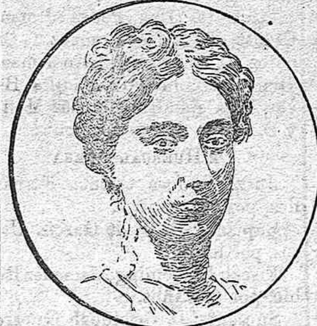
La princesa Luisa de Orleans.

En el histórico palacio de Woodnorton, actual residencia de los duques de Orleans, tuvo efecto anteayer, el enlace del infante don Carlos de Borbón con la hermosa princesa Luisa de Orleans.