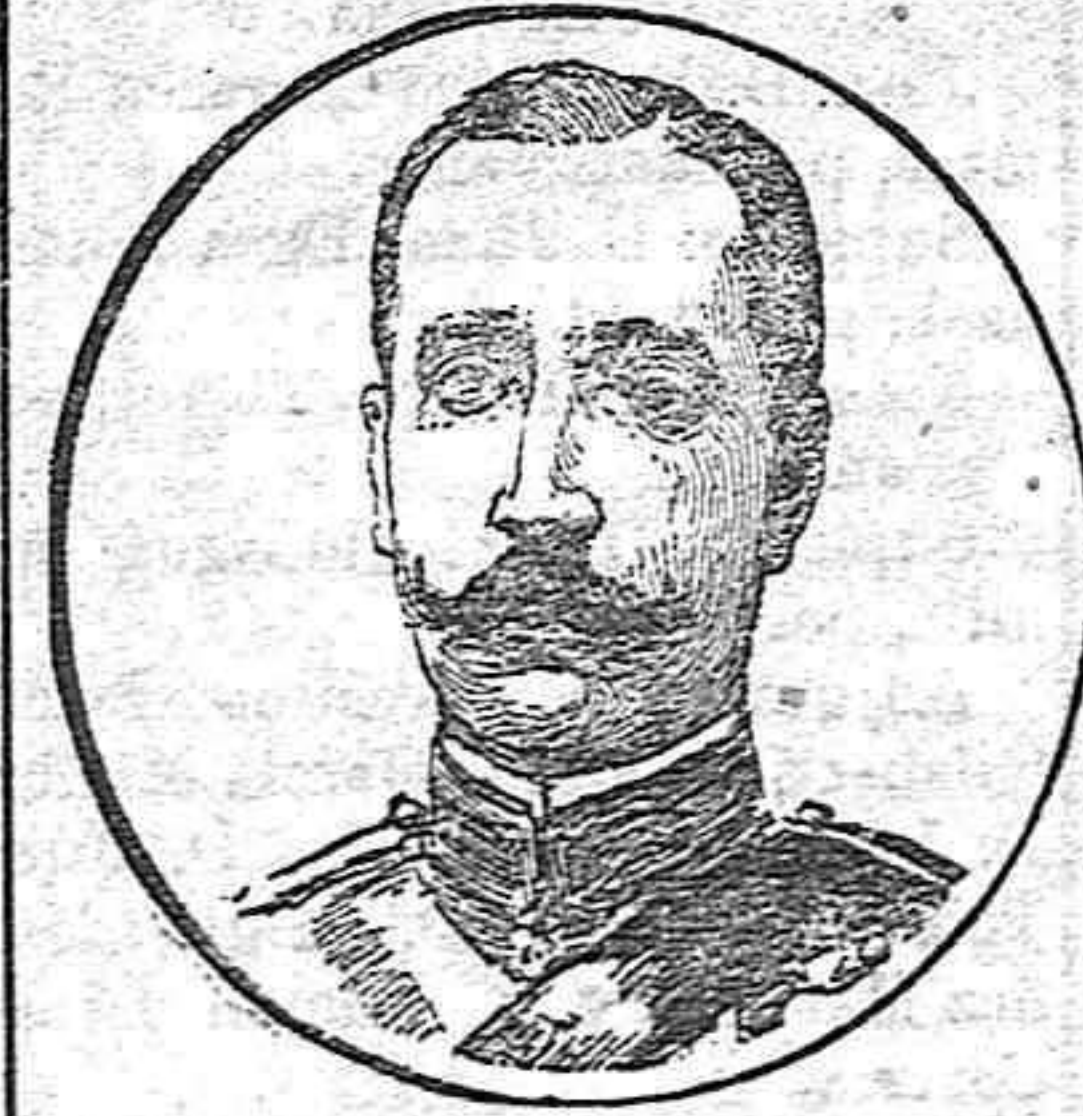
S. A. el infante D. Carlos de Borbón.

A la ceremonia han asistido los reyes de Inglaterra, España y Noruega, con sus respectivas esposas.