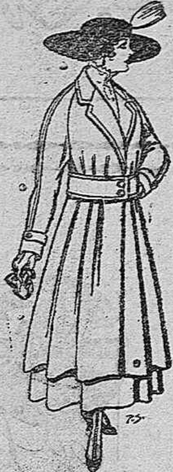
Abrigos de patén gran novedad, para señora. A ptas. 50.