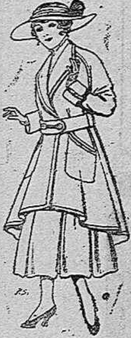
Abrigos de patén para jovencitas de 13 a 16 años. De pesetas 25 a 35.