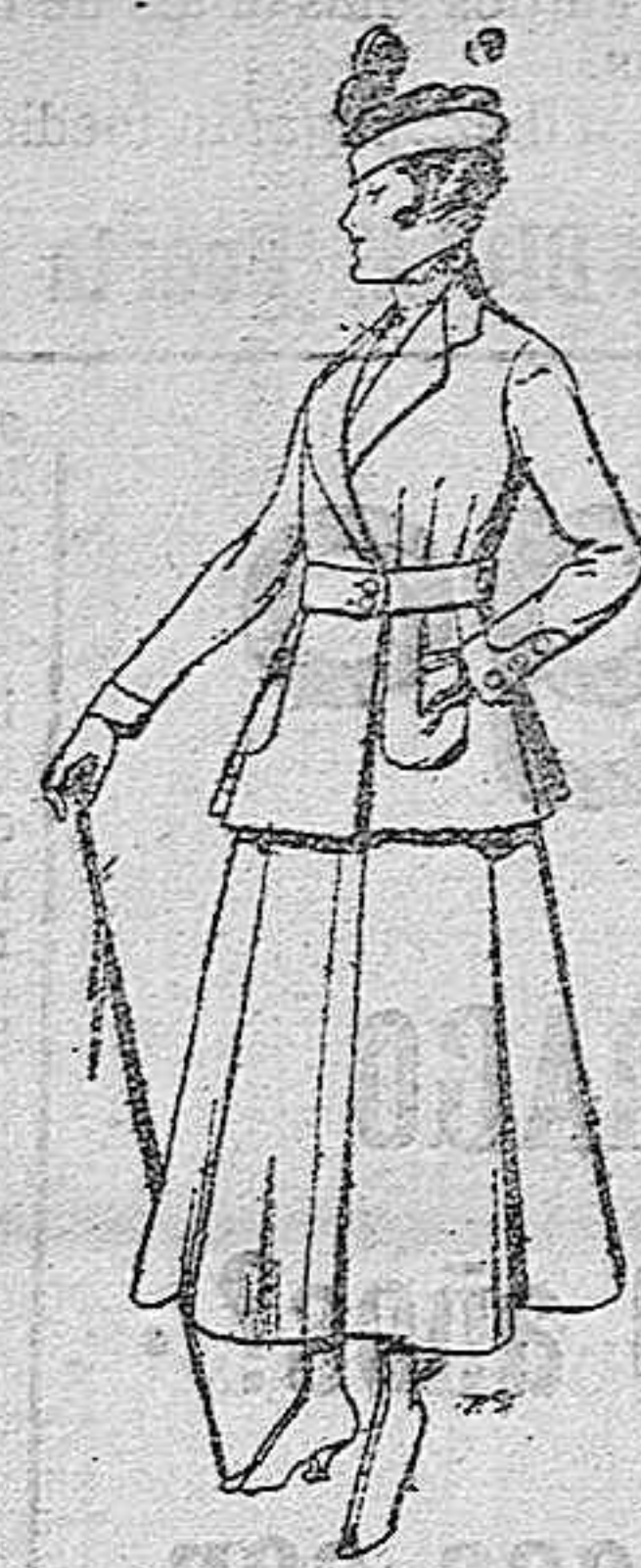
Trajes de lana negra, azul y color, para señora. A pesetas 60.