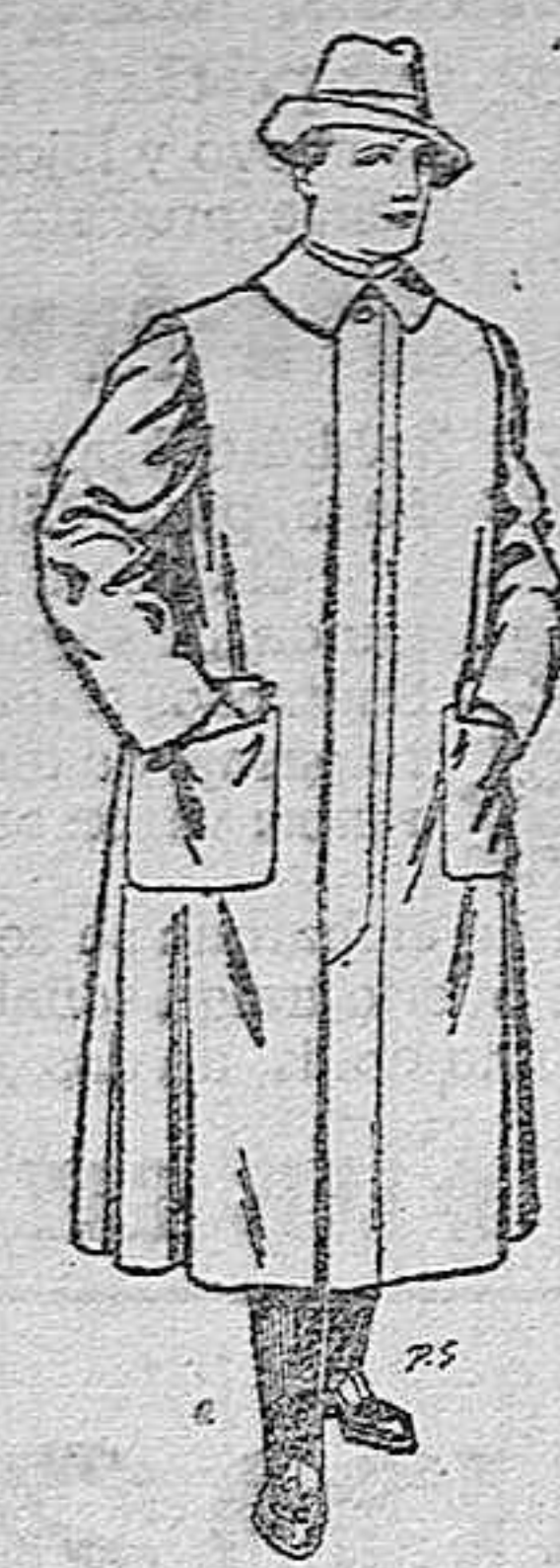
Impermeables para gabra gabán en color beige o gris. De pesetas 35 a 100.