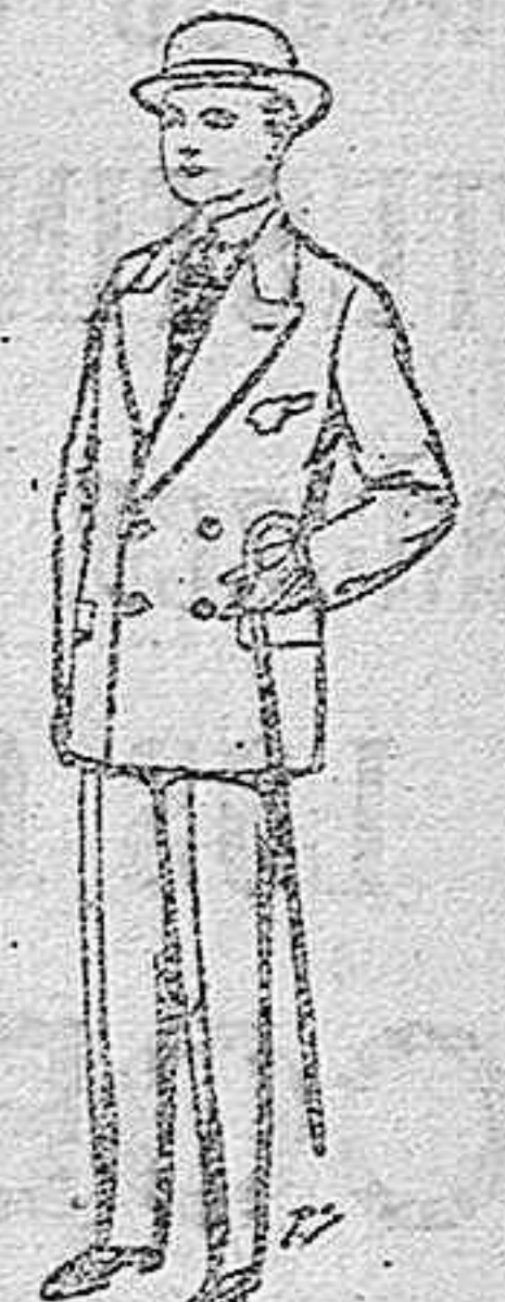
Trajes de patén vicuña etc., para niños de 10 a 16. De pts. 15a 4