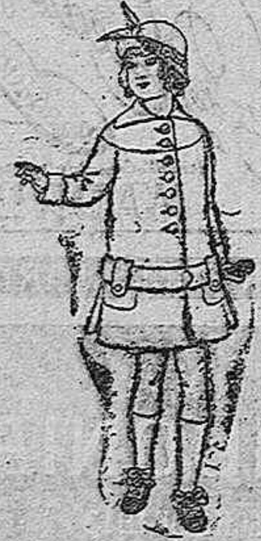
Abrigos de patén para niñas de 4 a 12 años. De pesetas 15 a 25.