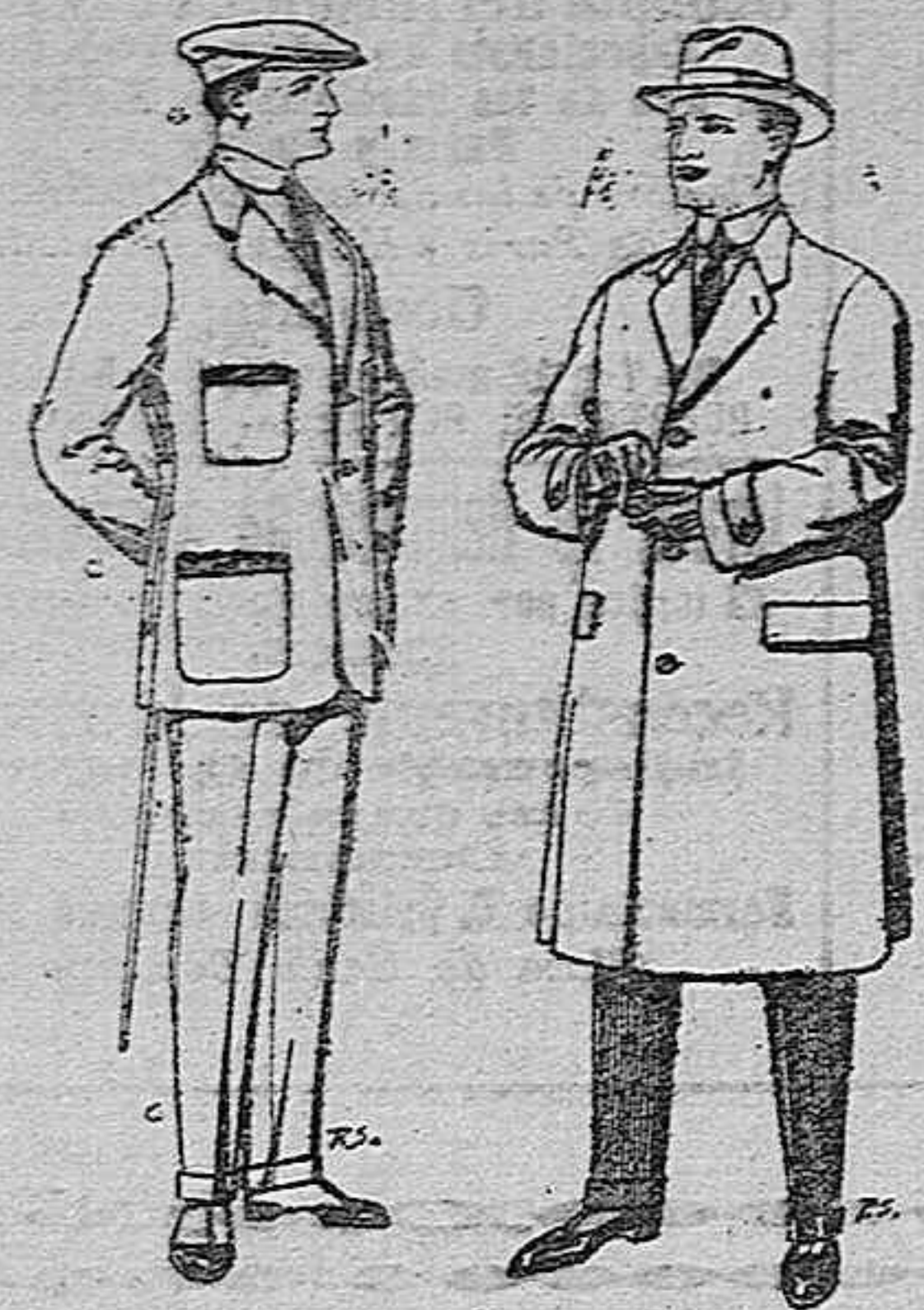
Trajes de cheviotcor te elegante para "Sportman" pesetas 35 a 50.