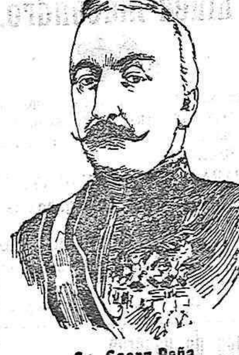
Sr. Saenz Peña. Su popularidad le elevó á la presidencia, y las esperanzas que sus grandes dotes de gobernante se cifran, nos le presentan como un repúblico llamado á colmar de felicidades y venturas á su pueblo.

Se alquila el piso alto de la casa número 2 de la Reina, esquina al Malecón. En esta imprenta informarán.