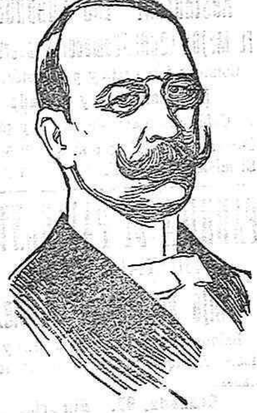
Sr. Figueroa Alcorta. Si nada tiene que reprochar el pueblo argentino al Sr. Figueroa Alcorta; por el patriotismo, probidad y talento con que ha ocupado el alto puesto que ahora abandona, su confianza respecto al nuevo presidente es ilimitada.

ta, presidente saliente, y á D. Roque Saenz Peña, su sucesor.