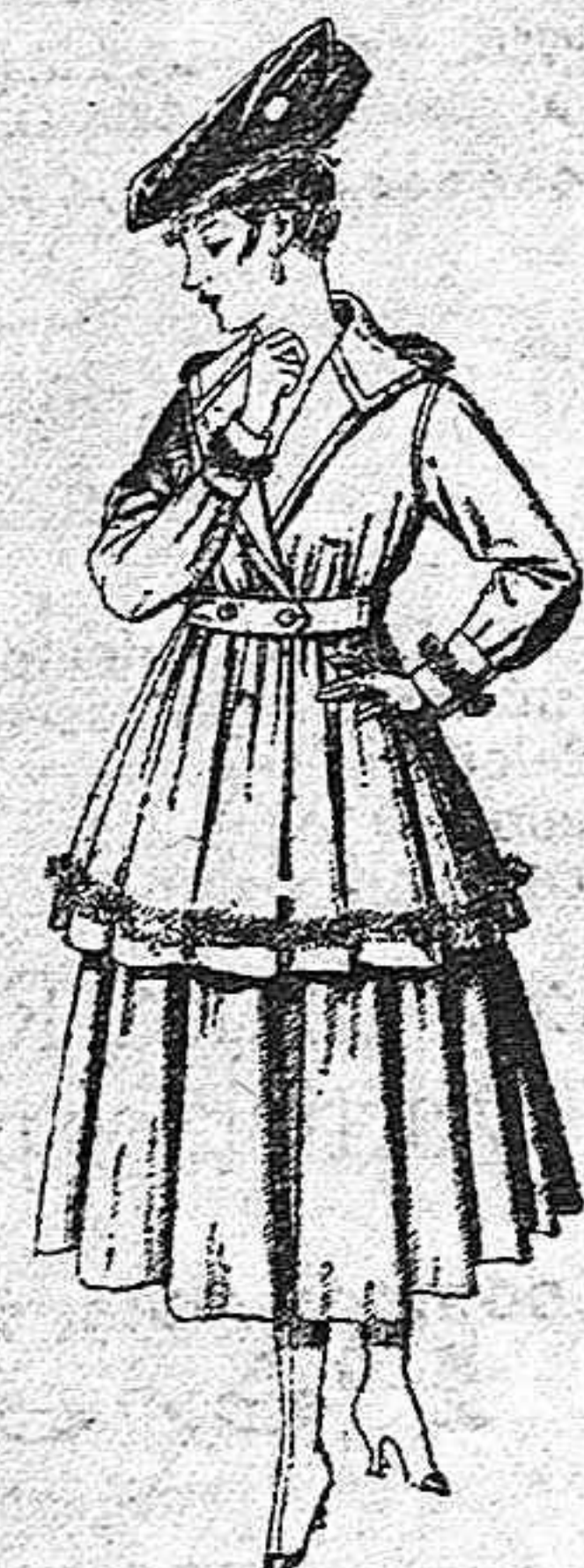
Gabanes de patén o cheviot, con cinturón. De pesetas 30 a 110 Los mismos a medida. De pts. 65 a 145.