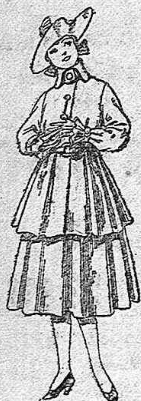
Trajes de lana, para jovencitas de 12 a 15 años, de pesetas, 45 a 55