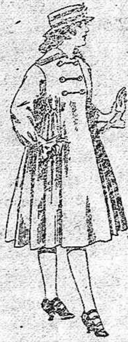
Abrigos de patén para jovencitas de 11 a 15 años, de pesetas, 35 a 50