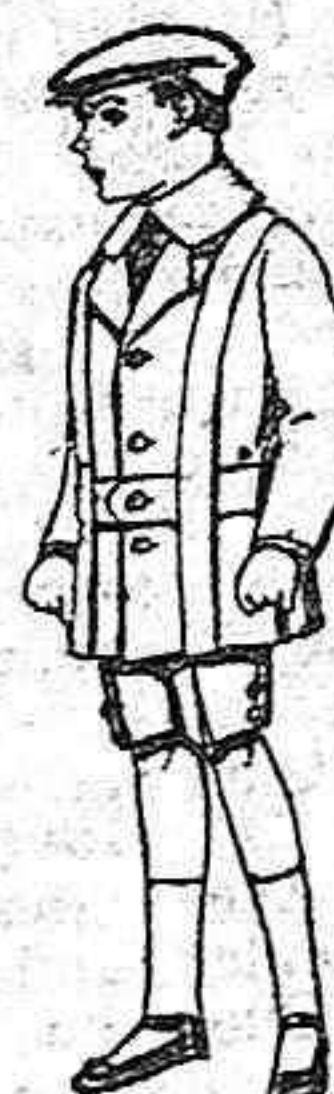
Trajes de patén para niños de 4 a 9 años. De pesetas 12 a 33.