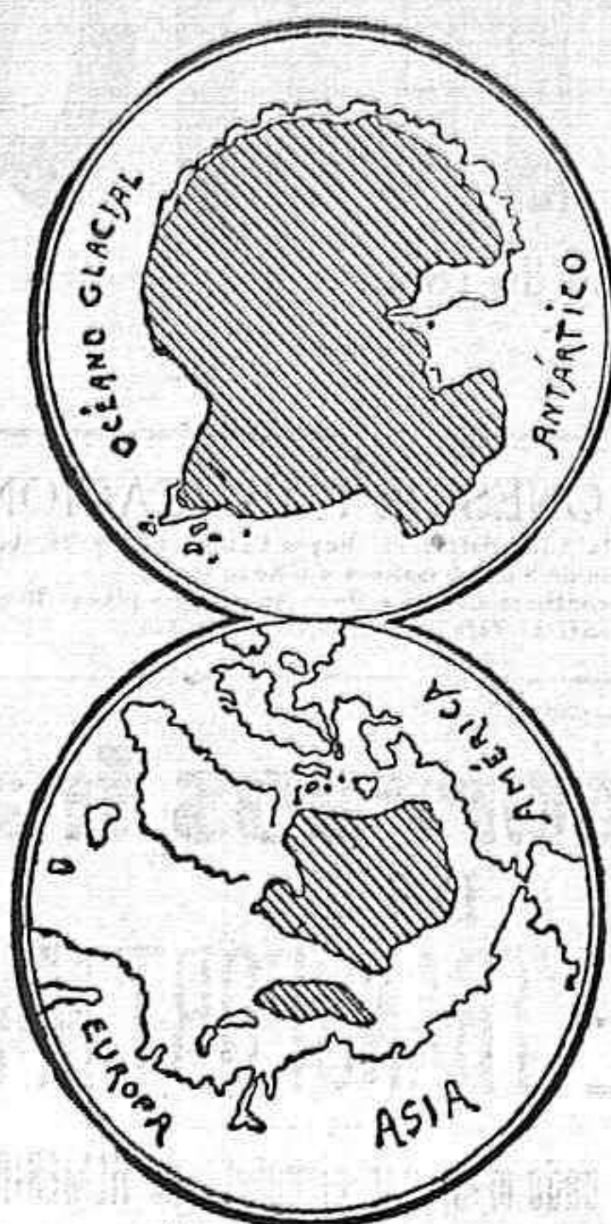
Gráfico comparativo de las regiones inexploradas del polo Norte y del polo Sur. Lo rayado indica las proporciones desconocidas