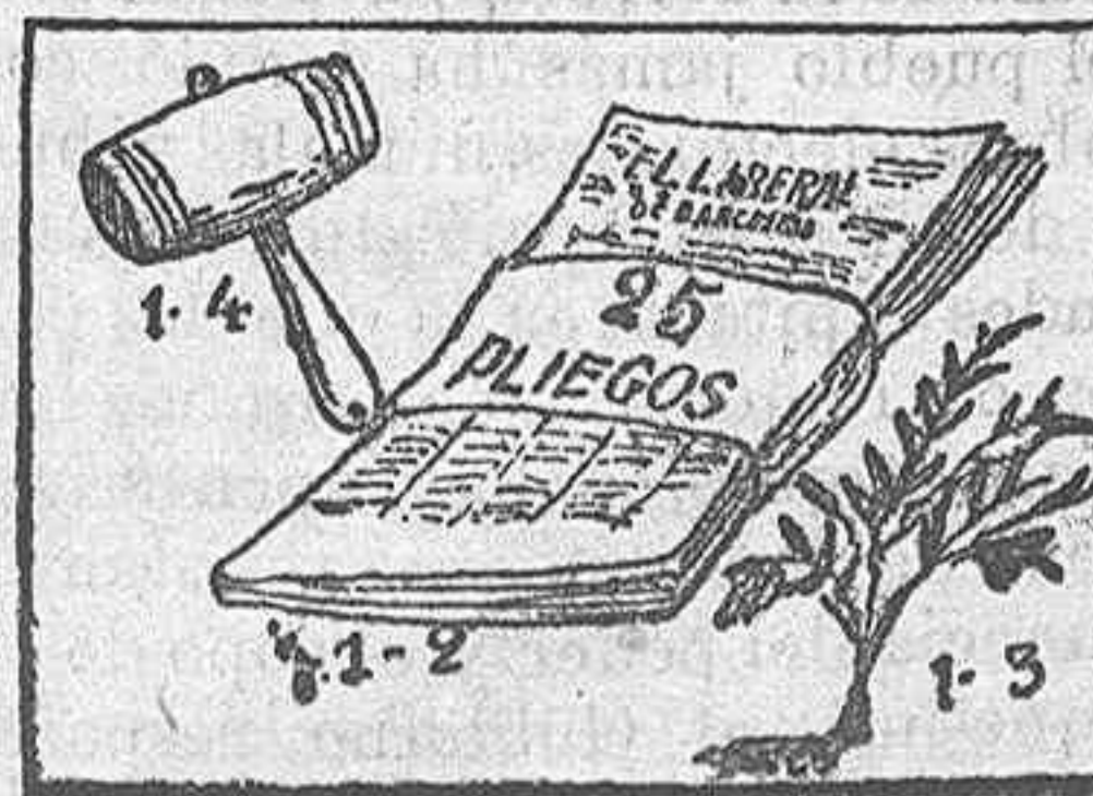
La solución mañana.