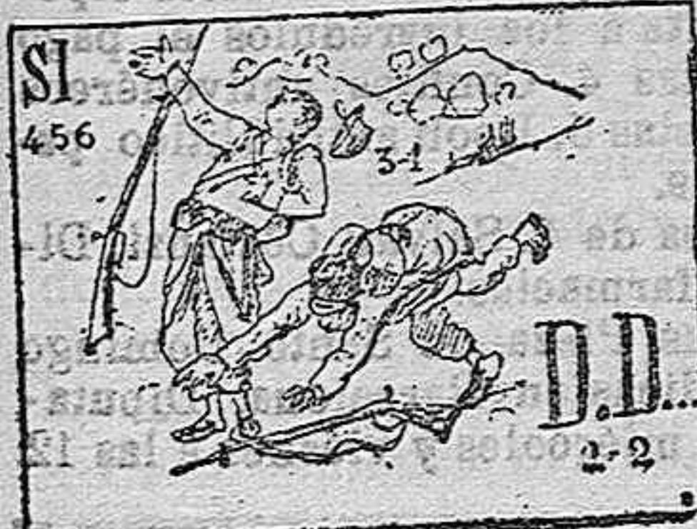
(La solución mañana).